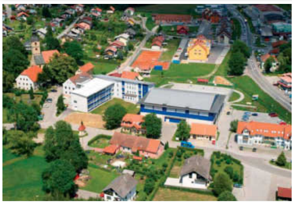
Benedikt bo postal turistično mesto

Benedikt zavežala za to. Investicija sodi med okoljsko infrastrukturo za potrebe turističnega objekta oziroma za potrebe opravljanja gospodarske dejavnosti ter za potrebe prebivalcev dela naselja Benedikt. Po besedah svetovalke