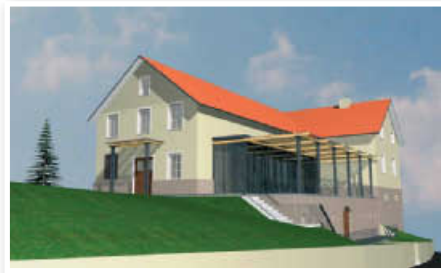
Maketa novega kulturnega doma v Sv. Juriju