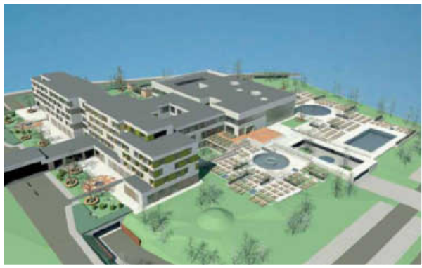
Terme Benedikt, kakor so si jih zamislili arhitekti

Občini Benedikt se nadaljujejo aktivnosti v pripravi na izgradnjo Term Benedikt. Že marca lani je občinski svet sprejel odlok o občinskem podrobnem prostorskem načrtu za terme, sedaj pa nameravajo zgraditi tudi komunalno infrastrukturo za ta bodoči turistični objekt, saj se je občina