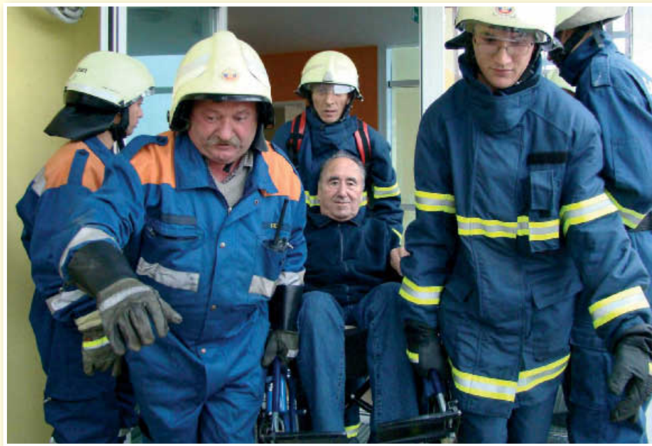
Reševanje invalida po požarnem izhodu iz Doma Lenart na vaji

Usposobljenost lenarških gasilcev in sodelovanje z drugimi društvi se je izkazalo zlasti v neurjih in poplavih. Posledice velikega neurja v letu 2008 je odpravljalo skupno šestnajst društev. Največ (preko 130) je bilo popravil ostrejših stanovanjskih, gospodarskih in industrijskih objektov. Odstranili so še podrta drevesa, črpali vodo iz kleti in cestnega podvoza in – kot zanimivost – reševali celo štokljko.