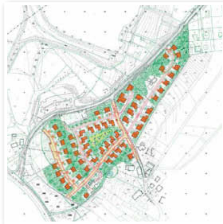
Območje, ki ga ureja podroben prostorski načrt, obsega 5,7 hektara zemljišč

Pred kratkim je stopil v veljavo »Odlok o občinskem podrobnem prostorskem načrtu za južni del naselja Sveta Trojica v Slovenskih goricah«, ki so ga občinski svetniki sprejeli na seji konec januarja. »Odlok določa ureditveno območje, umestitev načrtovane ureditve v prostor, zasnove projektnih rešitev in pogojev glede priključevanja objektov na gospodarsko javno infrastrukturo ter rešitve in ukrepe za celostno ohranjanje kulturne dediščine in narave. Prav tako ta odlok določa tudi rešitve oziroma ukrepe za obrambo in varstvo pred naravnimi in drugimi nesrečami ter etapnost izvedbe prostorske ureditve in dopustna odstopanja,« pojasnjuje direktor občinske uprave v občini Sveta Trojica v Slovenskih goricah Srečko A. Padovnik . »Namen omenjenega prostorskega načrta je gradnja stanovanjskih objektov in objektov gospodarske javne infrastrukture na stanovanjskem območju. Strokovne podlage je izdelalo podjetje ZUM.«