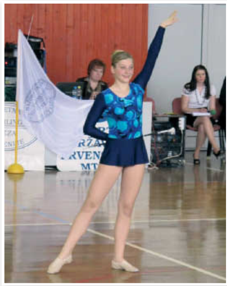
Iz tekmovanja v twirlingu

evropsko prvenstvo bodo lahko odpotovale tudi najboljše uvrščene skupine, ki so tekmoval v pom-pom kategoriji, to so Sevnica, Laško in Hrastnik.