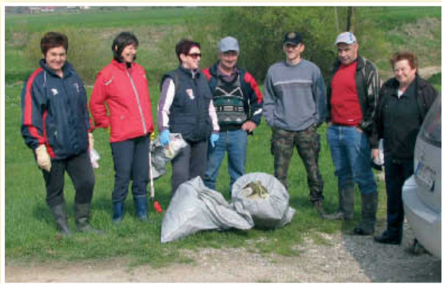
Ribici in prostovoljke na čistilni akciji ob Pesnici