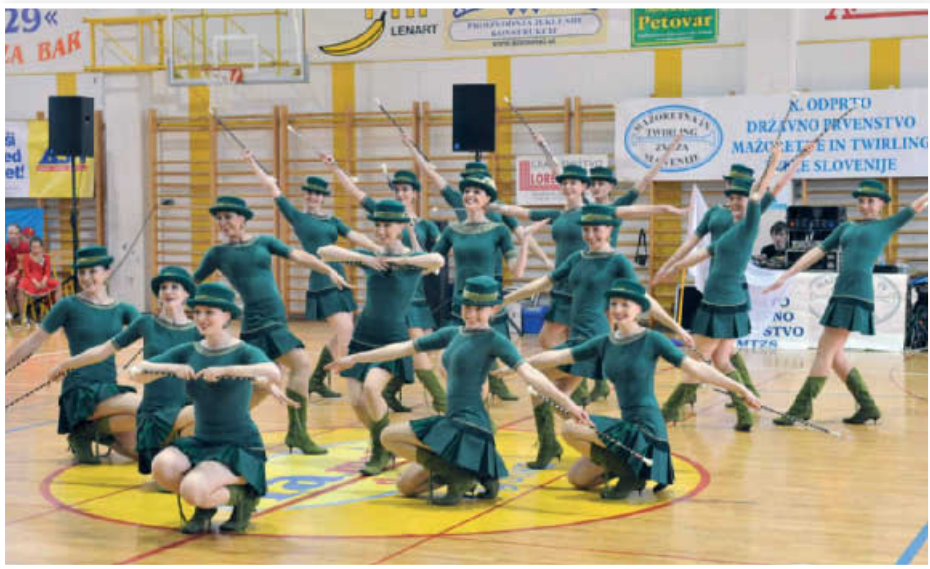
Zmagovalne mažoretke iz Laškega

Uvrstitve najboljših mažoret na državnem prvenstvu veljajo tudi kot kvalifikacija za uvrstitve na Evropsko mažoretno prvenstvo. Tega se bodo udeležile po tri najboljše solistke in pari iz kategorije junior in senior, v kategoriji skupin pa so prva tri mesta v kategoriji kadeti osvojila društva iz Radeč, Komende in Radovljice, v kategoriji junior skupin Horjul, Trebnje in zopet Radeče. Državne prvakinja in pravico do udeležbe na evropskem prvenstvu v kategoriji senior skupin pa so osvojile mažorete iz Laškega, kot drugo uvrščene mažorete iz Logatca in kot tretje uvrščene mažorete iz Trebnjega, ki so letos tekmovalce ob živi glasbi v spremstvu domače godbe OPO Trebnje. Na