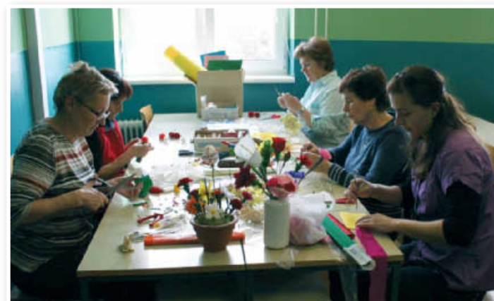
Zavzeto delo udeleženk delavnice