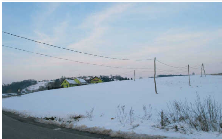
Na tej blagi vzpetini bo v naslednjih letih zraslo novo naselje

drževalnika. Na obravnavanem območju je velika možnost pojavljanja precejnih voda, zato bo treba izvesti dreniranje objektov. Napajanje predvidenih stanovanjskih objektov bo možno iz nove transformatorske postaje