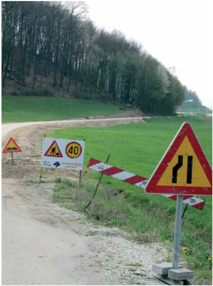
Jože Kraner: Največje gradbišče je trenutno na priključni cesti na avtocesto po dolini od Brengove preko Čagone do Drbetincev