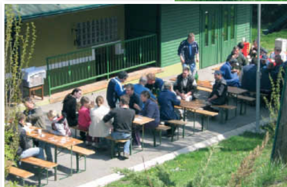
Okrepčilo po končani akciji se je prav privileglo