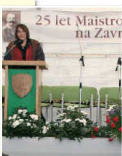
Obrambna ministrica RS Ljubica Jelušič: »Ohranjanje zgodovinskih dejstev je pomembno za ohranitev identitete Slovenskega naroda.«

»V Zavrhu so Maistrovi borci po nenaklonjenostih in nešteti krivicah imeli svoj drugi dom. Tukaj so se počutili varne in tukaj so tudi celili svoje rane, ki so bile velike. Ne bomo obsojali ljudi iz tistega časa, ampak bilo je mnogo ideoloških ovir, za-