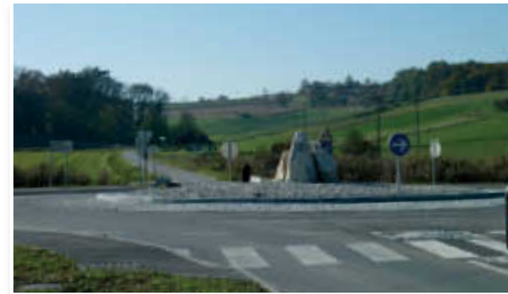
Bo to krožišče leta 2014 že vodilo goste v benediške terme?

Zavedajo se, da gre za velik finančni zalogaj, zato naj bi investitor najprej zgradil termalni hotel, v drugi fazi terme in v tretjem delu še apartmajsko naselje ter dodatne rekreacijske objekte.