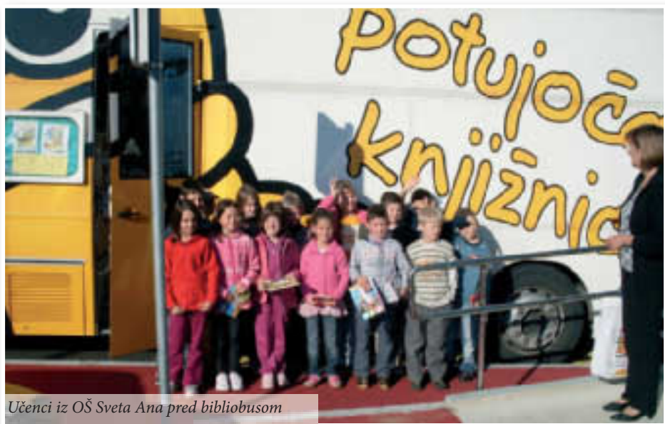
Učenci iz OŠ Sveta Ana pred bibliobusom

Lepo je videti te male in malo večje učenjake, ki prihajajo v knjižnico. »Zakopljejo« se v knjižne koticke, postali so že pravi poznavalci knjižnega sveta. Polni so otroškega zanimanja in povpraševanja po knjigah,