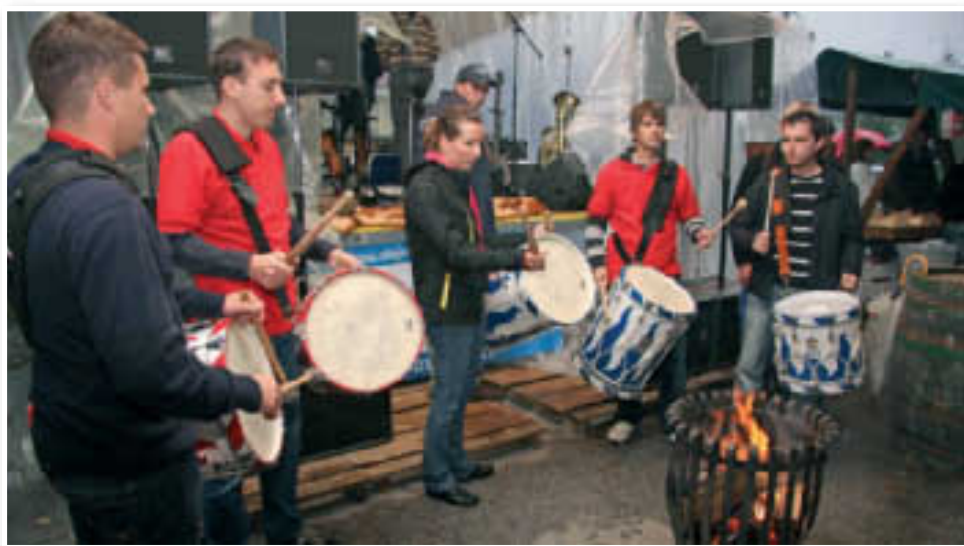
Bobnarji društva Cesarsko kraljevi Ptuj so poskrbeli za imenitno vzdušje