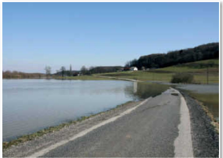
Reka Pesnica ob močnejšem deževju kljub regulaciji pogosto prestopi bregove

letih nekajkrat oklestila njihov pridelek in tem tudi zaslužek. Tako so se letos povsem upravičeno nadejali obilne in kvalitetne letine. Žal pa je letošnji september bolj kot s soncem postregel z rekordno količino padavin in se s 189 litri na m 2 vpisal kot najbolj »moker« september v zadnjih desetih letih v Slovenskih goricah. Desetletno septembrsko povprečje je bilo krepko preseženo, saj znaša 117 litrov na m 2 . Večja količina dežja v zadnjem desetletju je padla le še v treh mesecih in sicer julija in avgusta 2005 – 235 in 217 litrov na m 2 - ter v lanskem avgustu, 192 mm