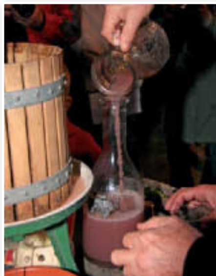
3 litre mošta so člani TD Rudolf Maister Vojanov predali v kletarjenje Društvu vinogradnikov Lenart

In naj na koncu dodam še nekaj besed v svojem imenu sedanjega Ovtarja Slovenskih