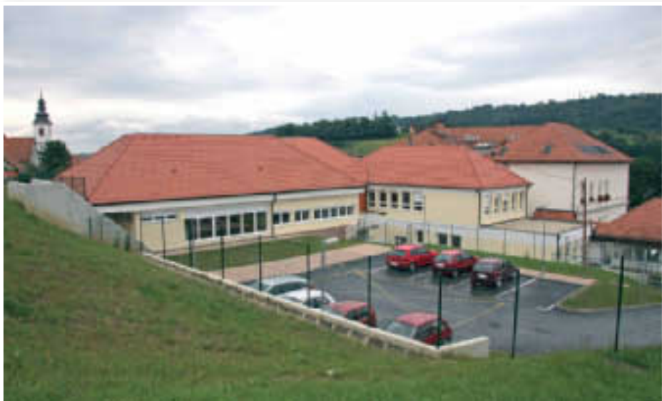
Pogled na nov prizidek k OŠ Voličina s parkiriščem pri novem vrtcu

V sklopu praznovanja farnega zavetnika, Sv. Ruperta, je šola postavila na ogled svojo novo notranjo podobo. Poleg ogleda novih