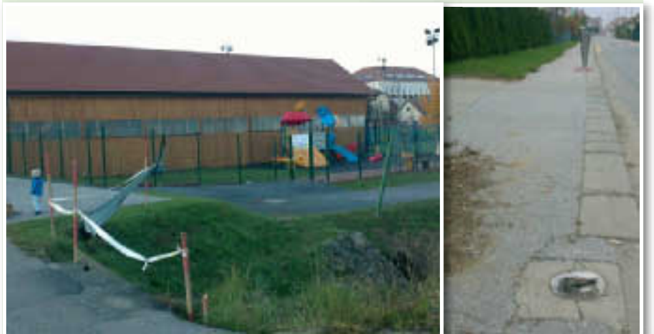
Poškodovana ograja na mostu tako kot pogrezajoči se most čaka na obnovo

slednjih dveh primerih tudi nevarnosti pa daje poškodovana ograja na mostu čez Ruperški potok ter kot britev odrezan steber na pločniku do šole. Zgodbo zase predstavlja podrtija ob vstopu v Voličino iz lenarške smeri in ob prihodu v kraj daje slab vtis. O več kot potrebni obnovi ceste čez Zavrh in Selce pa bi se lahko razpisali kar na nekaj straneh. Na koncu je stvar dokaj preprosta, tisti, ki tukaj živimo, si pač vsakodnevno mislimo svoje. Turisti, ki obiščejo naše kraje in so na eni strani navdušeni nad lepotami in