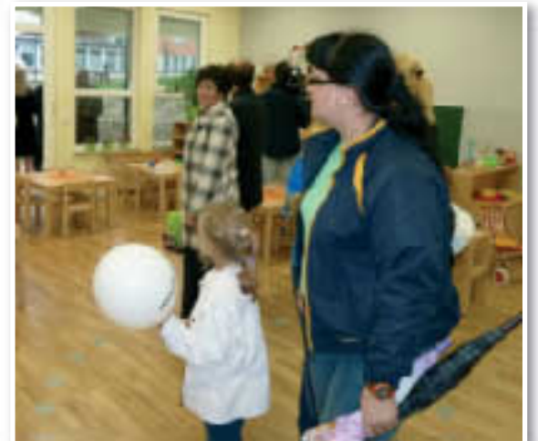
Ena od igralnic ob otvoritvi

Vesela sem in privoščim jim! Le kdo bi znal izmeriti vso ljubezen mnogih vzgojiteljic in njihovih pomočnic, ki dan z dnem sprejemajo v svoje naročje toplino željne otroke.