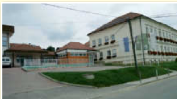
○ Prizidek k OŠ Voličina za nadebudne iskalce znanja in prihodnost