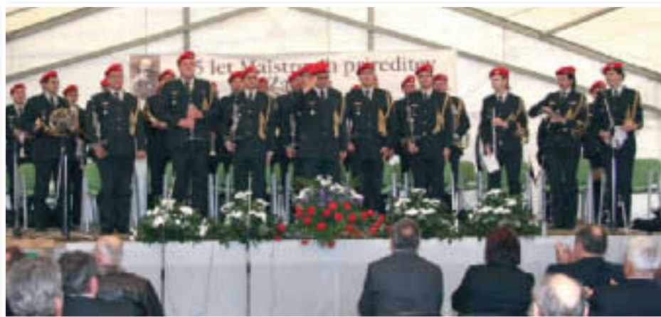
Orkester Slovenske vojske je dokazal, da poleg orožja slovenski vojaki obvladajo tudi glasbene instrumente