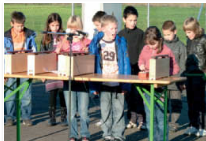
Kulturni program so pripravili učenci OŠ Sv. Trojica

Celotna vrednost investicije znaša 1.300.000 EUR. Operacija je sofinancirana s sredstvi EU (iz Evropskega sklada za regionalni razvoj) 500.000 €. Iz države, iz naslova sredstev za sofinanciranje investicij občin za leta 2008, 2009 in 2010, v skupni višini 199.275,66 €.