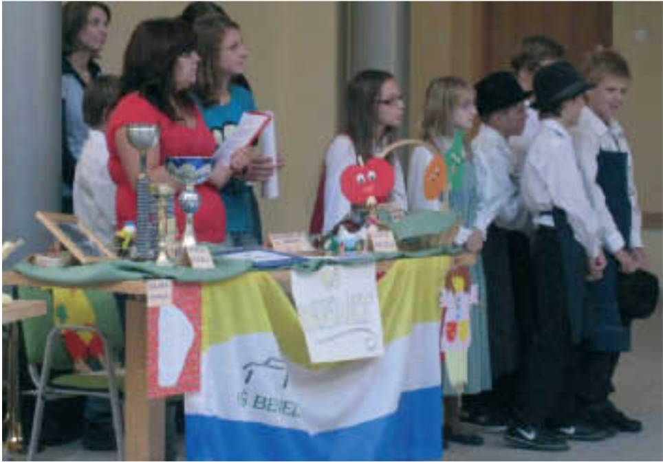
Otroci in učitelji OŠ Benedikt

uspešna in bogata pa je bila prva skupna predstavitev osnovnih šol, ki delujejo na območju Slovenskih goric. Otroci so se predstavili drug drugemu in zunanjim obiskovalcem, poželi bučen aplavz in predvsem uživali v zanimivem popoldnevu. Pred-