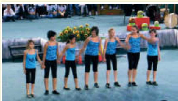
○ Na Sv. Ani so uradno odprli novo športno dvorano