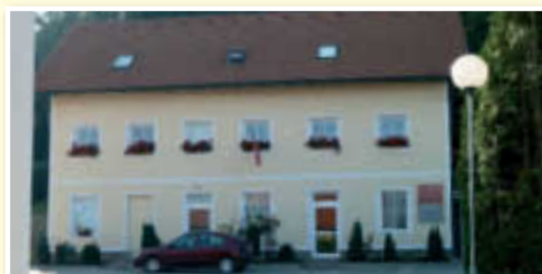
○ Sv. Jurij: nekaj naložb je končanih, nekatere pomembne še čakajo ...