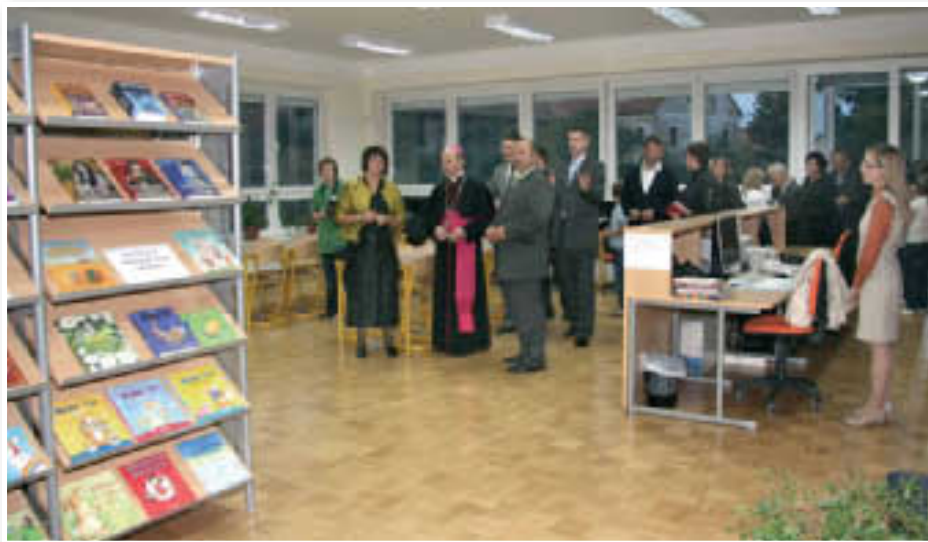
Gostje na ogledu nove knjižnice, ki bo ob šolarjih na voljo tudi drugim občanom občine Lenart