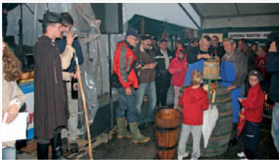
Gneča ob večernem stiskanju grozdja

goric: Vabljeni na prireditve – Trgatev Zavrh 2011! Priprave nanjo potekajo že sedaj, predvsem v smislu analize letošnje prireditve in izboljšanja tistih stvari, ki bodo oceno naslednje prireditve še izboljšale. Popolnoma mirno lahko rečemo, da je zasnova prireditve unikatna, saj podobnih prireditve v našem prostoru do sedaj še ni bilo. Prav tako ne pride v poštev menjava lokacije, saj bi na ta način prireditve izgubila svoj čar, svoj završki čar. Zagotovo pa razmišljam v smeri, da bi v prihodnjem letu zagotovili še več ponudnikov in v samo prireditve vključili še več društev, ki se bodo predstavile na stojnicah pri Maistrovem stolpu. S tem bomo že tako bogato ponudbo še dodatno popestrili, da bo Trgatev na Zavrhu resnično edinstvena. Skrivnost uspeha