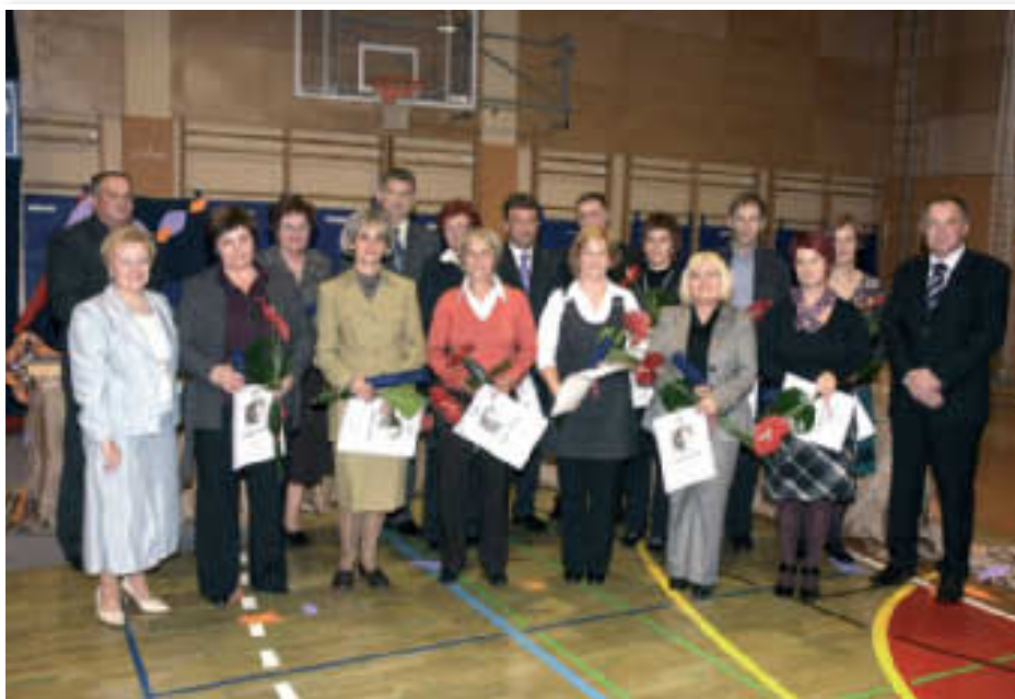
Letošnji nagrajenci Društva pedagogov dr. Antona Trstenjaka v družbi s pomembnimi gosti in vodstvom društva