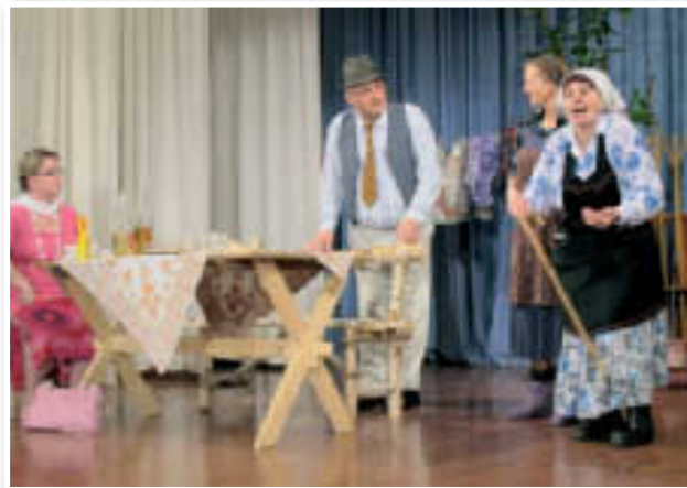
Z uprizoritve Gosposke kmetije v kulturnem domu v Sveti Trojici

»Pred premiero smo imeli veliko vaj, saj je šlo za našo prvo igro,« sta povedali sogovornici. »Samo bralnih