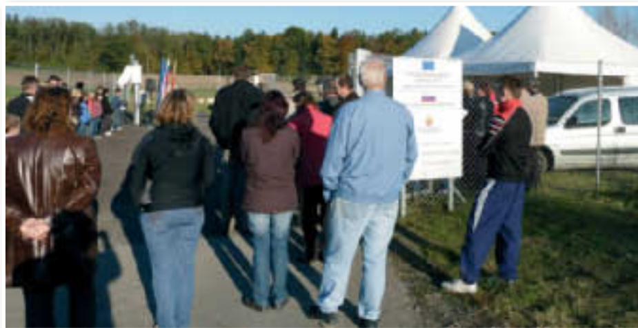
Sklenitve velikega dela okoljevarstvenega projekta se je udeležilo veliko občanov

Ostala potrebna sredstva, torej več kot 600.000 €, je zagotovila občina Sv. Trojica z lastnimi sredstvi iz svojega proračuna.