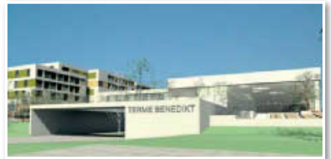
Terme Benedikt po zamisli ljubljanskega podjetja Arhiveda

Terme Benedikt naj bi, po dosedanjih načrtih že do leta 2014, ponudile hotel s 120 sobami, termalne bazene in apartmajsko naselje z 22 enotami. Vrednost naložbe je okrog 50 milijonov evrov. Otežene gospodarske razmere lahko načrte nekoliko odmaknejo, zato bo morda potrebne še nekoliko potrpežljivosti domačinov in potencialnih gostov.