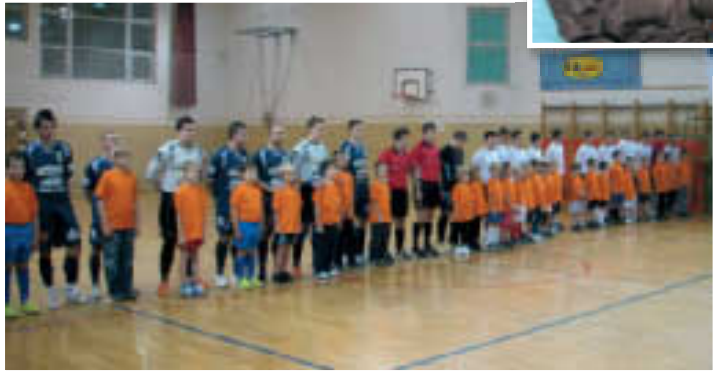
Otroci malonogometne šole KMN Slovenske gorice so na igrišče pripeljali domačo ekipo Voličine in gostujočo iz Škofje Loke

Uresničile so se napovedi, da bo letošnja sezona zaradi združitve lige precej kvalitetnejša in zanimivejša kot prejšnje. Že na začetku je bila pravemu malonogometnemu spektaklu priča polna dvorana v Voličini, kjer so se po-