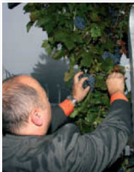
S trgatvijo potomke najstarejše vinske trte na svetu je začel župan občine Lenart

Trgatev v vinogradu je bila zaradi dežja zgolj simbolična, prav tako simbolična pa je bila 1. uradna trgatev potomke najstarejše vinske trte na svetu, ki je bila izvedena v sklopu krajšega kulturnega programa v popoldanskih urah. TD Rudolf Maister Vojanov Zavrh je približno 3 litre mošta predalo v kletarjenje Društvu vinogradnikov Lenart, ki bodo prvo vino te trte ponudili tradicionalnim prvomajskim pohodnikom na Zavrhu. Za popestritev in otvoritev kulturnega programa so poskrbeli srednjeveški bobnarji društva Cesarsko Kraljevi Ptuj, med tem ko so Štajerski fakini zabavali obiskovalce pozno v noč.