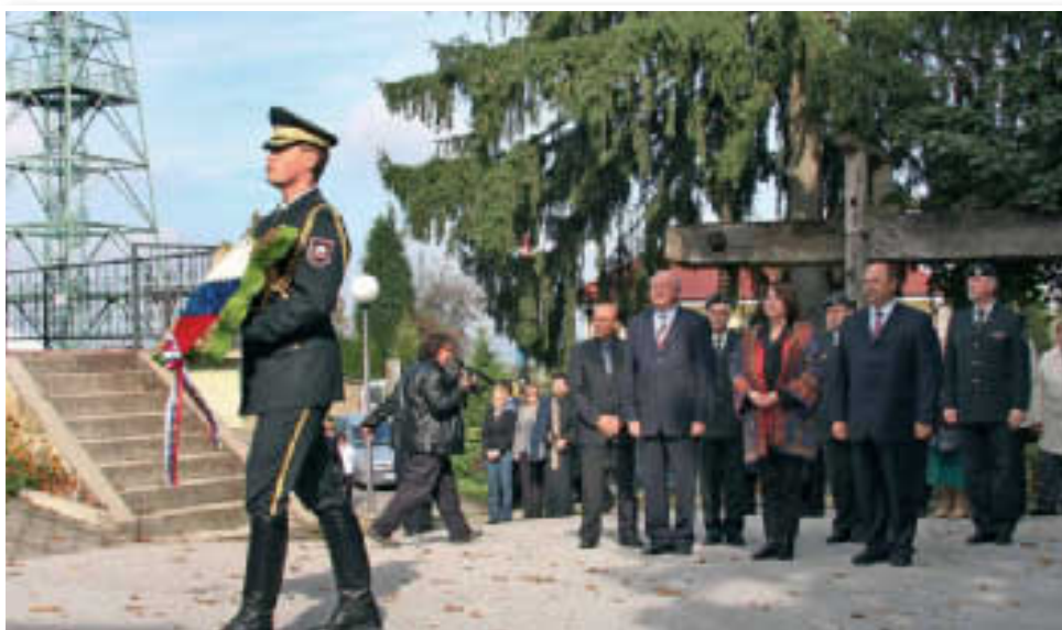
Venec pred Maistrov doprni kip je ob prisotnosti obrambne ministrice dr. Ljubice Jelušič, generalov Slovenske vojske, župana občine Lenart ter drugih zbranih gostov na Zavrhu položila častna četa Slovenske vojske