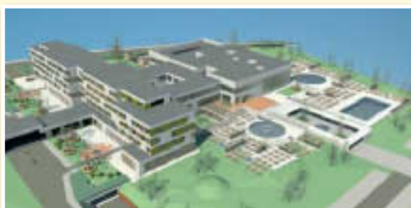
○ Investitorji v Terme Benedikt čakajo gradbeno dovoljenje