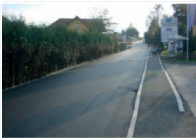
»S pričetkom obnove vodovoda smo želeli pohiteti zaradi sočasnosti del z obnovo povezovalne ceste v centru občine!«

gustu in septembru zahtevali odobrena sredstva. Celotno zadevo še dodatno otežuje v začetku leta sprejeta slovenska zakonodaja, ki nalaga namesto 60-dnevne 30-dnevne plačilne roke. »S pričetkom obnove vodovoda smo želeli pohiteti zaradi sočasnosti del z obnovo povezovalne ceste v centru občine, na ta način smo namreč v enem mahu opravili kar dve deli,« pojasnjuje župan občine Sv. Jurij v Slovenskih goricah. Do sedaj so v Jurovskem Dolu obnovili približno 1,5 km