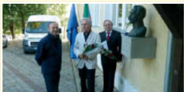
○ 25. Maistrove prireditve za krepitev slovenske narodne zavesti