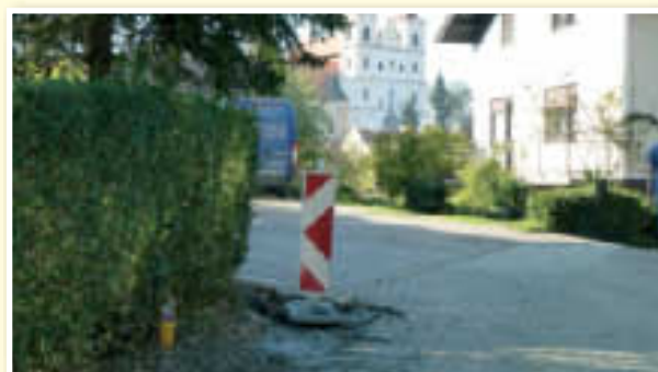
○ Obnovljen vodovod, kanalizacija in čistilna naprava v Sv. Trojici