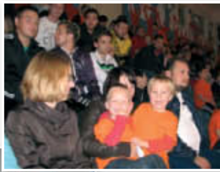
Polna dvorana v Voličini pomagala domačim do preobrata proti Webbru iz Škofje Loke

1:3), medtem ko so v gosteh proti neugodni ekipi Nazarje zmago izpustili prav v zadnji minuti (3:3) ter kljub vodstvu 3:0 osvojili le točko. Po nič kaj ugodnem startu v sezono in porazu proti FSK Ke-