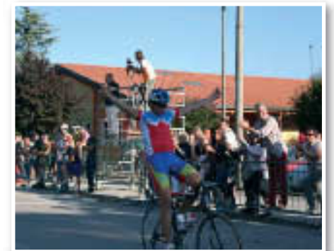
Zmagoslavni dvig rok ob prihodu v cilj