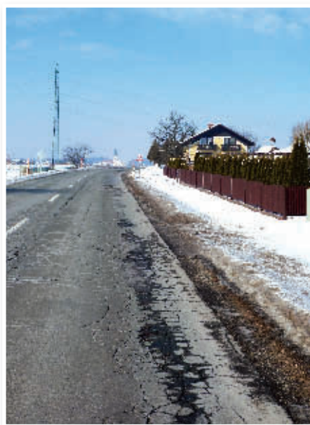
Poškodovana cesta v Radehovi

Za zimsko službo na območju občine Lenart je bilo do 9. februarja porabljenih 80.737 EUR. Člani občinskega sveta in javnost so bili seznanjeni, da so na podlagi Zakona o uveljavljanju pravic iz javnih sredstev s 1. 1. 2012 prešla določena dela in pristojnosti s področja socialnih zadev na Center za socialno delo Lenart, in sicer: obvezno zdravstveno zavarovanje, znižano plačilo vrtca ter subvencije najemnin za stanovanja. Na Centru za socialno delo Lenart se je zaposlila tudi delavka