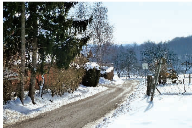
V Kadrencih bodo uredili cesto in pločnik do novega športno-rekreacijskega centra

V zadnjem času so bili v Cerkvenjaku trije požari, ki so prizadetim povzročili veliko škode. Tistim, ki jih je požar najbolj prizadel, je pri sanaciji in odpravljanju posledic pomagala tudi občina Cerkvenjak. Katere druge naloge in aktivnosti pa so trenutno v občini Cerkvenjak še v ospredju?