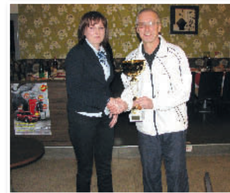
Zmagovalni pokal si je prislužila ekipa Paf iz Lenarta; foto: Bojan Gradišnik

Najboljše povprečje posamezno so v 1. krogu dosegli; Grega Tuš (Paf) 186,25 točk, Igor Kmetič (PC Mobil) 186 točk in Tanja Špenga (Beli labod) 184,5 točk. Najboljša igra z 219 točkami pa je uspela Jožetu Dukariču.