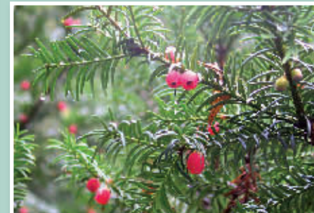
Tisi izpod Nanosa

parka ali botaničnega vrta. Če vas bo pot zanesla na Solčavsko, se le ustavite pri 700 let stari tisi. V Stranah pod Nanosom se pri cerkvi sv. Križa bohotita tisovec,