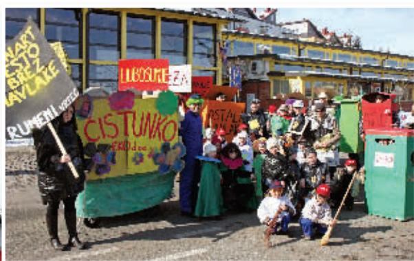
pine iz Sv. Trojice, Pernice, kurenti z ruso iz Leskovca v Halozah, orači iz Gruškovja.