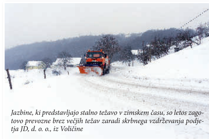
Jazbine, ki predstavljajo stalno težavo v zimskem času, so letos zagotovo prevozne brez večjih težav zaradi skrbnega vzdrževanja podjetja JD, d. o. o., iz Voličine

delovanje soli, kar pomeni, da so cestišča in pločniki kljub posipavanju in pluzenju spolzki. Zaradi takšnih razmer je nujno poskrbeti za dobro zimsko opremljenost avtomobilov, pa