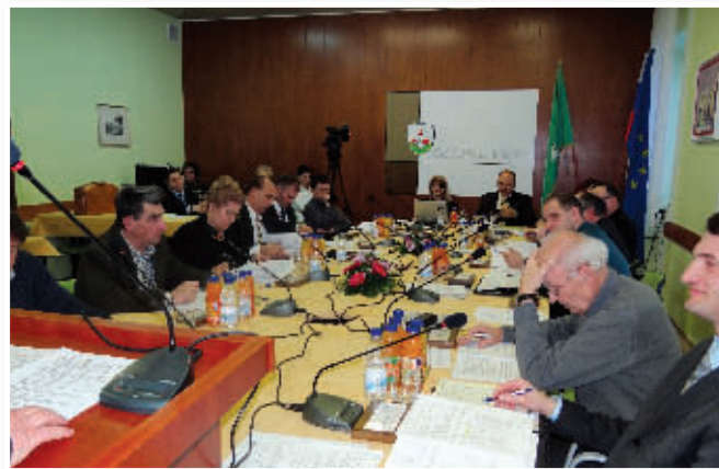
Lenarški občinski svetniki