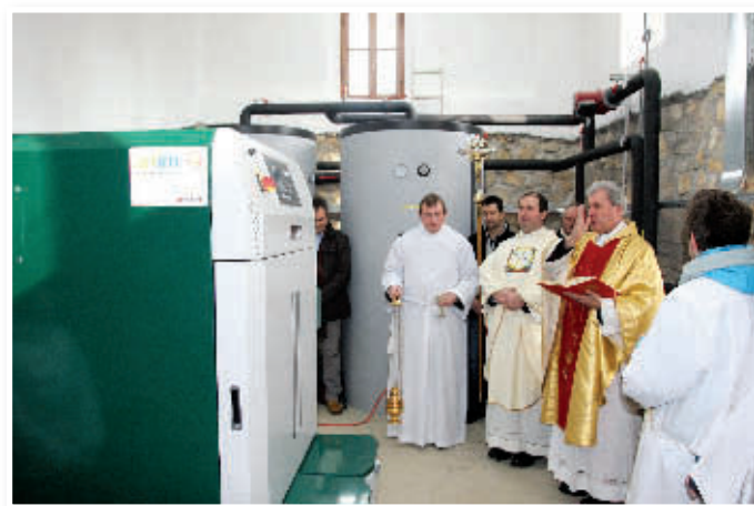
Blagoslov nove kurilnice in kotlovnice pri cerkvi v Benediktu