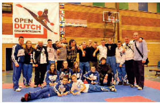
Mariborski taekwondo klub Kelter Hwarang se je iz Nizozemske vrnil s kar 11 odličji

Med tekmovalci mednarodnega odprtega prvenstva Nizozemske v taekwondoju po verziji ITF se je med 548 tekmovalci predstavilo tudi 22 tekmovalcev mariborskega taekwondo