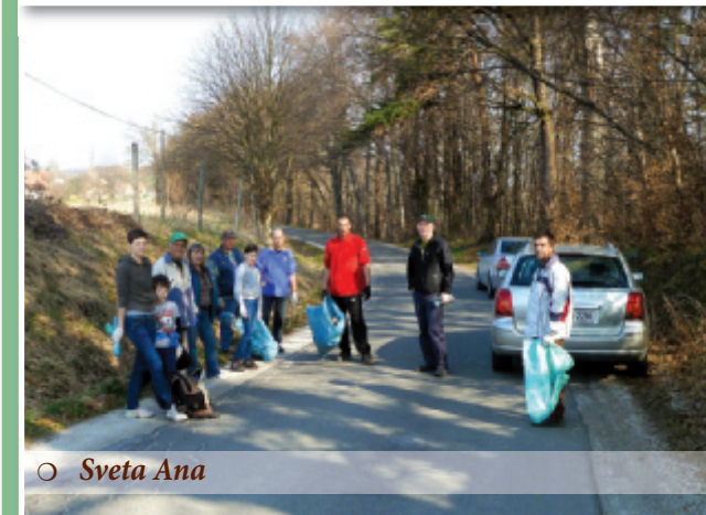
○ Sveta Ana