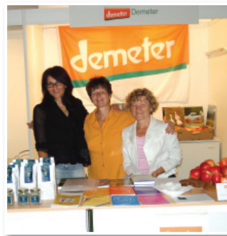
Članice Biodinamičnega društva Podravje

V Sekemu so uspeli z biodinamično metodo v puščavskem pesku ustvariti zeleno oazo, ki meri več sto hektarjev. Poleg številnih kmetij-