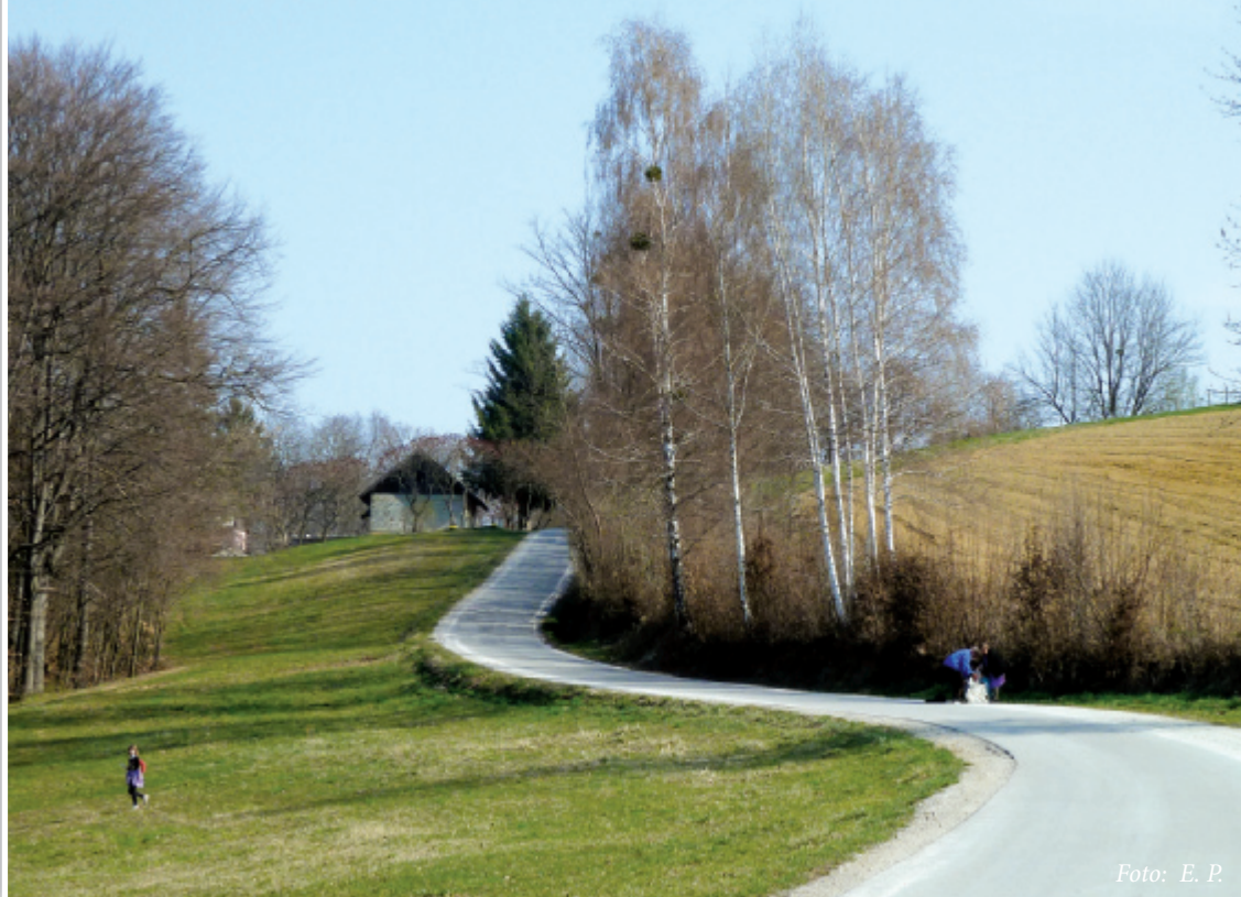
Čistilna akcija na cesti Sv. Ana-Benedikt v Zg. Bačkovi