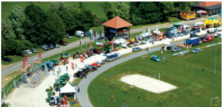
Z lanskega sejma

Nastopi ljudskih godcev in pevcev po vsem sejmu. V nedeljo bo uradna razglasitev ocenjevanja vin širšega slovenskogoriškega ob-