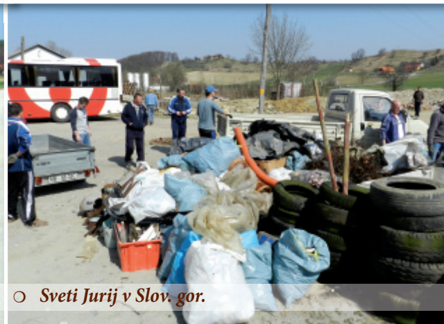
○ Sveti Jurij v Slov. gor.