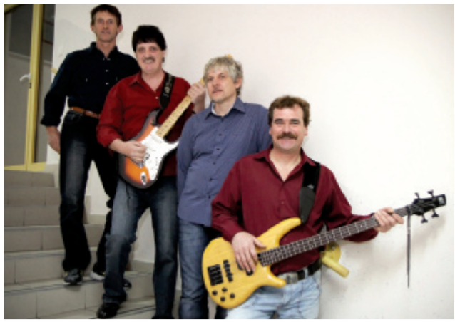
3. decembra 2011 so člani originalne zasedbe VIS Trans prvič po 20-ih letih ponovno stopili na oder na velikem Miklavževem koncertu Anite Kralj v polni športni dvorani v Benediktu ter poželi veliki aplavz.

'Tornero' iz leta 1975 z naslovom 'Vračam se', ki so jo morali igrati tudi po petkrat na noč, 'Socialni problem' v slovenskogoriškem na-