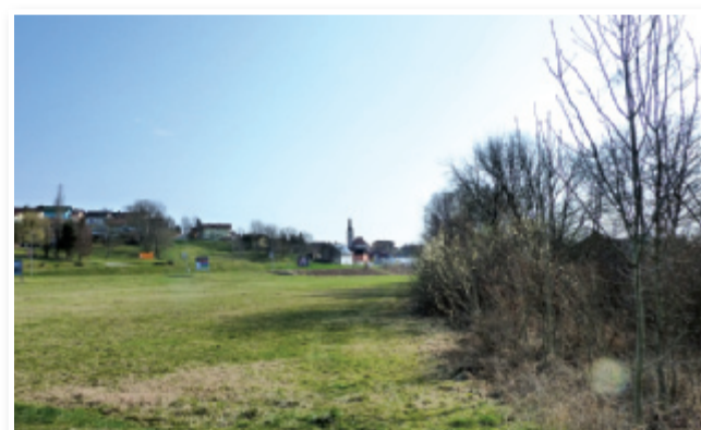
Kmalu bo pogled drugačen!

S to investicijo bosta naš kraj in njegova okolica pridobila nova delovna mesta v storitveni in trgovski dejavnosti. Sodoben dostop v mesto preko bodočega krožišča pomeni dodatno prometno varnost ter prijetno in urejeno okolje. Pridobili bomo tudi dodatne in namenske parkirne prostore za športno-rekreacijski center, ki ga želimo v bodoče razvijati. Pripravljene imamo projekte za novo veliko nogometno igrišče z umetno travo. Večnamenski prostor je primeren za najrazli-