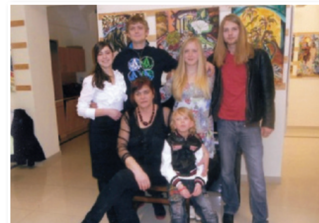
Razstava v Centru Slovenskih goric je odprta do 30. marca, torej je na ogled še za materinski dan. Avtorica sama pravi: »Mesec marec je mesec mamic, žena in predvsem to sem tudi sama, saj je zmeraj ob meni mojih pet otrok.«