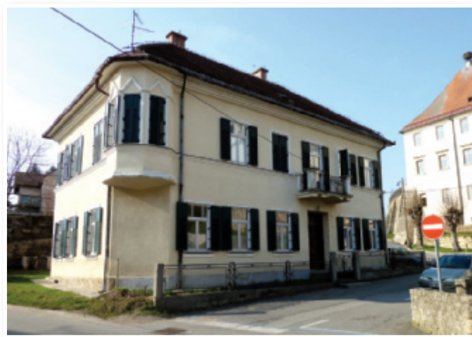
V tej zgradbi je bila pred časom trojiška ambulanta

»Tej zgodbi o pomanjkanju finančnih sredstev za delovanje osnovne zdravstvene mreže v občinah v osrednjih Slovenskih goricah je piko na i dodala občina Cerkevjak s tem, ko je brez soglasja zdravstvenega doma podelila koncesijo za ambulanto splošne medicine v