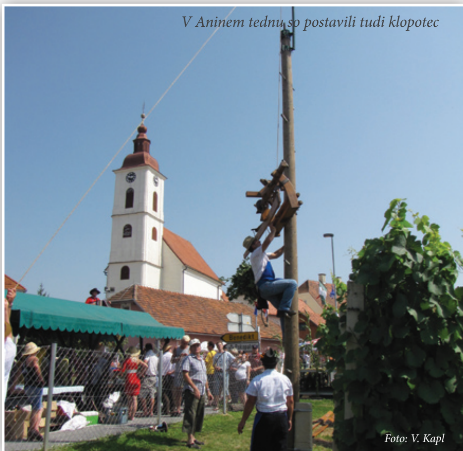
V Aninem tednu so postavili tudi klopotec