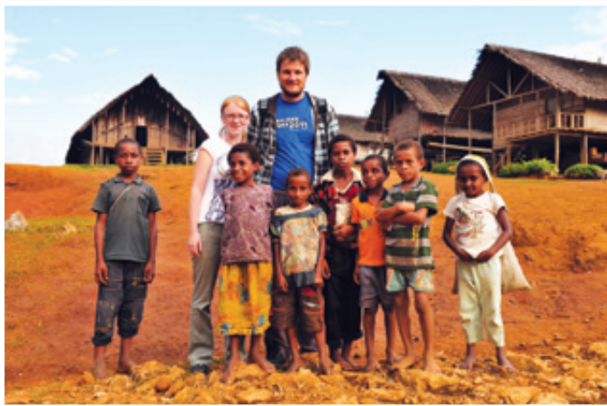
Pisca članka z vaškimi otroki ...

To se je hitro spremenilo, ko smo prispeli v našo vas Pimaga. Do tja smo ponovno leteli, ker je v državi le ena cesta, katero smo nato še skoraj v celoti prevozili v osmih urah. Po naporni vožnji smo se tako znašli sredi džungle, nekje v centru države, v hribovju na približno 800 metrih nadmorske višine.