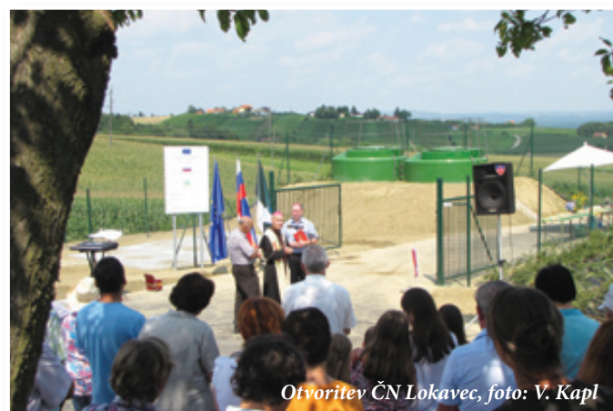
Otvoritev ČN Lokavec