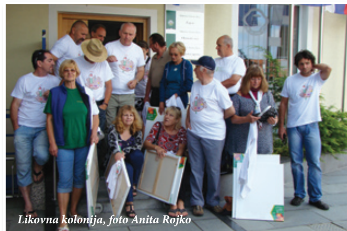
Likovna kolonija

cevodov. Na ČN bo v prihodnjih dveh letih priključeno 36 gospodinjstev iz nase-