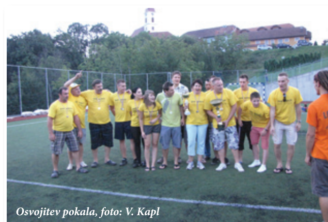
Osvojitve pokala

okrepčevalnici Šenk. Ob tem kulinaricnem tekmovanju so zbirali prostovoljne prispevke, ki so bili podarjeni šolskemu skladu OŠ Sveta Ana.