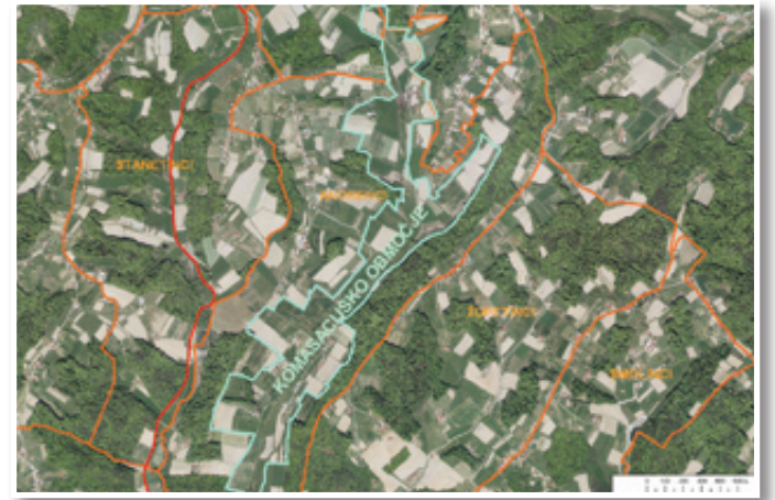
Celotno komasacijsko območje