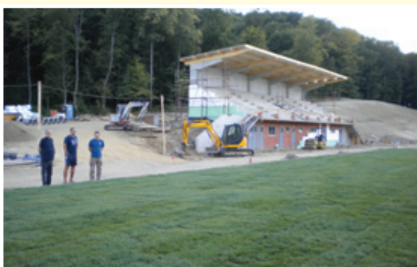
○ V ŠRC Cerkvenjak igrišče dobiva travo