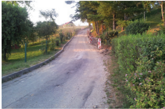
Na Lešnikovem klanecu so dela za rekonstrukcijo ceste že stekla

Projekt zajema poleg že omenjene ceste obnovo cest JP 705 340 in JP 705 342 – Malna- Zelenko ter cest JP 703 471, JP 703 472 in JP 703 473 – Sp. Gasteraj-Belna, Bračič in Fras. Rekonstrukcija Lešni-