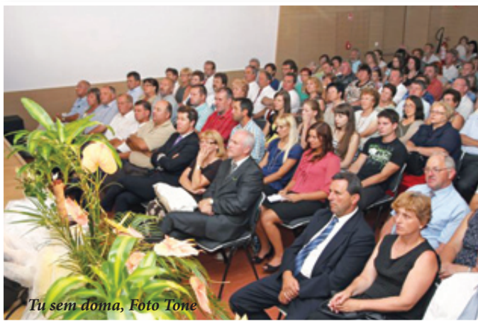
Tu sem doma

Tako slabo vreme ni pregnalo zagrizenih odbojkarjev z lokavške mivke, saj so drugi dan prireditev v občini zgodaj začeli s posameznimi odbojgarskimi dvoboji. Prav tako je bil zaradi deževnega vremena skorajda pod vprašajem 10.