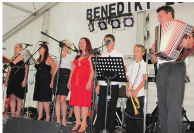
Bogat kulturni program so na zavirljivi ravni izvedli člani »glasbene družine« Fras, ki so jih udeleženci nagradili z viharim aplavzom.