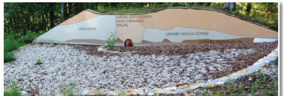
Prezez gomile - premalo znana arheološka znamenitost za pokopališčem pri Benediktu

najznačilnejših prazgodovinskih in antičnih gomil ter drugih arheoloških znamenitosti. Dogovorili so se tudi o zbiranju predlogov trase za arheološko pot. Začetek arheološkega parka in poti je lepo prezentiran prezez