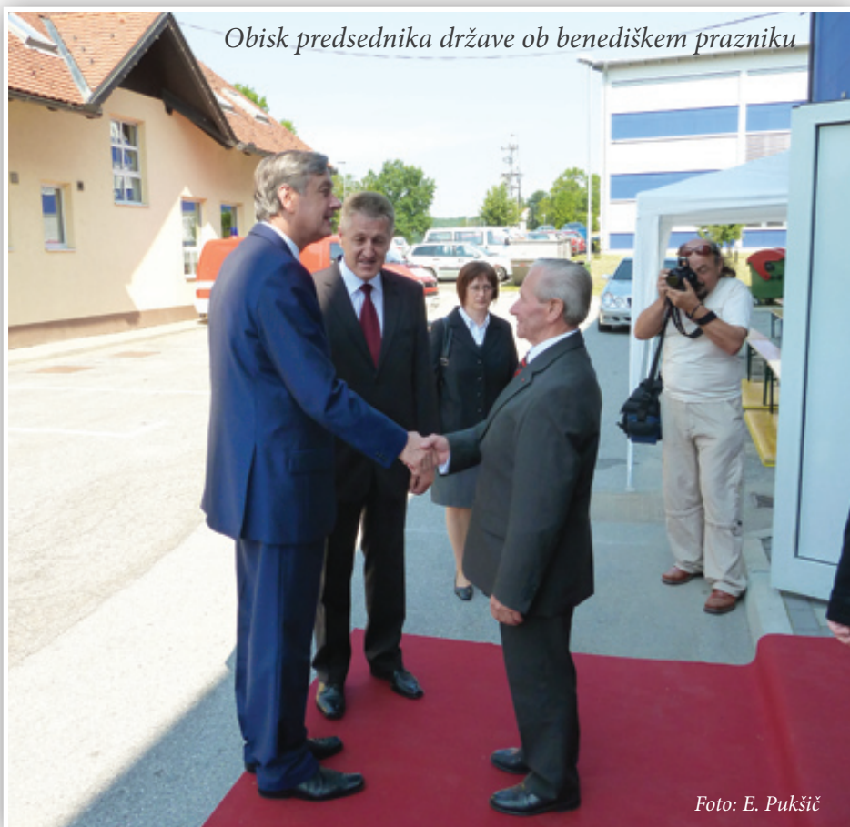
Obisk predsednika države ob benediškem prazniku