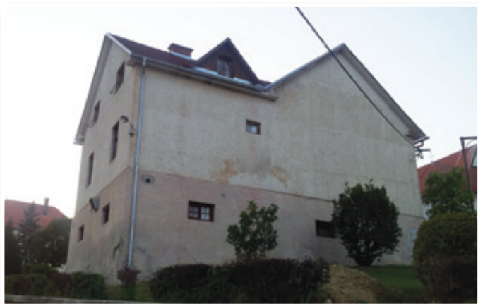
Prihodnje poletje bo Kulturni dom v Jurovskem Dolu že v novi preobleki.

deželja že dobila novo odločbo o zagotovitvi sofinancerskega deleža v višini 388.000 €. K temu jih bo približno 100 tisočakov morala primakniti še občina.