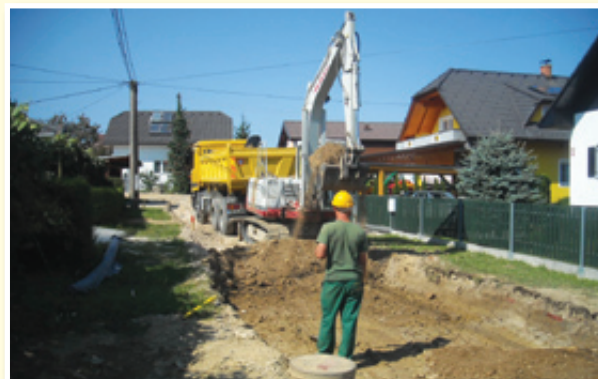
○ Sv. Trojica je veliko gradbišče