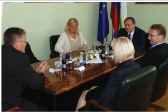
Pogovor z vodstvom občine