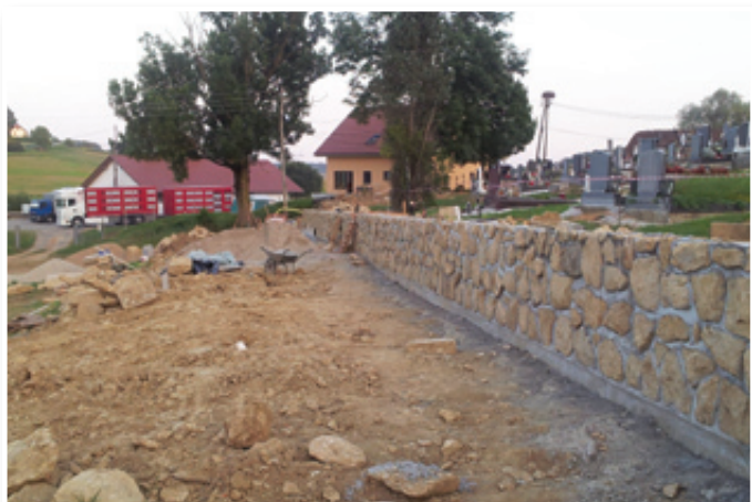
Nov videz ob vstopu v Jurovski Dol bo dalo na novo urejeno obzidje okoli starega dela pokopališča.