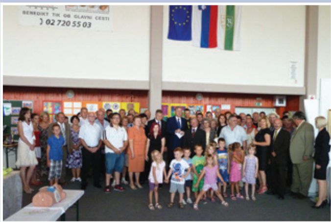
V športni dvorani je dr. Danila Türka sprejela množica domačinov.