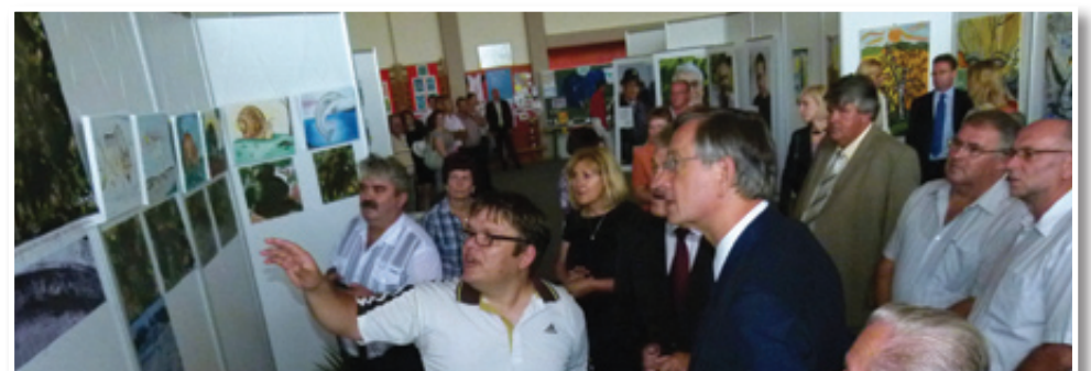
Zgodovinsko društvo Atlantida raj slave je 6. 7. 2012 tudi predsedniku Republike Slovenije predstavilo svoje delo.

va virtualnega muzeja najstarejših časov Slovenskih goric na internetni strani z odprtim forumom mnenj, priprava »arheološke poti oziroma arheološkega parka (na več lokacijah) v občini Benedikt«, njeno reklamiranje, trženje in vzdrževanje.