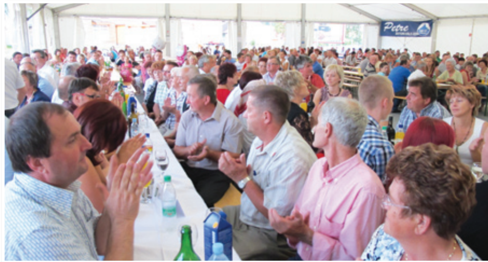
Na županovem večeru v Benediktu se je zbralo »mlado in staro«.