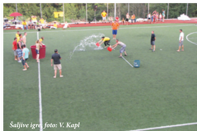
Šaljive igre, foto: V. Kapl

Zvečer istega dne pa je potekalo tekmovanje v kuhanju štajerske kisle juhe pri