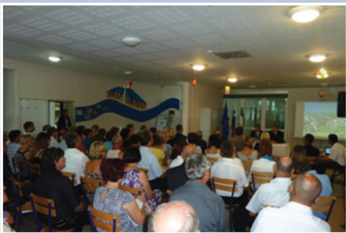
Pogovor s predstavniki gospodarstva, društev in organizacij