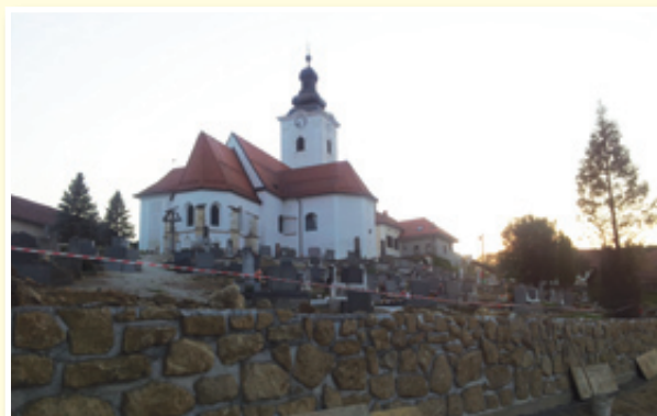
○ J. Dol: obnovljeno obzidje okrog starega pokopališča