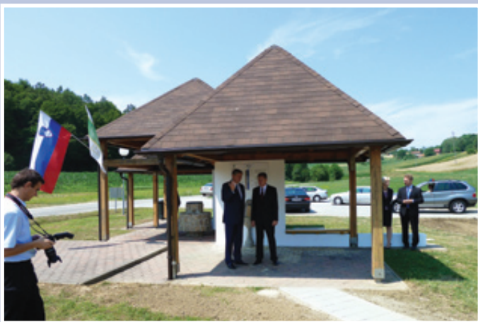
Predsednik Türk se je seznanil s projektom Terme Benedikt.