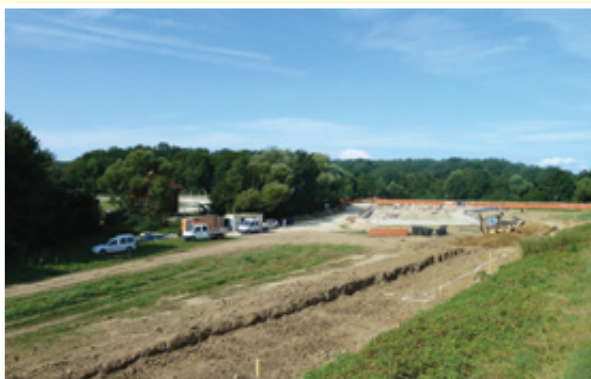
○ V Lenartu raste nov trgovski center

Občini Benedikt in Sveta Ana sta praznovali; sušno poletje nas vodi v jesen, ki bo s pridelki bolj skopa. Svoje bodo pobrali vse bolj ogrožena narava in nepredvidljive gospodarske in politične razmere. Prihaja predsedniška predvolilna kampanja. Čas kliče k premisleku in razumu.