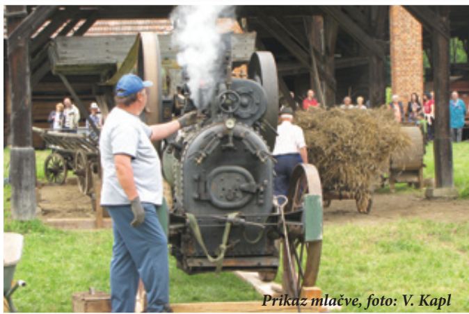
Prikaz mlačve

Nedelja, 22. julija, je obiskovalce Aninega tedna povabila na razstavo del slikarjev in kiparjev v občinsko avlo, kjer so si mimoidoči lahko pošteno naspali oči na likovnih umetninah, kasneje pa so bili vsi povabljeni na Grafonževo domačijo, kjer je sledilo druženje ob ljudski glasbi in plesu ter prikazu mlačve žita na mlatilnici na parni pogon. Prireditve vsako leto požanje veliko zanimanja in tudi letos kljub ne-