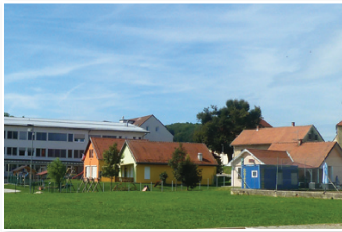
Benediški občinski svet je 28. novembra sklepal tudi o potrditvi Investicijskega programa za izgradnjo vrtca Benedikt.