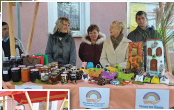
Obisk župana in podžupana občine Lenart