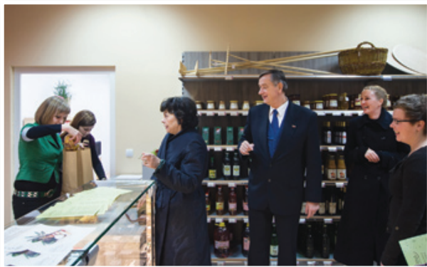
Trgovino je obiskal tudi predsednik Türk s soprogo.

je sledila otvoritev trgovine Zadruga Dobrina, ki so jo odprli direktorica Direktorata za