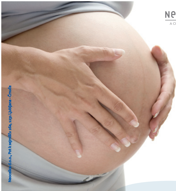
Neocelica d.o.o., Pot k sejmišču 26a, 1231 Ljubljana - Črnuče