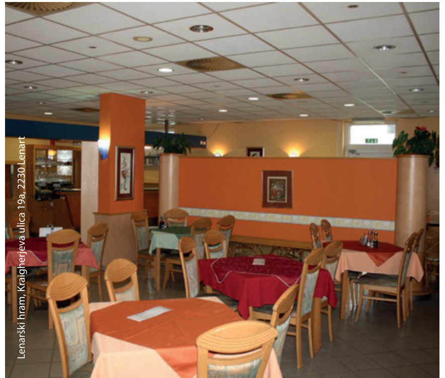
Lenarški hram, Kraigherjeva ulica 19a, 2230 Lenart