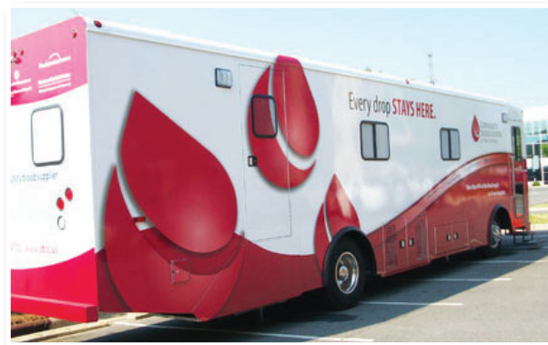
Podoben avtobus v tujini

Center za transfuzijsko medicino po navdah strokovnjakov oskrbuje s krvjo bolnike v UKC Maribor, v Splošni bolnišnici Murska Sobota in v Splošni bolnišnici Ptuj. Tedensko bolniki v teh bolnišnicah potrebujejo od 450 do 500 enot krvi. Za operativni poseg na srcu potrebuje bolnik kri od treh do petih krvodajalcev, za operacijo jeter pa kar osmih do desetih. V primeru zelo hudih poškodb in zapletov pri operativnih posegih potrebuje bolnik tudi do 15 ali celo 20 litrov krvi. Samo za takega bolnika morajo odvzeti kri 30 do 40 krvodajalcem. Veliko krvi potrebujejo zlasti onkološki bolniki. Ker v okviru UKC Maribor ustanavljajo onkološki oddelek, bodo v bodoče potrebovali še več krvi kot doslej. Poleg tega pa se morajo zaloge krvi nenehno obnavljati, ker imajo krvni pripravki omejen rok uporabe. Za novorojenčke in nedonošenčke morajo zagotavljati vedno svežo kri, ki je stara največ deset dni.