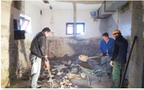
Od starega kulturnega doma bo ostala skorajda samo lupina.

Slavnostno položitev temeljnega kamna za obnovo Kulturnega doma Jurovski Dol se je uradno začela težko pričakovana rekonstrukcija in dozidava. Projekt v vrednosti dobrih 484.000 € bo izvajalo podjetje Knuplež, d. o. o., iz Zg. Velke. Dela bodo potekala v dveh etapah, v letu 2012 bo vrednost del znašala do cca. 135.000 €, preostala pa bodo izvedena do 1. oktobra 2013. Projekt je sofinanciran iz Evropskega kmetijskega sklada za razvoj podeželja (EKSRP),