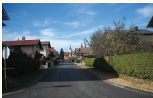
○ V občini Sv. Trojica so končali glavnino letošnjih del.