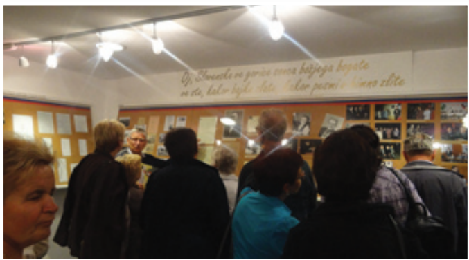
Številni so si v sklopu prireditev Trgatev ogledali tudi spominsko sobo generala Maistra.

Če na hitro potegnemo črto pod celotno prireditev, ki je zahtevala nemalo žrtvovanih in prostovoljnih ur članov društva vinogradnikov, ugotovimo, da se je na Zavrhu zvrstilo krepko čez 1000 obiskovalcev. Ta številka je sicer manjša od preteklega leta. Slednje gre pripisati predvsem dejstvu, da je bila sobota, 29. septembra, šoloobvezna. A kljub vsemu ocenjujemo, da je bila tudi letošnja »Trgatev na Zavrhu« uspešno izvedena. Ob kopicu dejavnosti se je na več kot 20 stojnicah predstavila ponudba Slovenskih goric. Za posameznike je bila dobra promocija, ki je v sedanjem času sila pomembna za uspešno trženje. Kot primer dobre prakse in razmišljanje za prihodnja leta navajamo tudi