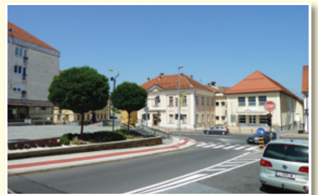
○ Od 20. 10.-10. 11. prireditve ob prazniku občine Lenart