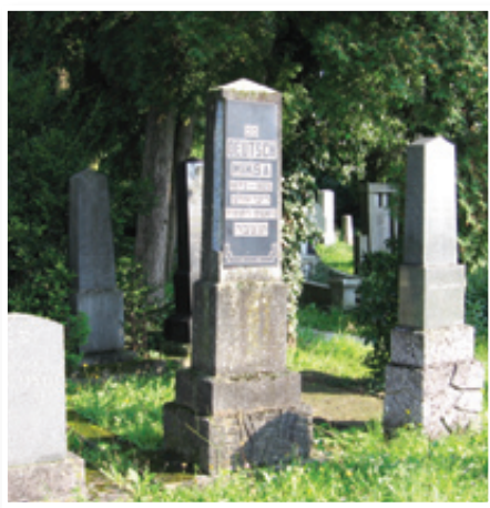
Pokopališče Dolga vas

Judje po vsem svetu so slovesno vstopili v novo leto 5773. Judovsko leto se začne s prvim Tišrijem (september – oktober) in se praznuje prvi in drugi dan tega meseca. To je datum, ko je Bog ustvaril Adama, prvega človeka. Zato nekateri poudarjajo, da je to tudi rojstvo človeka. Po tradicionalnem izročilu je namreč do stvarjenja prišlo prvega dne judovskega meseca Tišrija, ki ga danes poznamo kot novo leto ali Roš Hašana (kar v hebrejščini pomeni glava leta). Tega dne se odprejo tri knjige: prva je za krivične, druga je za resnično pravične, tretja pa je za tiste nekje vmes. Judje si po stari šegi voščijo novo leto: »Bodi zapisan za ugodno leto!«, ali tudi »Naj ti bo vpisano dobro leto!«. Veselo praznujejo v najboljših oblekah, da bi pokazali zaupanje v Gospodovo usmiljenje. V sinagogah prevladuje bela barva, simbol čistosti; hazan (sinagoški uradnik, vodja molitev, zlasti ob šabatu in praznikih, ki lahko tudi bere sefer toro in poučuje otroke iz skupnosti) in rabin (posvečen učenjak, izročilno poklican, da odloča o vprašanih judovskega obredja; danes pa so to v glavnem sinagoški nameščenci z obsežnimi pridigarskimi in pastoralnimi dolžnostmi) sta odeta v kitel (jud. belo oblačilo; ima precej simbolnih pomenov, ki nam pomagajo razumeti njegovo rabo. Bela barva je simbol či-