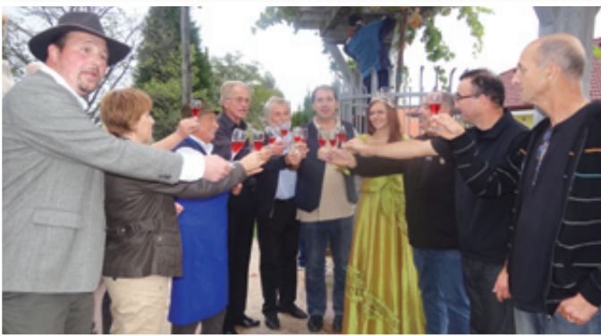
Člani TD Rudolf Maister Vojanov so v družbi župana in podžupana občine Lenart, Ovtarja in ptujške kraljice opravili 3. trgatev.

poskrbeli za bogat program in zanimivo dogajanje na Zavrhu, ki je potekalo od 9. ure zjutraj vse do zgodnjih jutranjih ur naslednjega dne. Otvoritveno vožnjo turističnega vlakca, ki je sicer ves dan krožil med Zavrhom in Selcami, so popestrili člani Moto društva Ruperški voli, ki so turistični vlakce popremili v vinograd, nato pa opravili krožno vožnjo po Slovenskih goricah. Poleg trgatev, ki so se ta dan zvrstile po Zavrhu, Selcah in okolici, so se gostje zabavali tudi ob vožnji z vlakcem, ob ogledih likovnih razstav, muzejev, kleti, otroških delavnic, jahanju konj in seveda ob okušanju bogatih sadov narave Slovenskih goric. Člani lovske družine Voličina se ob že tradicionalni lovske razstavi tokrat pripravili še nagradno streljanje z zračno puško na slepo tarčo.