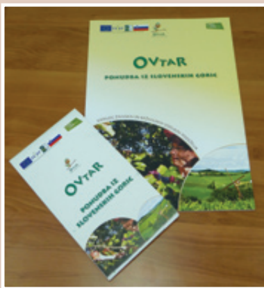
Katalog in zloženka

V petek, 28. septembra 2012, je na Glavnem trgu v Mariboru potekala tradicionalna prireditev Festival Stare trte. OVTAR ponudbo iz Slovenskih goric so predstavili: EKO