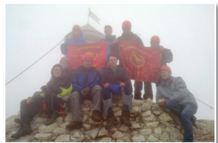
Gasilci PG Osek ob Aljaževem stolpu na Triglavu

kondicije. Kot kaže slika, je bil vrh Triglava v megli, tako da je bil pogled na okolico zakrit. Zanimivo je, da so ob vračanju na Kredarico doživeli neurje s točo. Ena izmed udeleženk nam je povedala, da jo je toča oklestila po