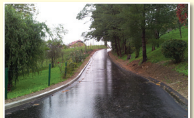
○ V občini Sv. Jurij zaokrožajo obnove in začenjajo nove.