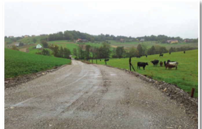
Zemeljska dela na makadamskem odseku v Gasteraju so se že začela.

»Ob modernizaciji nekaterih cest, predvsem v centru občine, smo izgradili oz. ponekod obnovili javno razsvetljavo. Do konca tega leta bomo tako dogradili še 20 javnih