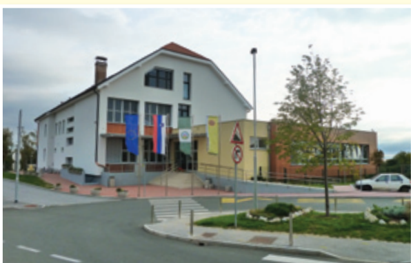
○ Sv. Ana: s sanacijo do energetsko varčnih objektov