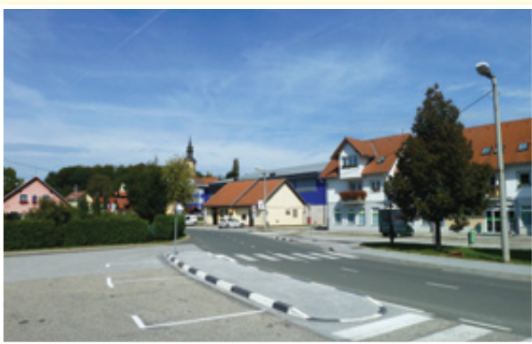
○ V občini Benedikt skrbijo za ohranjanje doseženega.