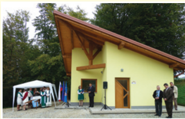
○ V Cerkevjaku so izboljšali pogoje za šport in turizem.