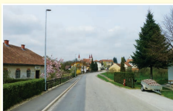
○ Občina Sveta Trojica stopa v pomlad z uspešno zaključenimi in novimi načrti.