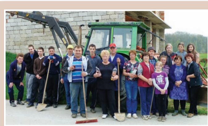
V soboto, 20. aprila, je v občini Sveta Trojica potekala pomladanska akcija vzdrževanja občinskih cest ter čiščenja in urejanja okolja. Na posnetku so sodelujoči iz Spodnje Senarske ob koncu akcije. E. P.