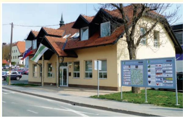
○ V benediški občini bodo med čakanjem na denar iz države za silo zakrpali plazove.

Občina Sveti Jurij v Slovenskih goricah je v prebujeno pomlad stopila z bogatim praznovanjem svojega 7. praznika. Prireditve se vrstijo od 12. aprila do 11. maja.