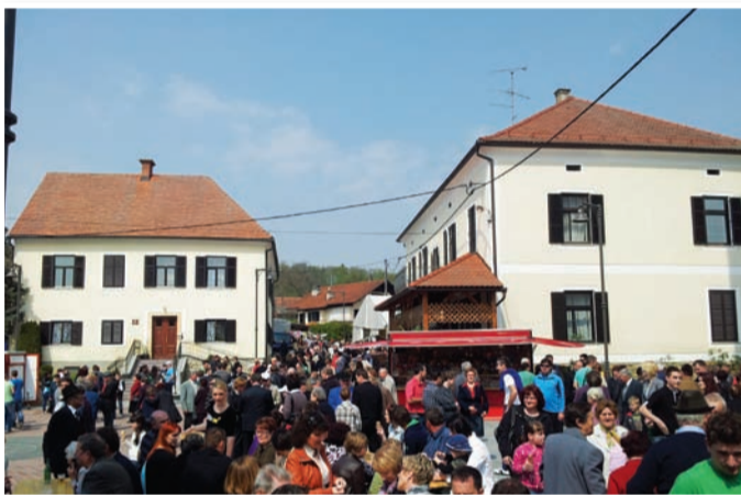
Tradicionalno Jurjevanje je ponovno pritegnilo veliko število obiskovalcev.