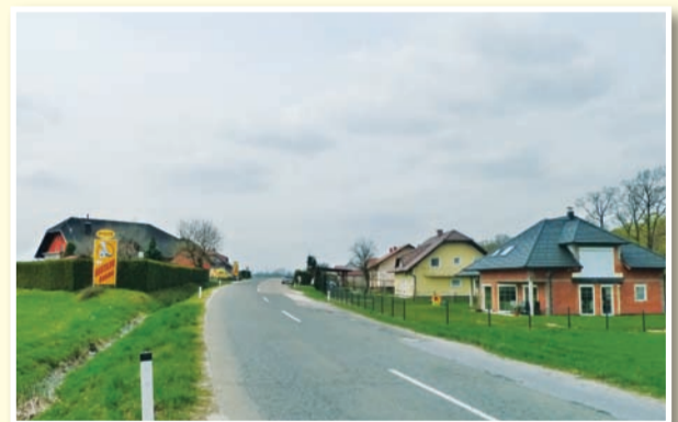
○ Obmestno lenarško naselje Radehova čaka na izpolnitev državnih obljub.