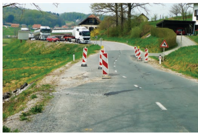
Plazovi ogrožajo ceste v občini Sv. Jurij v Slov. goricah.

Dolgotrajna zima s prekomerno količino padavin je pustila posledice na domala vsa-