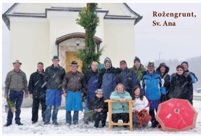
Rožengrunt, Sv. Ana