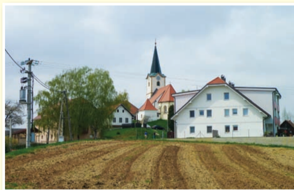
○ V Cerkevniku ob pripravah nove investicije s pridom izkoriščajo dosedanje.