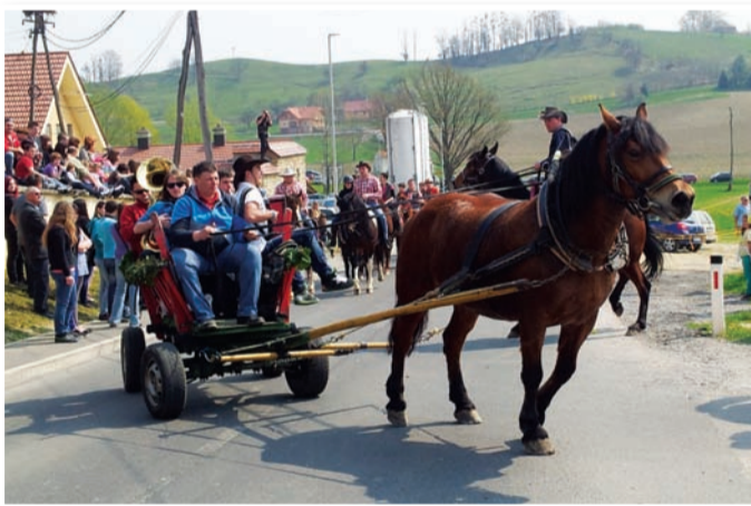
Tudi letos se je blagoslova konj udeležilo veliko domačih in okoliških konjenikov (več v prihodnji številki Ovtarjevih novic).