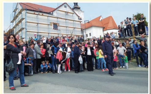
○ Jurovski Dol je do praznika občine vidno spremenil svojo podobo, a bo ta še lepša.