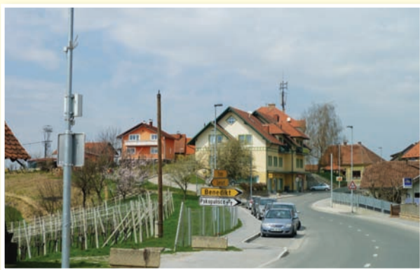
○ Sveta Ana se pripravlja na začetek del na pomembnih občinskih projektih.