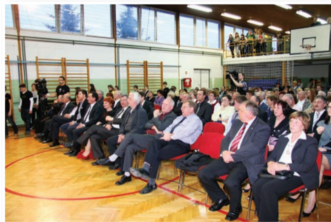
Številni gostje na osrednji proslavi