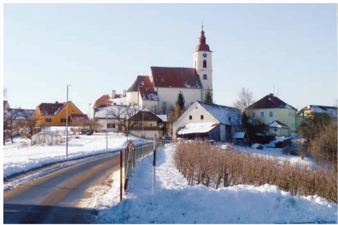
Sneg je povzročil veliko škode