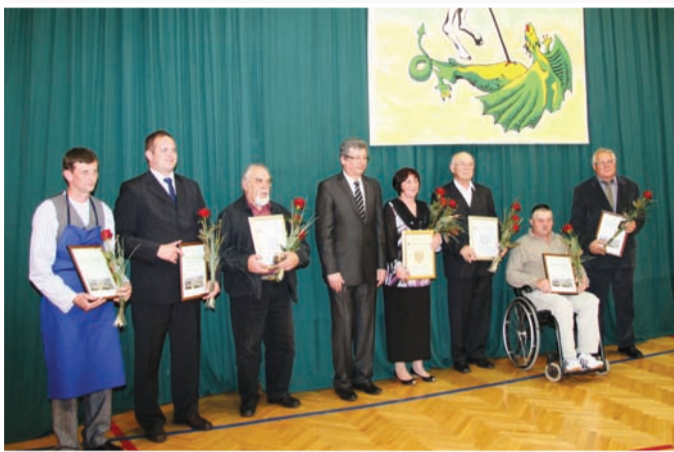
Nagrajenci Občine Sv. Jurij v Slov. goricah

kem koraku. Največ nevarnosti tako podobno kot po Slovenskih goricah in širom Slovenije povzročajo zemeljski plazovi. Trenutno najbolj kritičen je plaz na državni cesti med Jurovskim Dolom in Lenartom. Po besedah župana so si plaz že ogledali pristojni iz Direkcije za ceste RS, ki bodo najprej izdelali projekt sanacije, ki naj bi zajemal še tri druge plazove na državni cesti v občini. Po neuradnih podatkih naj bi se izvedba trajne sanacije omenjenega plazu pričela čez eno leto. Do takrat pa naj bi plaz začasno sanirali, tako da