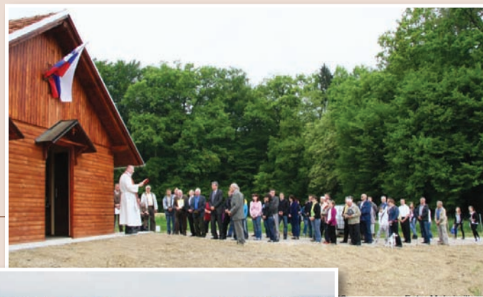
Otvoritev čebelnjaka pri OŠ Jožeta Hudalesa v Jurovskem Dolu