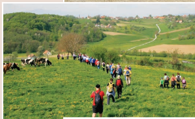
TD Dediščina je tudi letos pripravilo tradicionalni pohod po poteh občine Sv. Jurij v Slovenskih goricah.