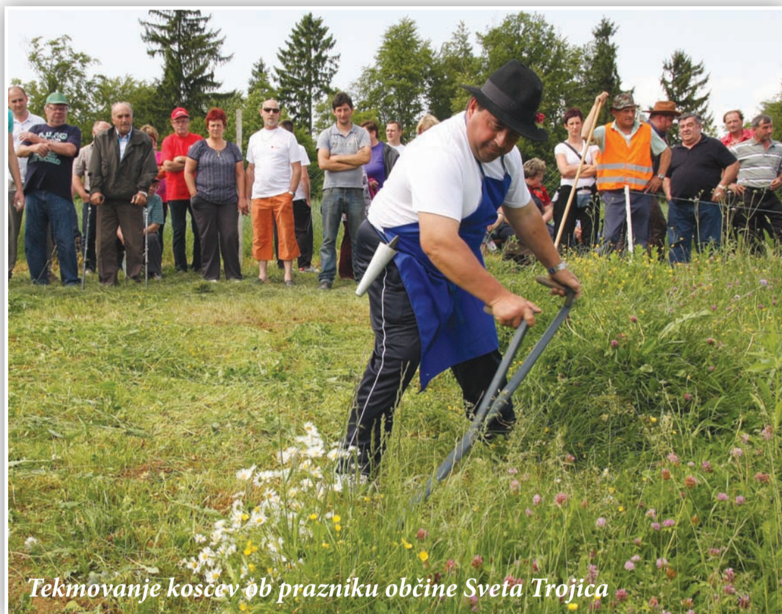
Tekmovanje koscev ob prazniku občine Sveta Trojica