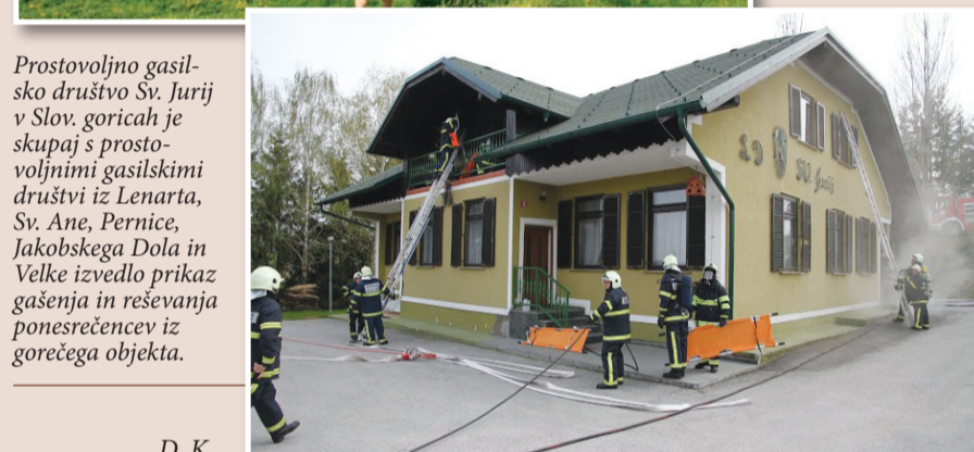
Prostovoljno gasilsko društvo Sv. Jurij v Slov. goricah je skupaj s prostovoljnimi gasilskimi društvi iz Lenarta, Sv. Ane, Pernice, Jakobskega Dola in Velke izvedlo prikaz gašenja in reševanja ponesrečencev iz gorečega objekta.