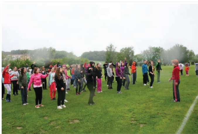
Pred odhodom na pohod se je bilo potrebno dobro ogreti.