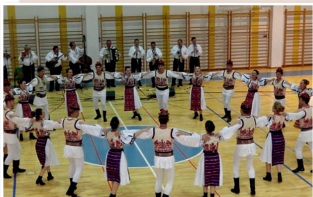
Folklorna skupina Ardealul iz Romunije