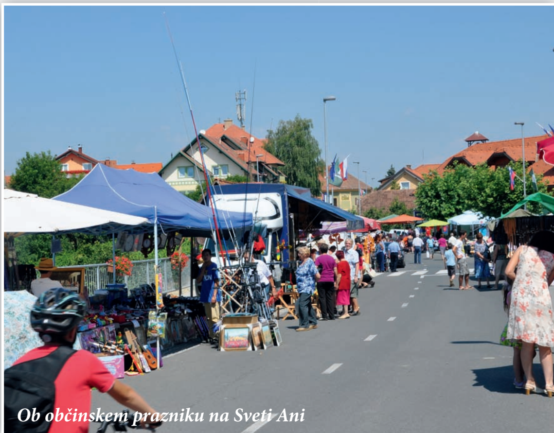
Ob občinskem prazniku na Sveti Ani