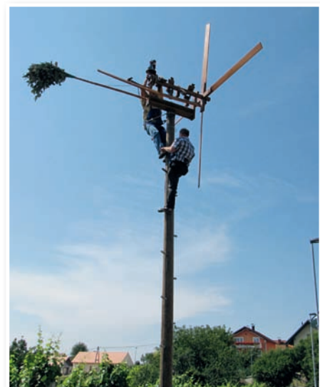
Postavitev klopotca v središču Sv. Ane