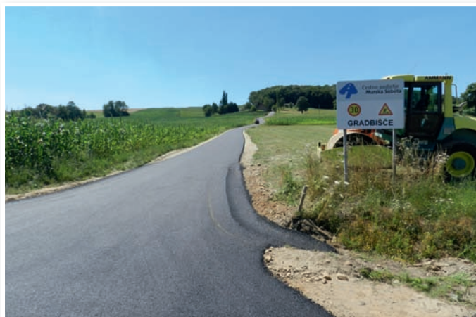
Nov asfalt v Malni

Cesta v Malni, odsek Zelenko (JP 705 340 in JP 705 342) v dolžini 1332 m je dobila novo asfaltno prevleko, kot smo napovedali že v prejšnji številki časopisa.