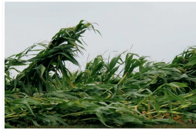
Koruzo, ki jo je močno prizadela že suša, je hudo poškodovala še ujma.