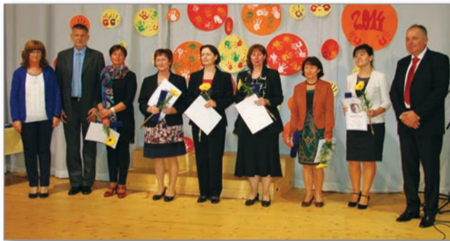
Priznanja II. stopnje