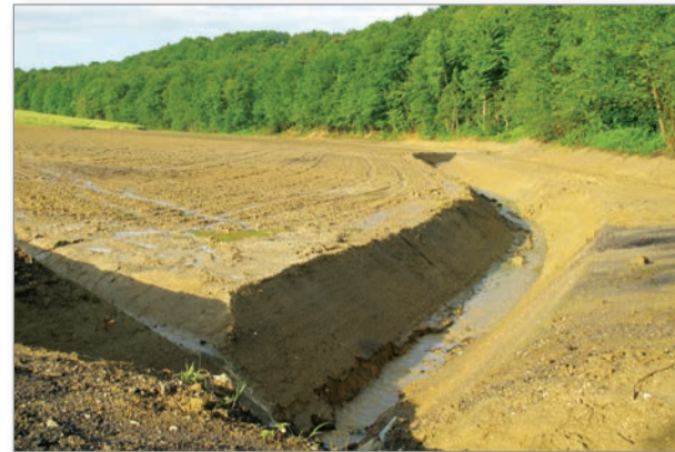
Projekt agromelioracije in komasacije v dolini Andrenškega potoka v občini Cerkvjenjak se uspešno končuje.

zemljišča ostala nad vodo. Samo ob največjih nalivih in ob najvišjem vodostaju je potok tu in tam prestopil bregove.