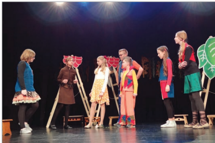
Nenavadna poroka, predstava OŠ Voličina