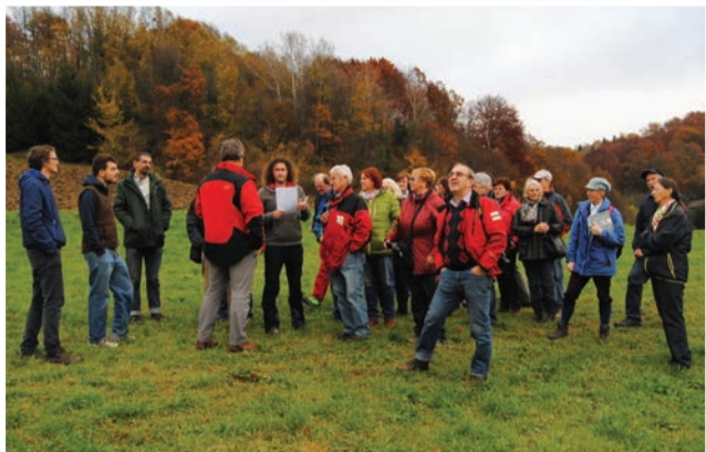
Z udeleženci izleta v dolini Velke

nike. Na njih lovi večje žuželke, kot so brumorji, kobilice in različne hrošče ter manjše sesalce, npr. miši. Iz Slovenskih goric, kjer je nazadnje gnezdila v Sloveniji, je izginila zaradi pretirane uporabe fitofarmaceutskih sredstev, melioracij in komasacij kmetijskih zemljišč. Ljudje so travnike po dolinah poveli preorali v njive ali jih z drenažo osušili