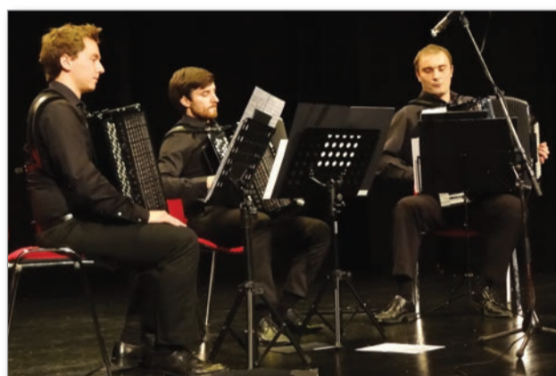
Koncert SLOA3 trio harmonik

Smejali in zabavali smo se ob pripetljajih in komičnih zapletih v veseloigri Trikrat hura za ženske, s katero so nas navdušili domači