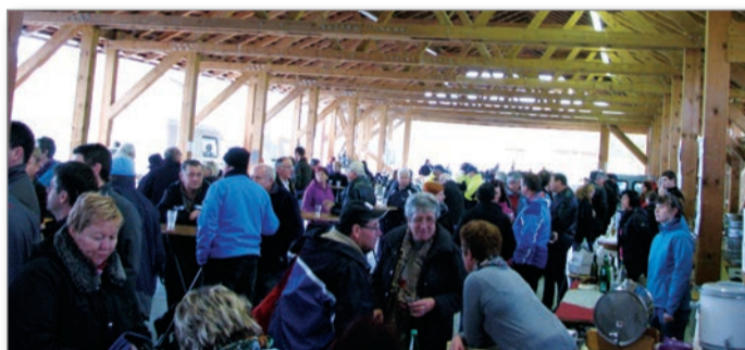
Martinovanje na Poleni