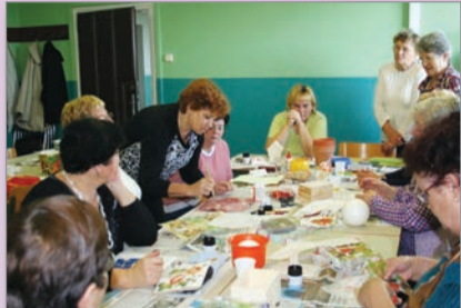
Utrinek z delavnice Servietna tehnika

Tudi letos je Univerza za tretje življenjsko obdobje Lenart zelo dobro obiskana. Udeleženci so vključeni v štiri skupine tujih jezikov, oblikovali sta se dve skupini Ročnih spretnosti, učenje računalništva pa začinjamo v kratkem. Vključenost starejših odraslih izkazuje močan interes ter potrebo po vseživljenjskem učenju in medgeneracijskem sodelovanju.