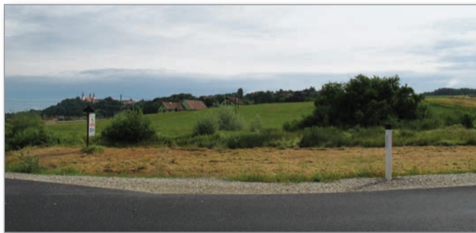
Nova soseska Trojica jug se bo raztezala po južnem pobočju griča pri Sveti Trojici.