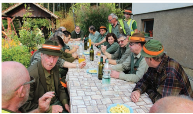
Sproščeni klepet ob malici pri Vajngerlovih v Stanetincih

V prazničnem letu je LD Dobrava poleg razvija prapora in svečane akademije ob 60-letnici ustanovitve pripravila še nekaj manjših dogodkov. Mednje sodi tudi tradicionalno jesensko srečanje lovcev iz Slovenskih goric in iz Kobanskega v okviru dobrega sodelovanja pobratenih LD Dobrava in Vurmat s Sv. Duha na Ostrem Vrhu. Letošnje srečanje je bilo v Andrenjih pri Cerkvjenjaku, kje so pripravili krajši skupni lov na fazane in zajce. V prekrasnem sončnem vremenu so lovci uživali v jesenskih barvah slikovite Andrenške doline, ki je na žalost doživela grob poseg v obliki agro in hidromelioracije na obeh straneh Andrenškega potoka. Ta poseg je močno poslab-