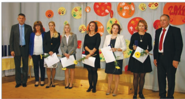
Priznanja I. stopnje