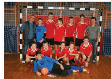
KMN Slovenske gorice U-15 v letošnji sezoni še brez izgubljene točke

3. NK Imeno (9), 4. FC Litija (6), 5. NK Laško (0), 6. KMN Sevnica (0). V zahodni skupini na vrhu kraljuje ŠD Extrem iz Sodražice pred KMN Bronx Škofije.