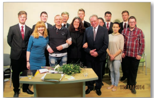
Udeleženci literarnega večera

Organizatorji dogodka: OI JSKD Lenart, Knjižnica Lenart in ZKD Slovenskih goric v sodelovanju z občino Lenart.