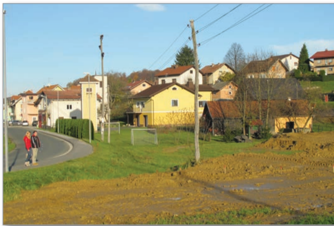
Nova soseska bo zrasla na ravnici pod Tremi Kralji v bližini središča Benedikta.

Vse kaže, da bo podjetje Juven komunalno opremljene parcele v novi soseski prodajalo po ceni 35 evrov za kvadratni meter, kar je za te kraje trenutno zelo ugodno. Če bo kupec želel, mu bodo kasneje na parceli zgradili še hišo. Za manjšo hišo s parcelo bo treba odšteti verjetno okoli 140.000 evrov ali več. Interes za nepremičnine v Benediktu je dokajšen,