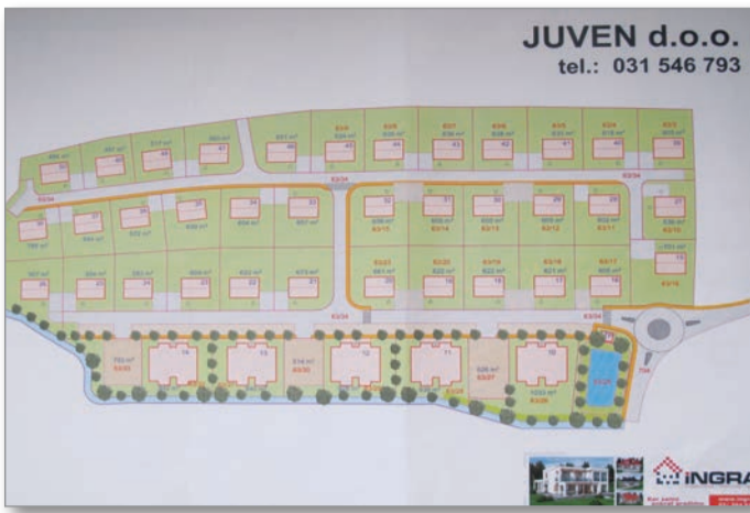
V novi soseski bo 40 individualnih hiš in 5 manjših stanovanjskih objektov s po 12 stanovanji.

saj je kraj tudi zaradi velikega števila mladih prijeten za bivanje, poleg tega pa bodo v njem prej kot slej zrasle Terme Benedikt. Gradbeno dovoljenje zanje je že izdano. Do gradnje ni prišlo, ker je šel investitor (gradbeno podjetje CMC) v stečaj. Ko bo stečajna upraviteljica našla novega kupca za zemljišče in vrecle termalne vode, pa se bo investicija verjetno kmalu nadaljevala. Verjetno bo Benedikt že v bližnji prihodnosti turistično-zdraviliški kraj, kjer bo bivanje prijetno, nepremičnine pa bodo imele svojo ceno.