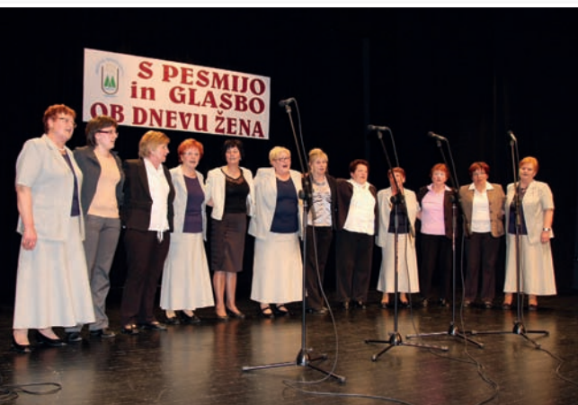
Pevke ljudskih pesmi DU Lenart in pevke Društva gosposinj Vitomarci