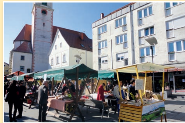
Tako je bilo lani ...

Prosimo, da stojnico rezervirate na telefonski številki 059 128 773, 051 660 865 ali na elektronski naslov info@lasovtar.si do točka, 8. aprila 2014. Število stojnic je omejeno!