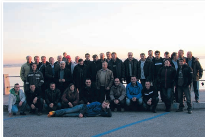
December 2013 – kmetje iz Slovenskih goric v Tržaškem zalivu

Člani Govedorejskega društva Slovenske gorice in Strojnega krožka Klas iz Lenarta so v sodelovanju s Kmetijsko svetovalno službo Lenart v minuli zimski sezoni, ko je na kmetijah nekaj več časa za strokovno izobraževanje in ogled, organizirali kar dve strokovni ekskurziji. V decembru so se odpravili na obisk in ogled tovarne kmetijskih strojev Maternac v severnoitalijanskem mestecu San Vito al Tagliamento, ki je približno 80 km oddaljeno od Trsta. Voden ogled tovarne, v kateri izdelujejo predvsem različne sejalnice, pa tudi druge traktorske priključke, je bil nadvse zanimiv. V popoldanskih urah