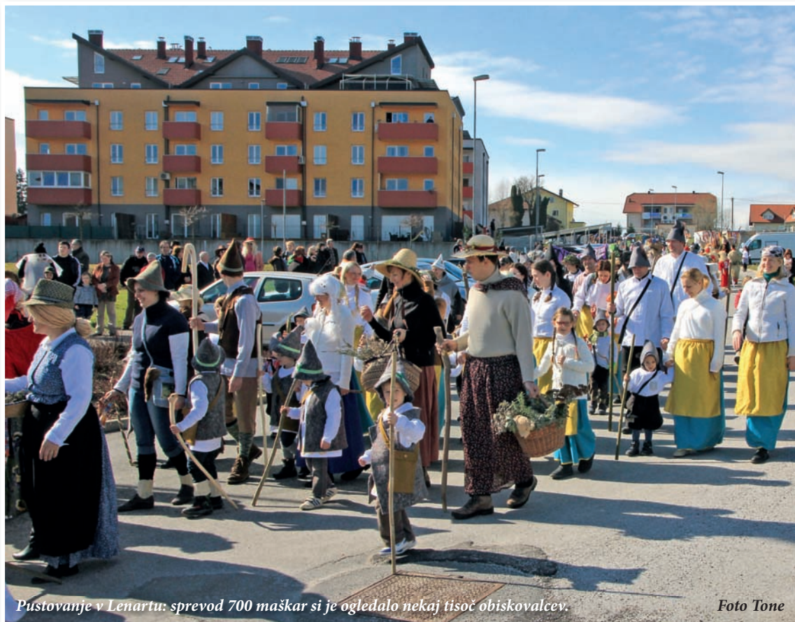
Pustovanje v Lenartu: sprevod 700 maškar si je ogledalo nekaj tisoč obiskovalcev.