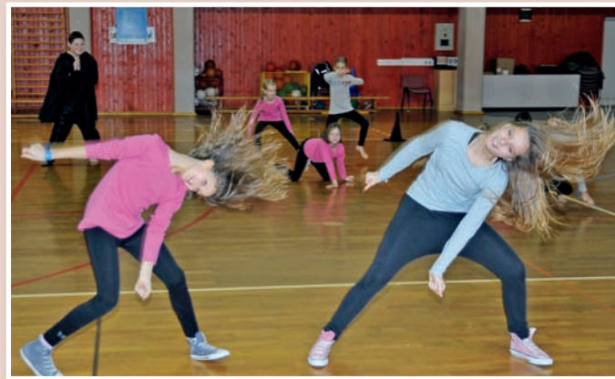
Foto utrinek iz letošnjih Plesnih meglic, revije plesnih skupin iz občin Lenart, Sveta Ana, Sveta Trojica in Svetega Jurija v Slovenskih goricah.