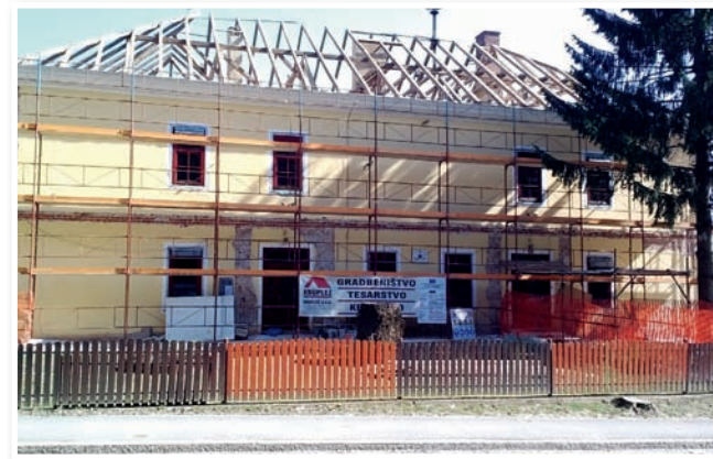
Obnova strehe OŠ Lokavec

Občina pa s sprejetimi sklepi delno spreminja tudi način sofinanciranja društev, tako so svetniki potrdili spremembo pravilnika javnih kulturnih programov v občini in še koreniteje sofinanciranje programov in projektov drugih društev v občini. Sprejet je bil tudi odlok o opravljanju obvezne gospodarske javne službe oskrbe s pitno vodo, ki ga potrjujejo občine na področju mariborskega vodovoda v enakem besedilu. Svetniki so se seznanili