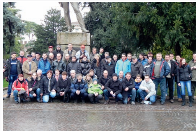
Februar 2014 – po kmetijskem sejmu še ogled znamenitosti Verone