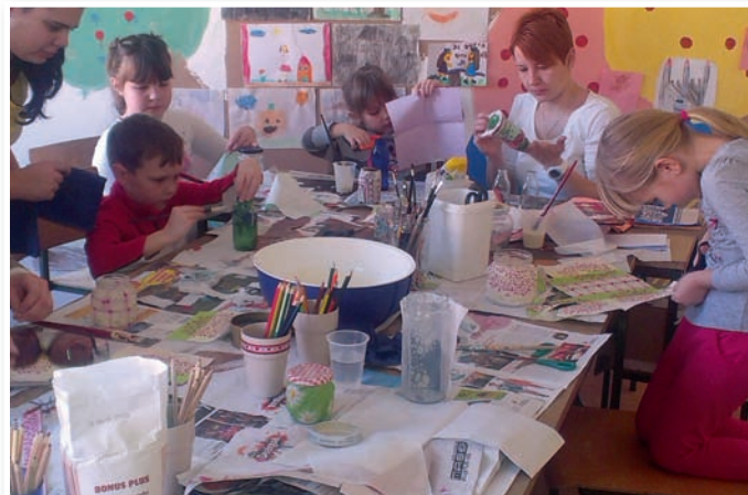
Med počitnicami je v Društvu prijateljev mladine Slovenske gorice vedno pestro.