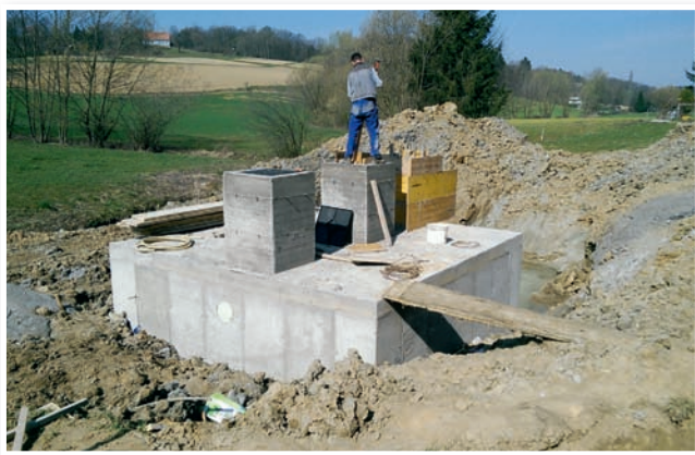
Izgradnja čistilne naprave v Dražen Vrh

tudi s področjem varnosti v občini, tako so poslušali poročila Medobčinskega inšpektorata in redarstva kot tudi poročila pomočnika komandirja PP Lenart. Prav slednji je izrazil največ zaskrbljenosti na področju prometne varnosti, saj je bilo ugotovljeno, da sta bili kar dve nesreči od treh s smrtnim izidom prav na Sveti Ani. Ob drugih sklepih pa velja omeniti