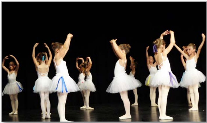
Z enega od nastopov lenarške glasbene šole

letu. Prvi nastop v novem letu 2015 smo izvedli 28. januarja v Domu kulture Lenart. Posvečen je bil slovenski skladateljski ustvarjalnosti, saj so se učenci vseh oddelkov šole predstavili z deli iz bogate zakladnice slovenske ljudske, umetne in zabavne glasbe. Nastop je odlično uspel, o čemer so pričali dolgi aplavzi in polna dvorana navduše-