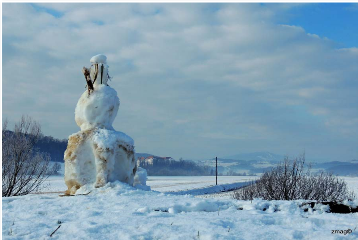
Odhod sneženega moža ...