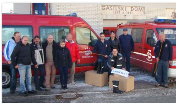
Škornje so prepeljali s cerkvenjaškim gasilskim kombijem.