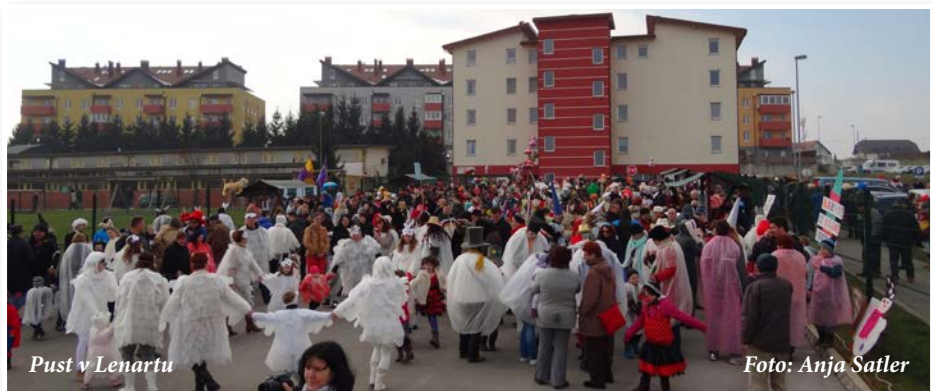
Pust v Lenartu