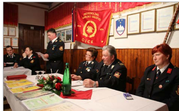
Predsedstvo občnega zbora PGD Osek