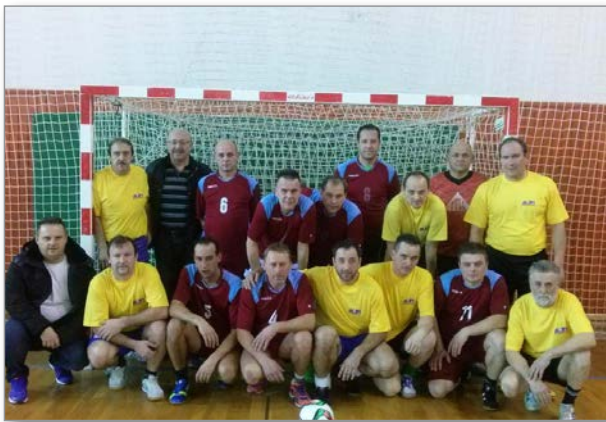
Družina Maurič iz Benedikta

Vsem skupaj, od nogometnih ekip pa do organizatorjev turnirja in gledalcev, izrekamo globoko hvaležnost.