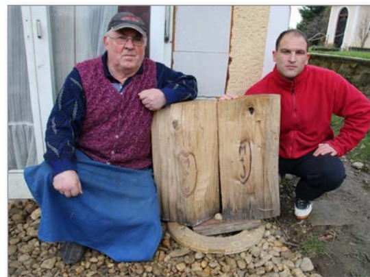
Pogled na podobo sredi bukovega debla