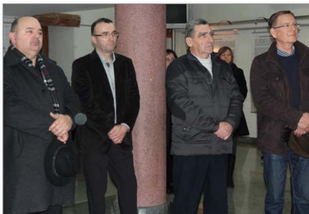
Med številnimi udeleženci odprta razstava je bil s sodelavci tudi župan občine Lenart, ki je tudi spregovoril o pomenu Ilaunigove osebnosti in odprl razstavo.

ploščo na pročelju omenjene hiše, letos pa je s slovesnostjo obeležila na ta dan 70-letnico smrti pomembnega meščana Lenarta. Na ta