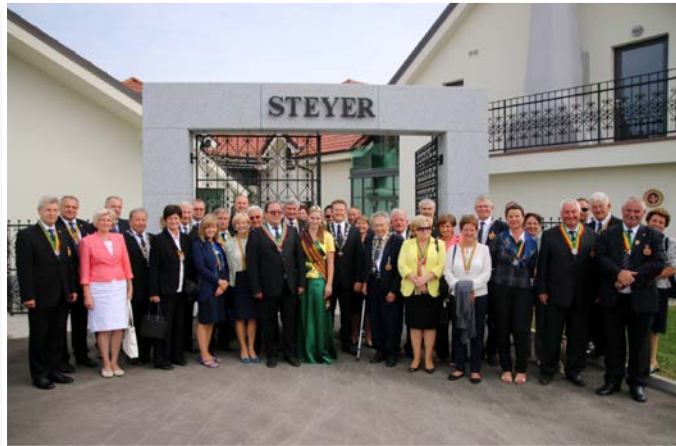
Udeleženci viteške svečanosti Evropskega reda vitezov v Apačah pri Vinogradništvu Steyer