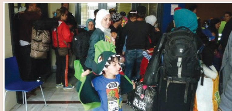
V recepciji nekdanjega hotela so jim najprej postregli z najnujnejšimi živili in napitki. V sobah jim je na voljo okrog 250 ležišč.