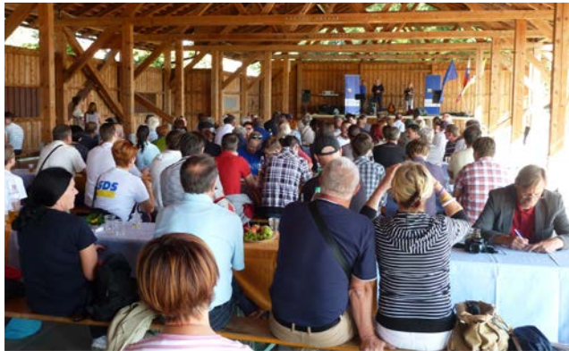
Ob govoru predsednika SDS Janeza Janše ...

ohromila lokalno samoupravo. Predsednik SDS Janez Janša je v nagovoru izpostavil nekatera najaktualnejša dogajanja. Za gospodarsko rast je dejal, da sicer je, a komaj za dočeka za obresti dolgov, ki so se nakopičili po letu 2008. Centralizacija države je izničila reformna prizadevanja iz obdobja 2004–2008. Ob tem je poudaril pomen občinskih investicij,