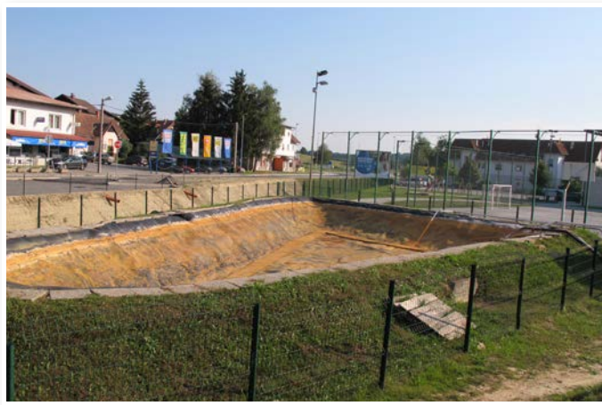
Zajetje ob vrtini v Benediktu

Okrožnega sodišča v Celju je stečajna upraviteljica Milena Sisinger poskušala kompleks nepremičnin v katastrski občini Benedikt, na katerih naj bi zrasle terme, prodati na treh dražbah, vendar na nobeno ni prišel noben kupec. Na prvi dražbi je stečajna upraviteljica kompleks zemljišč v katastrski občini Benedikt (gre za 14 stavbnih zemljišč v skupni izmeri 60.577 kvadratnih metrov, dve delno stavbni in delno kmetijski zemljišči v skupni izmeri 20.223 kvadratnih metrov in za eno kmetijsko zemljišče v izmeri 610 kvadratnih metrov) ponudila kupcem za 1,8 milijona evrov (kupec bi moral plačati poleg tega še davke na dodano vrednost). Pri tem je sodišče upoštevalo cenitve sodno zaprišenih cenilcev, ki so glede na namensko rabo kompleksa pri cenitvah vsa zemljišča upoštevali kot stavbna zemljišča. Na drugi draž-