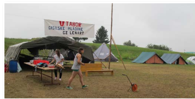
... je njihov tabor v Cerkevniku sameval, samo nekaj mladih deklet je pospravljalo in pripravljalo hrano za lačna usta.

pokazali, da so iz ta pravega 'testa' za gasilce.« Mladi so se na petem taboru gasilske mladine Gasilske zveze Lenart, ki je trajal od 21. do 23. avgusta v Cerkevniku, usposabljali za gasilce, poleg tega pa jim je ostalo še nekaj časa za igre, orientacijske pohode in prijetno