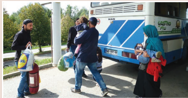
Begunci so tako v nedeljo, 20. 9., z avtobusom pripeljali iz Gruškovja v Črni les. Pričakali so jih prostovoljci humanitarnih organizacij, pripadniki CZ, Slovenske vojske, policisti ter drugi, ki so poskrbeli zanje.

Po uskladitvi aktivnosti vseh pristojnih dejavnikov na ravni države in občine Lenart je od zadnjih dni prejšnjega tedna ob radgonskem sejmišču v osrednjih Slovenskih goricah tudi nekdanji Hotel Črni les pri Lenartu nastanil center za begunce, ki si prizadevajo priti v zahodnoevropske države. Že čez konec tedna se je v njem začelo namestiti okrog 250 beguncev, za katere je bilo ustrezno in pravočasno poskrbljeno tako s humanitarno kot zdravstveno pomočjo. Prebežniki so nato po skupinah nadaljevali pot v Avstrijo, predvsem preko Šentilja.