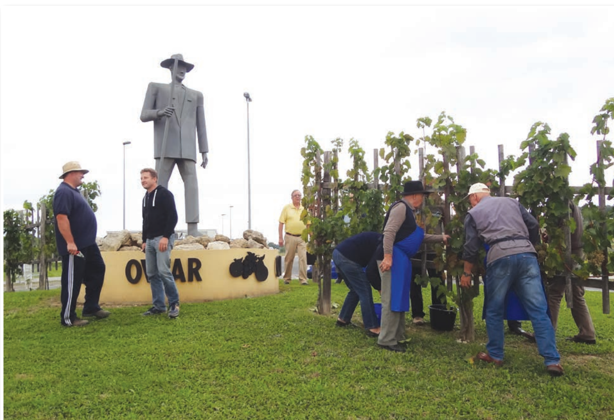
Trgatev v lenarškem krožišču pri Ovtarju