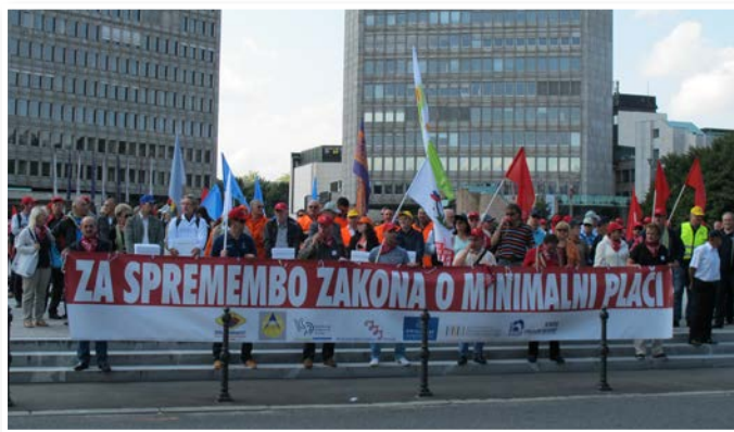
Voditelje sedmih sindikalnih central, ki so v državni zbor odnesli 11.000 podpisov v podporo svojemu predlogu za spremembo definicije minimalne plače, so na poti do državnega zbora spremljali številni člani vseh slovenskih sindikatov.