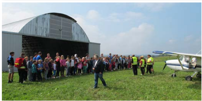
Medtem ko so mladi gasilci na obisku pri letalcih na vzletno pristajalni stezi v Brengovi ...