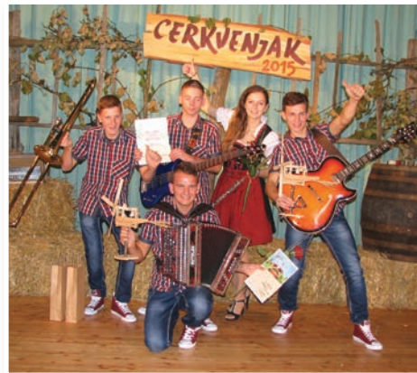
Klapovühi iz Benedikta, prejemniki dveh nagrad: nagrade občinstva in tretje nagrade strokovne komisije