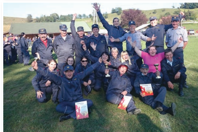
Člani, članice in starejši gasilci PGD Sv. Ana

Cerkvenjak, 3. PGD Osek, 4. PGD Gočova, 5. PGD Voličina, 6. PGD Sveta Trojica; Starejše gasilke: 1. PGD Cerkvenjak.