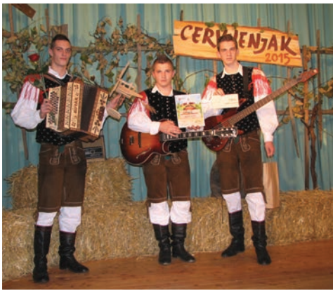
Ti trije fantje, ki slišijo na ime Upanje, so prepričali strokovno komisijo in prejeli zlati klopotec.

Torej tudi letos so prišli v Cerkevnik ansambli iz različnih koncev Slovenije. Prišlo