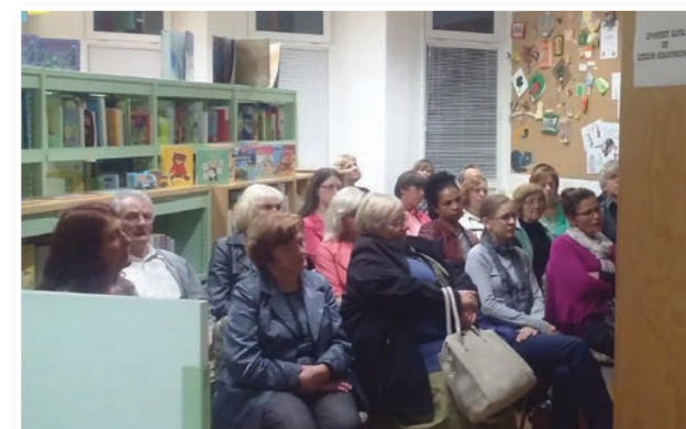
Predstavitve 8. oktobra v Knjižnici Lenart