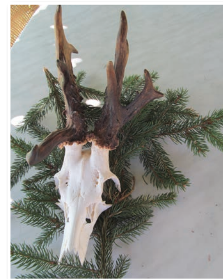
Brankov »posebnež« iz Sp. Ščavnice

še enega »posebneža«, saj je tudi njegov drugi letošnji srnjak nosil na glavi precej drugačno rogovje od običajnega. Brez sreče pač tudi pri