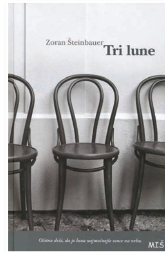
Roman je izšel v septembru pri založbi Miš.

V romanu se prepletajo tri zgodbe. Glavna oseba je