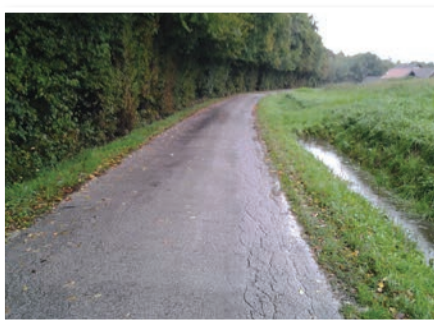
Poleg vzdrževanja bodo poskrbeli tudi za čiščenje zamašenih prepustov.

Izvajalec del za cestni odsek Repa (JP 703-315) v Sr. Gasteraju je bil izbran na podlagi povpraševanj pri različnih ponudnikih. Najugodnejšo ponudbo je ponovno podalo podjetje Pomgrad, ki bo dela opravilo za 39.299,65 €. V tem času je že bila podpisana tudi pogodba, tako da se bodo zemeljska dela na 480 m dolgem cestnem odseku pričela še to jesen, asfaltiranje pa spomladi prihodnje leto.