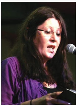
Breda Slavinec v Londonu

E. P.