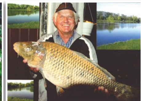
Ko je ulovil po dobrih treh tednih še rekordnega krapa, se mu je zares od srca zasmjalo.

devnega in uspešnega predsednika mladine na Zavrhu in nogometaša, ki je igral mali nogomet v moštvo Zavrha in Gradišča v Slovenskih goricah, veliki nogomet pa za Selce.