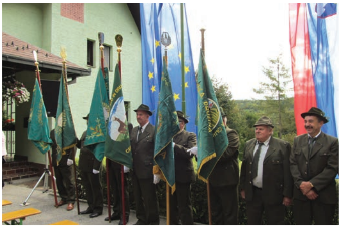
Slovesnosti ob 70-letnici LD Lenart so se udeležili praproščaki sosednjih LD iz lenarškega LGB.

Pri lovskem domu v Spodnjem Porčiču je bila osrednja svečanost ob 70-letnici LD Lenart. Na njej so zaslužnim lovcem in kinologom podelili odlikovanja Lovske zveze Slovenije, Kinološke zveze Slovenije in zahvale LD Lenart. Udeležence slovesnosti, ki so se je udeležili praproščaki in predstavniki sosednjih LD iz lenarškega LGB, pobratene LB Boč na Kozjaku, predsednik Lovske zveze Maribor Marjan Gselman in