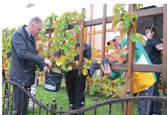
Kljub dežju so bili brači in drugi udeleženci na trgatvi Čolnikove trte dobro razpoloženi.

vane Čolnikova trta, potekala v dežju. Kljub temu pa se je na njej z dežniki v rokah zbralo veliko domačinov, pa tudi nekaj gostov iz bližnjih in daljnih krajev. Po bogatem kulturnem programu so