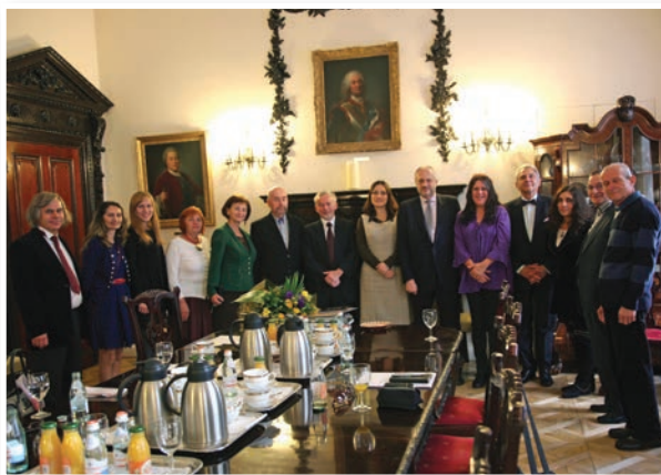
Sprejem pri ambasadorju Poljske v Londonu Witoldu Sobkówu