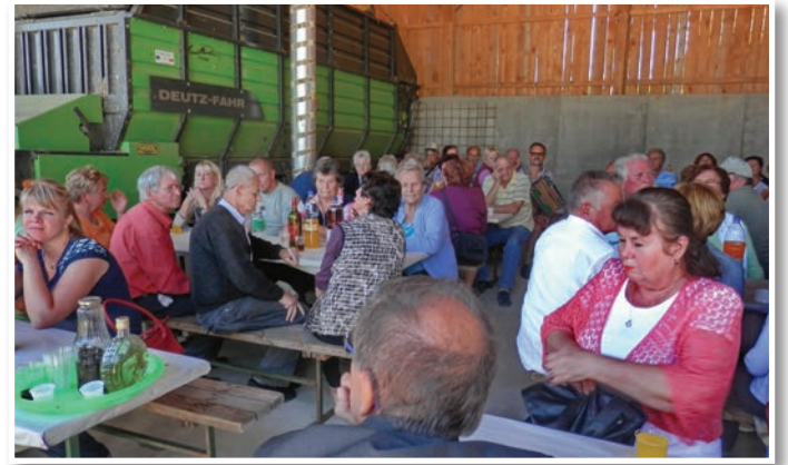
Udeleženci srečanja so se ob polni mizi sproščeno pogovarjali, zaigrala je harmonika in zaslislala se je pesem.

občin, ki so v letu 2015 finančno podprle delovanje organizacije.