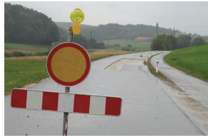
Na varnost v cestnem prometu vpliva tudi redno vzdrževanje cest.