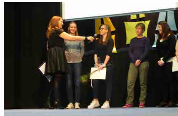
Najuspešnejša ženska ekipa KMN Slovenske gorice