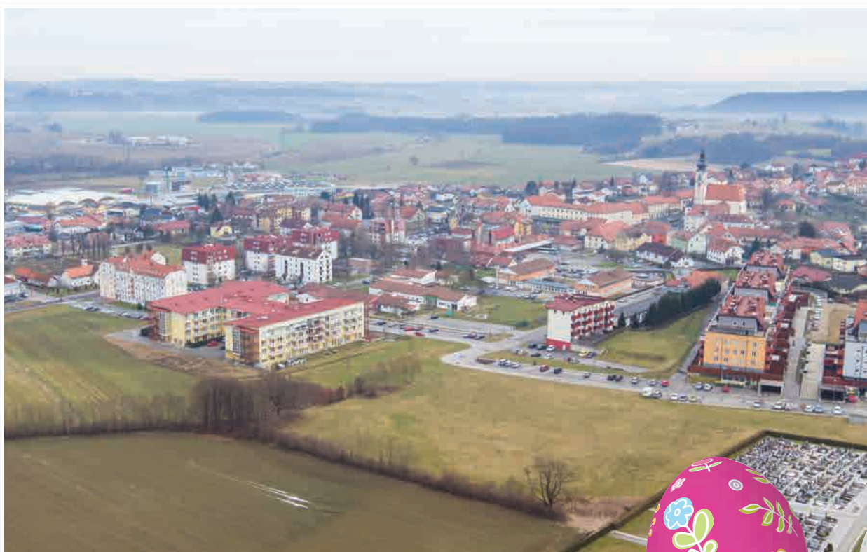
Mesto Lenart v pričakovanju pomladi