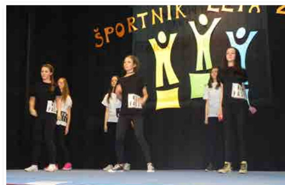
Starejša plesna skupina O.Š. J. Hudalesa