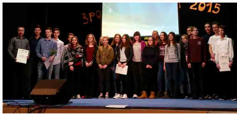
Najperspektivnejše ekipe, KMN Slovenske gorice U-15 na levi