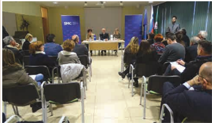
Dr. Brglez: Pri reševanju begunske krize moramo najti vzdržne in življenjske rešitve v soglasju z lokalno skupnostjo.