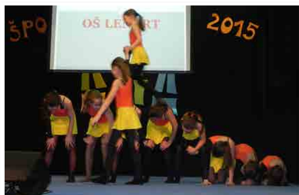
Mlajša plesna skupina O.Š. J. Hudalesa