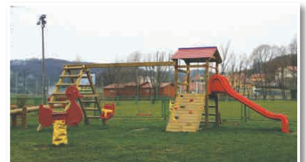
Nova otroška igrala

V sodelovanju s športnim društvom Sv. Jurij je občina že v preteklem letu uredila okoliščino športnega parka z namestitvijo novih otroških igral.