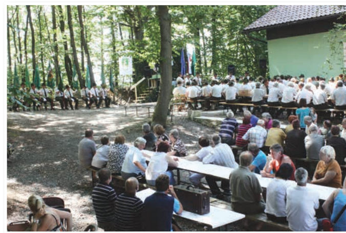
Proslava ob 70-letnici LD pri lovskem domu

pleka ter Fantje izpod Vurberka, ki so po uradnem delu poskrbeli tudi za glasbo. Slav-