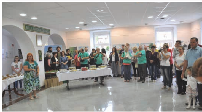
Otvoritev slikarske razstave