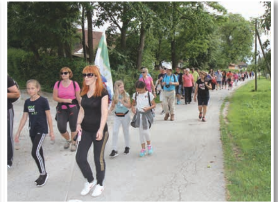
Benedičanov je nad 2500, zato je pohod Spoznavajmo svoj kraj vedno zanimiv za stare in nove prebivalce.