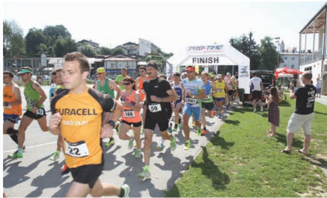
Na startu 4. benediškega teka se je zbralo veliko domačinov kakor tudi znanih slovenskih tekačev.