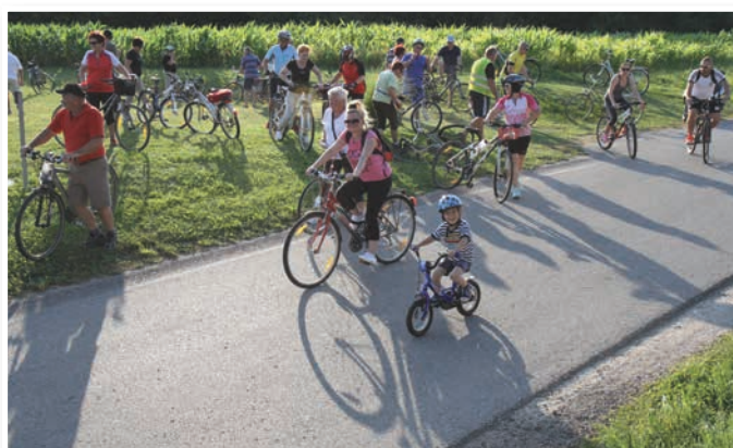
Kolesarjenje za vse generacije v organizaciji Društva upokojencev Benedikt