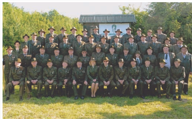
Lovci LD Voličina v letu 2016

LD danes šteje 54 članov, od tega 2 lovki, lovišče je veliko 3600 ha, nahaja se na območju treh občin: Lenart, Duplek in Sv. Trojica v Slov. goricah, na vzhodu sega od Gočove do Žikarc na zahodu, ter na severu od Hrastovca do Črmljenšaka na jugu. Letni odstrel srnjadi, ki je najštevilčnejša vrsta divjadi, je 140 živali.