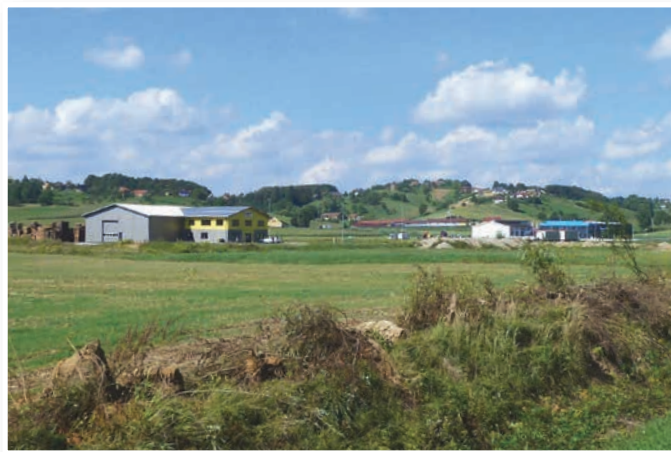
Nova poslovno industrijska cona Lenart v avgustu 2016

Če bo občina Lenart s prijavo na razpis uspela, načrtujejo sofinanciranje nadaljnje širitve infrastrukture v industrijski coni, kar bo omogočilo komunalno ureditev in prodajo parcel na območju, ki obsega okoli 2 ha. Širitev je osnova za nadaljnje investicije v Novi poslovno industrijski coni, kar pomeni večanje gospodarske konkurenčnosti in odpiranje novih delovnih mest v občini Lenart.