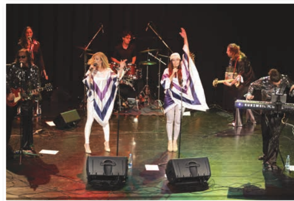
Abba Real Tribute Band