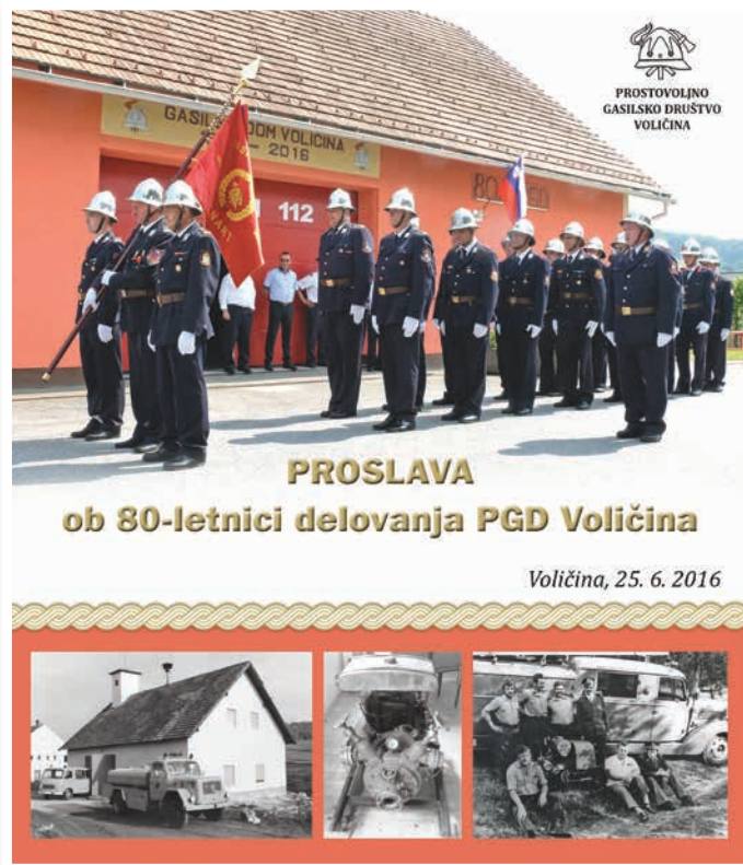
Voličina, 25. 6. 2016