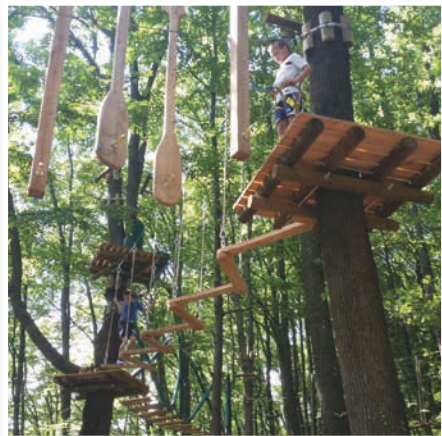
Vsaka od treh prog ima 10 spretnostnih ovir.

V času počitnic je park omogočal pustolovščine vsak dan, razen ob dnevih, ko je zabavo visoko nad tlemi pokvarilo deževno vreme. S pričetkom novega šolskega leta pa