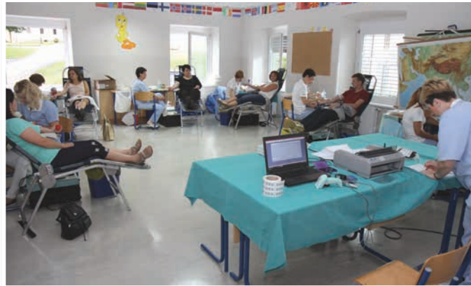
Tudi na poletni krvodajalski akciji v Benediktu ponovno preko 100 krvodajalcev