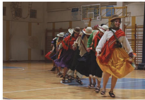
Folklorna skupina iz Argentine

Na programskih listih na prireditve vabijo z verzi znanih slovenskih popevk "Sredi zvezd noč in dan se vrtila svet" .... in mi z njim. "Kar je dobrega, maxi naj bo, naj bo mini vse, kar je slabo," kar je tudi bistvo in namen teh prireditev, ki pri- našajo dobro, pozitivno energijo, zabavo,