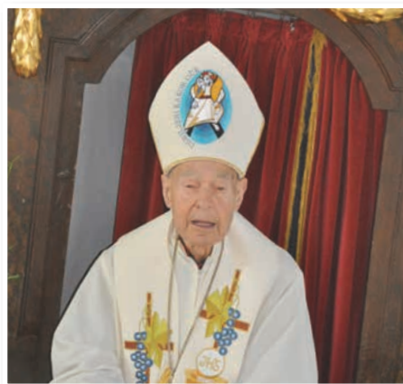
Pridiga škofa Smeja

Drugi dogodek je na Sveti Ani stalnica že deset let. Letos smo se v okviru potopisno-kulinaričnih večerov Drugi svet v ponedel-