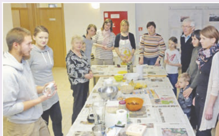
Z delavnice presne hrane v Knjižnici Lenart 4. februarja 2017.