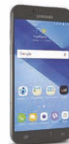
Samsung Galaxy A5 2017