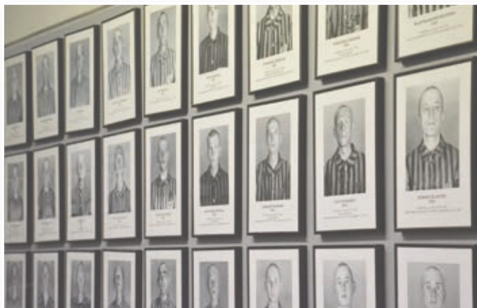
Mladi vse bolj spoznavajo strahote Auschwitza.

V okviru spominskih prireditvev ob mednarodnem dnevu spominjanja na žrtve holokavsta je bila učna ura na to temo tudi na OŠ Sveta Ana v Slovenskih goricah. Pripovedi o nacističnih grozodejstvih v nemških koncentracijskih in uničevalnih taboriščih je prisluhnilo 30 učencev devetih razredov, ki so s posebnim zanimanjem spremljali prikaz notranje organizacije in delovanja največjega uničevalnega taborišča Auschwitz-Birkenau v okupirani Poljski. Mladi so nemo poslušali pripovedi o grozodejstvih, ki so se dogajala Judom in drugim taboriščnikom in ki so bili največje žrtve rasnega pregnanja med drugo svetovno vojno. Seznanili so se tudi s slovenskimi žrtvami holokavsta 1933–1945, spoznali so romski genocid in razne metode razčlovečenja in ponižanja nekdanjih taboriščnikov