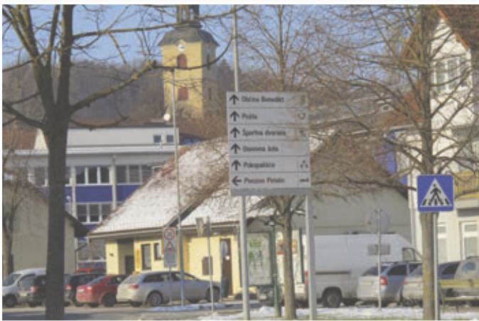
Občina Benedikt ima komunalno infrastrukturo na zavidljivi ravni.

Kako pa je s komunalno opremljenostjo občine? Po presoji TerraGIS-a sodi občina