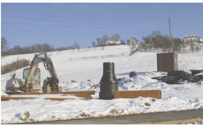
Tako so pozimi leta 2015 začeli komunalno opremljati novo naselje v Benediktu, ki ga gradi podjetje Juven.

Benedikt na področju vodooskrbe med bolj zglede slovenske občine, saj ima vodooskrbo urejeno za veliko večino prebivalstva. Dolžina celotnega javnega vodovodnega sistema v občini znaša okoli 47.500 metrov, od tega je polietilenskih cevi okoli 39.500 metrov, preostalo pa so litoželezne in pocinkane cevi. Glede na vrsto vodovodov je 2.800 metrov magistralnih, 17.000 primarnih, 22.300 sekundarnih in 5.300 terciarnih. Spodbuden je tudi podatek, da je velik del vodovodnega omrežja zgrajen v letu 1999 in kasneje.