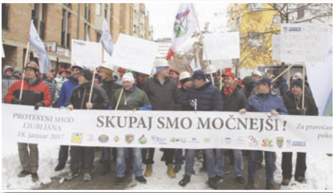
Na demonstracijah pred ministrstvom za delo v Ljubljani se je zbralo okoli dva tisoč delavcev iz vse Slovenije. Precej jih je bilo tudi iz osrednjih Slovenskih goric – zlasti policistov, vojakov, voznikov in še nekaterih.

Demonstranti, ki so bili opremljeni s številnimi transparenti, zastavami, ragljami in piščalkami, so opozarjali, da nižja prispevna stopnja v naslednjih letih ogroža poklicno zavarovanje delavcev, ki so do tega upravičeni in zavarovani. Pred leti je prispevna stopnja znašala 10,55 odstotka, potem so jo zmanjšali na 9,25 odstotka, sedaj pa so jo