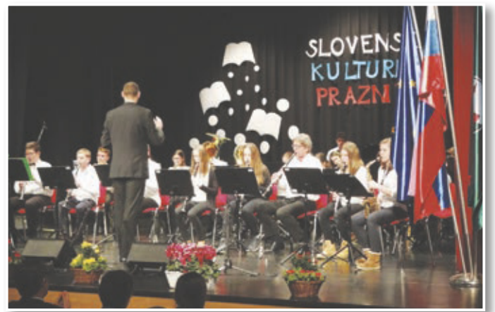
Pihalni orkester Konservatorija za glasbo in balet Maribor, Podružnična šola Lenart