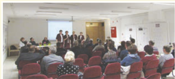
Pevke ljudskih pesmi