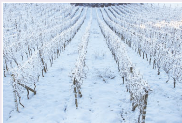
Sneg v goricah pri Sv. Ani, foto: arhiv občine Sv. Ana