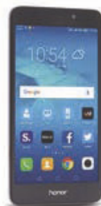
Huawei Honor 7 lite

Pripeljite novega uporabnika, izberita vsak svoj mobilni paket Brezskrbni A, B, C ali Dogaja in si za 2 leti oba zagotovita polovično mesečno naročnino. Akcijska ponudba velja do 31. 3. 2017.