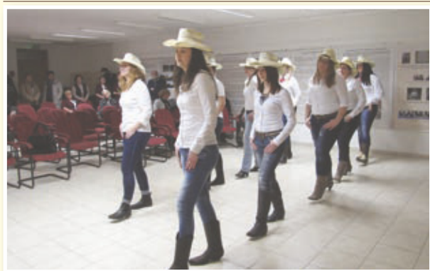
Plesalke Country Roses