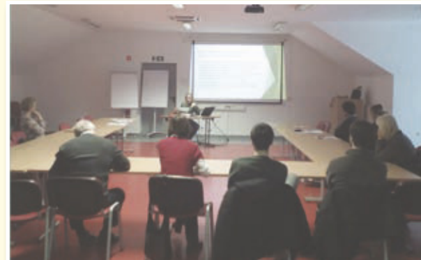
Delavnica na Sladkem Vrhu

Predstavljeni so bili vsebina in namen javnega poziva ter pogoji za izbor operacij (projektov), sofinanciranih iz Evropskega kmetijskega skla-