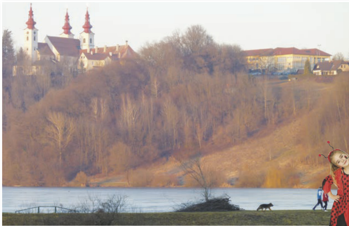
Ob nabrežju Trojiškega jezera naj bi po načrtih nastal turistično-rekreacijski center, ki bo pritegnil obiskovalce iz osrednjih Slovenskih goric in širšega prostora. Že zdaj, v drugi polovici februarja, je prostor ob jezeru priljubljena točka za sprehajalce.