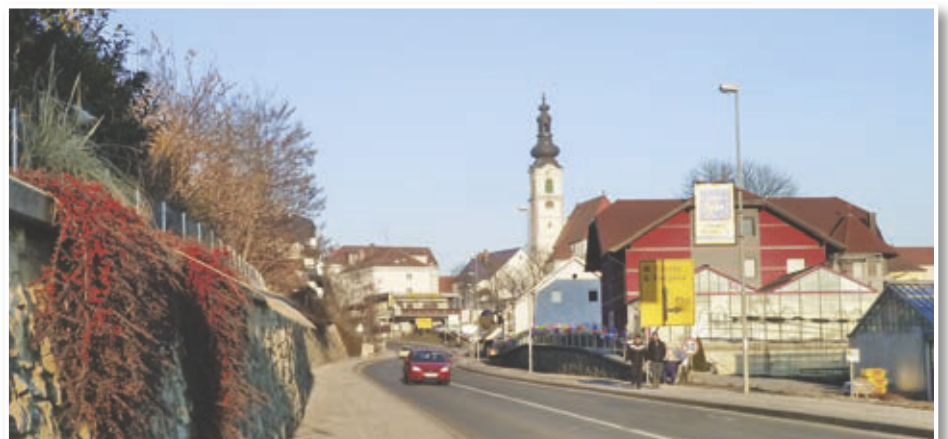
Pogled na Lenart nekega sončnega februarskega dne ...