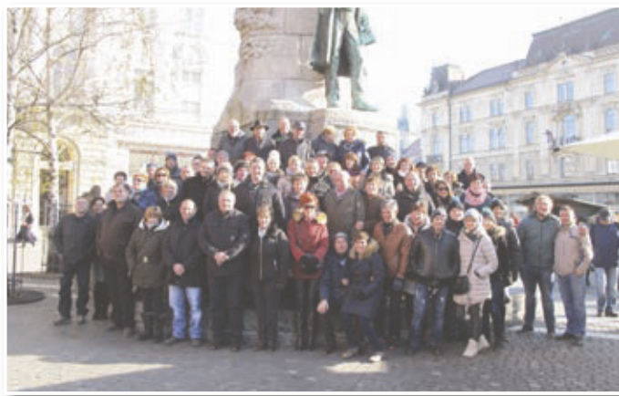
Cerkvenjačanke in Cerkvenjačani pod Prešernovim spomenikom v Ljubljani ob ekskurziji v slovenski metropoli decembra 2016.