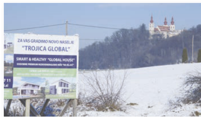
Novo naselje bodo zgradili na blagem in prisojnem južnem pobočju pred Sveto Trojico, nedaleč od Trojiškega jezera.

Odlok ureja tudi pogoje za urbanistično in arhitekturno oblikovanje. Hiše so lahko prostostoječe ali vrstne. Dvokapnice bodo morale imeti klet, pritličje in mansardo, medtem ko bodo morale imeti hiše s kletjo, pritličjem in prvim nadstropjem ravne in položne strehe. Odlok izrecno prepoveduje, da bi imele hiše večkotne izzidke in