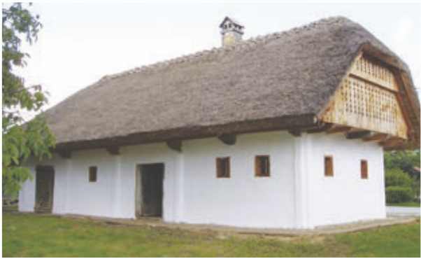
Hrgova hiša, Vitomarci 58

V nedeljo, 26. februarja, pa se bo ob 9.30 začela Fašenk povorka, ki bo krenila izpred trga pred cerkvijo Sv. Andraža mimo Hrgove domačije do Večnamenske dvorane Vitomarci, kjer bo pustno rajanje s pogostitvijo.