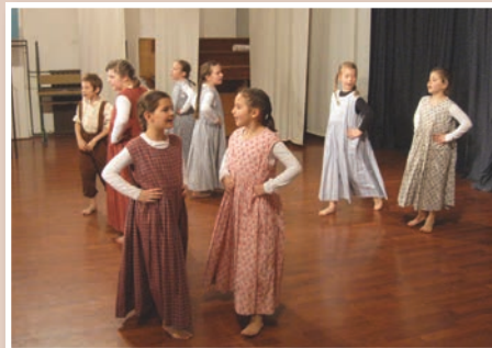
Člani folklorne skupine OŠ Sv. Ana so se predstavili s splotom Dere sen jaz mali bija.