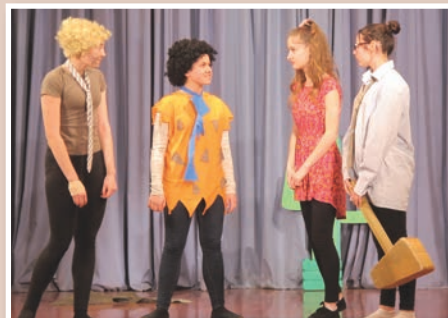
Gledališka skupina OŠ Benedikt, predstava Kremenčkovi

Otroški oder 2017 – srečanje otroških gledaliških skupin – je letos pripravil spored, v katerem so nastopile otroška gledališka skupina OŠ Voličina s predstavo To je moja koza, dramska skupina OŠ Sveta Ana s predstavo Skrivnosti iz šolskega veveja, gledališki klub OŠ Cerkevnik-Vitomarci je odigral Urško in povodnega moža, gledališka skupina OŠ Benedikt pa je nastopila s Kremenčkovi.