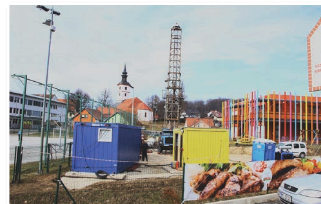
Pogled na vrtino v Benediktu ob remontu 22. februarja 2017