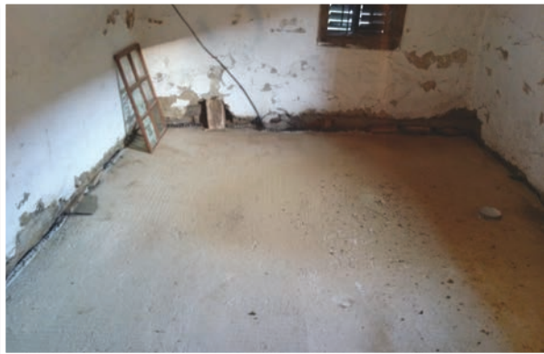
Na Kaplovi domačiji urejajo sanitarni prostor.

jev in življenja nekoč, uredili pa se bosta tudi muzejska in etnološka zbirka na obeh domačijah. V okviru projekta nastaja tudi EtnoTour paket, ki združuje razdrobljeno turistično ponudbo območja, in čezmejna aplikacija, kjer bodo na enem mestu zbrani podatki o kulturni in naravni dediščini, turistični ponudbi, MSP-jih ipd. in omogočen