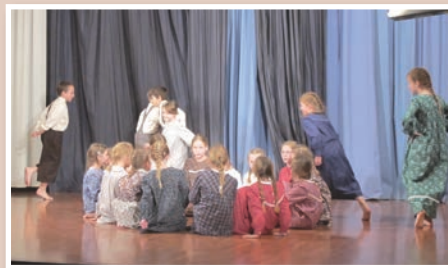
Otroška folklorna skupina Postružjeki KD Trojica