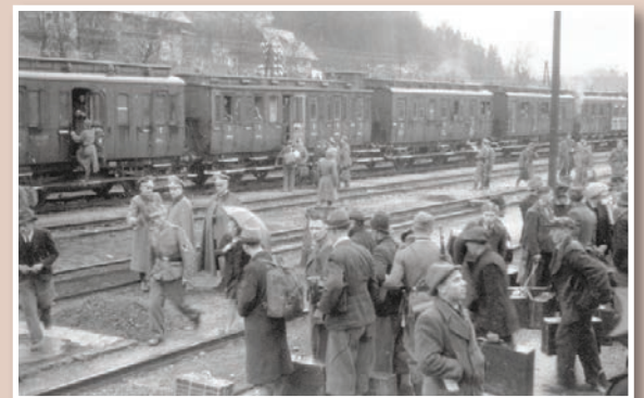
Mobiliziranci čakajo na vlak ...

Po podatkih Inštituta za novejšo zgodovino Slovenije v Ljubljani, ki vodi bazo podatkov o žrtvah vojne 1941–1945 in zaradi nje na Slovenskem, je padlo 9.942 mobilizirancev v nemško vojsko. To je velika številka, sploh v primerjavi s padlimi mobiliziranci v italijansko vojsko, ki jih je bilo 1.279, in padlimi mobiliziranci v madžarsko vojsko, ki jih je bilo samo 200. Mnogi mobiliziranci so prihajali s front