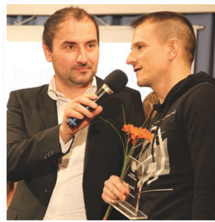
Naj ekipa - NK Lenart