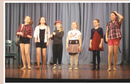
Dramska skupina OŠ Sveta Ana še vedno suvereno zagotavlja, da šolski WC-ji skrivajo marsikatero skrivnost.