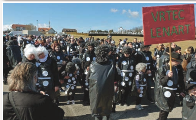
Nadaljevanje na str. 12 ...

Promet težkih tovornih vozil, ki so namenjena proti Gornji Radgoni, Tratam ali v lenarško industrijsko cono, so preusmerili tako, da morajo ti zapustiti avtocesto na priključku Sveta Trojica ter pot nadaljevati po državni cesti R2-433, nato pa pred naseljem Radehova zaviti desno na cesto Radehova-Spodnji Porčič, kjer je že zgrajen del vzhodne obvoznice. Od tam morajo tovornjaki zaviti levo na državno cesto R3-737, peljati mimo industrijske cone ter se priključiti na cesto R2-449 proti Gornji Radgoni ali Tratam. Enak obvoz velja za obratno smer in je označen s prometno signalizacijo.