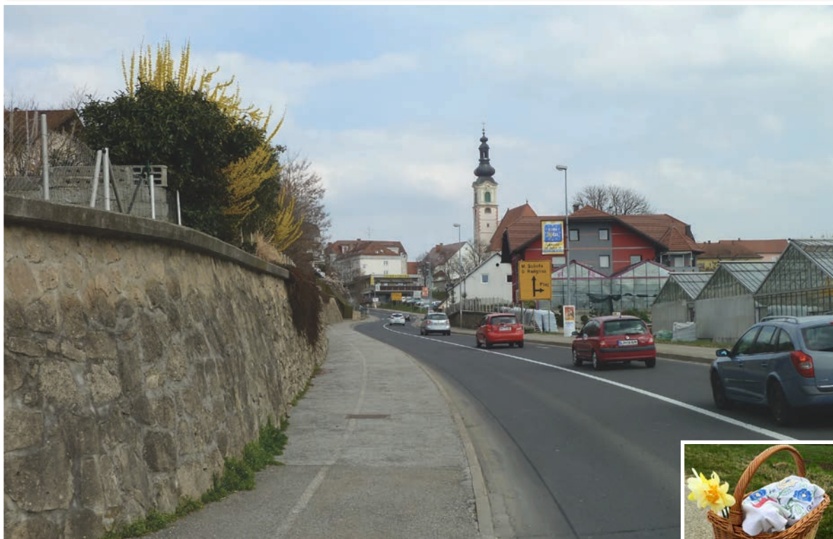
Glavna vpadnica v mesto Lenart na prvi pomladni dan 2017 brez množice težkih tovornjakov. Ti morajo poslej Lenart zaobiti po obvozni poti.