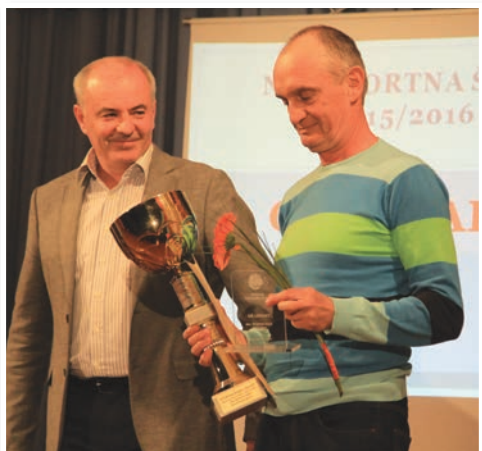
Naj šola - OŠ Lenart