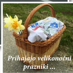
Prihajajo velikonočni prazniki ...