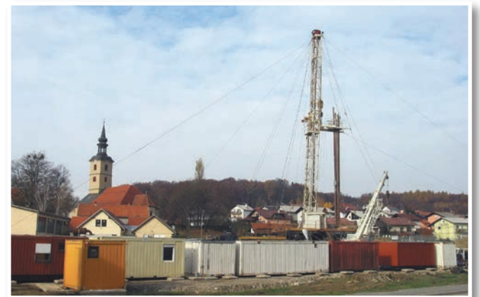
Pogled na vrtni stolp v Benediktu 2004. leta