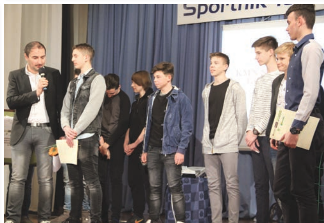
Najbolj perspektivna športna ekipa