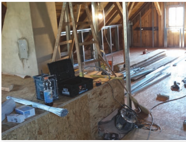
Urejavanje spalnih in sanitarnih prostorov v mansardi Grafonževe domačije

jev in življenja nekoč, uredili pa se bosta tudi muzejska in etnološka zbirka na obeh domačijah. V okviru projekta nastaja tudi EtnoTour paket, ki združuje razdrobljeno turistično ponudbo območja, in čezmejna aplikacija, kjer bodo na enem mestu zbrani podatki o kulturni in naravni dediščini, turistični ponudbi, MSP-jih ipd. in omogočen