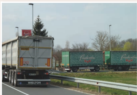
Tovornjaki na obvoznici pred Radehovo.

Promet težkih tovornih vozil, ki so namenjena proti Gornji Radgoni, Tratam ali v lenarško industrijsko cono, so preusmerili tako, da morajo ti zapustiti avtocesto na priključku Sveta Trojica ter pot nadaljevati po državni cesti R2-433, nato pa pred naseljem Radehova zaviti desno na cesto Radehova-Spodnji Porčič, kjer je že zgrajen del vzhodne obvoznice. Od tam morajo tovornjaki zaviti levo na državno cesto R3-737, peljati mimo industrijske cone ter se priključiti na cesto R2-449 proti Gornji Radgoni ali Tratam. Enak obvoz velja za obratno smer in je označen s prometno signalizacijo.