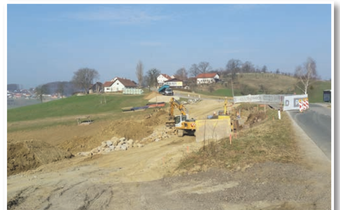
Sanacija 2. plazov na državni cesti med Lenartom in Jurovskim Dolom je v polnem teku.

17. februarja 2017 je v prostorih Občine Sv. Jurij v Slov. goricah potekalo odpiranje ponudb za rekonstrukcijo drugega dela Gasterajske ceste v dolžini cca 2,5 km. Na razpis se je prijavilo 9 ponudnikov. Že v razpisni dokumentaciji je bilo zapisano, da bo prišlo do pogajanj s ponudniki. Ponudbe, ki