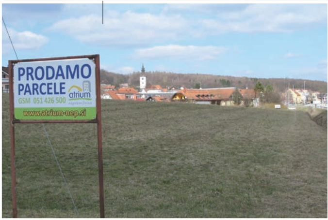
Na južni strani Benedikta bo zraslo novo naselje B-11, v katerem bo 21 gradbenih parcel.

za potrebe stanovanjske gradnje«, ki ga je izdelalo podjetje Progrin iz Gornje Radgone. V času javne razgrnitve so lahko zainteresirani podali na osnutek podrobnega prostorskega načrta pripombe in predloge, ki jih bodo pristojni v nadaljnjem postopku sprejemanja odloka proučili in po možnosti tudi upoštevali.