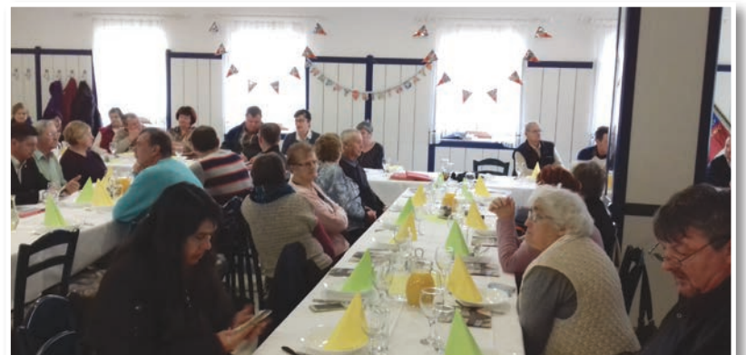
V Kmetičevi gostilni v Voličini se je zbralo preko 50 članov ZB Lenart.