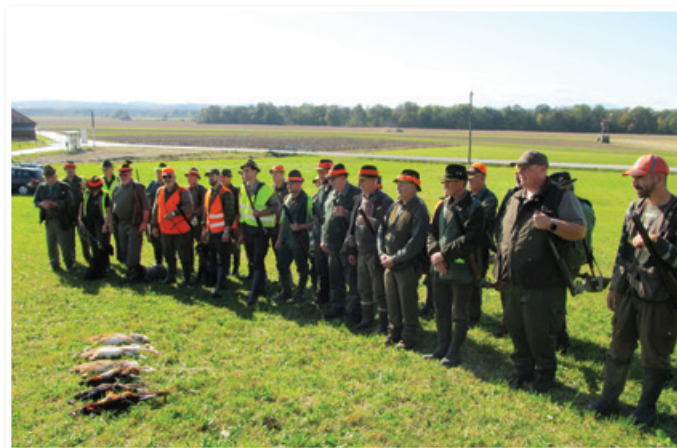
Pozdrav lovini in zahvala Diani po lovu v Čagoni