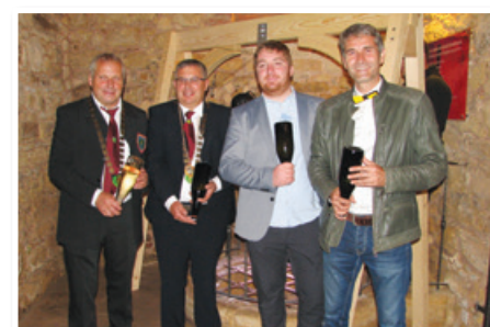
Vinogradniki Klobasa, Breznik, Šenveter in Hafner s steklenicami penim, ki so leto dni zorele v vodnjaku