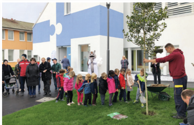
Ob odprtju novih prostorov Zdravstvenega doma Lenart ...