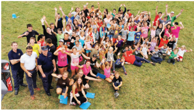
9. tabor gasilske mladine GZ Lenart

govarjajo za svoje sotovariše v intervencijah. Ob vsem tem jim je v veliko pomoč zavedanje, da lahko, smejo in zmorejo računati na vso moč, ki se skriva v opremi in srcih teh fantov in deklet. Da to naši operativni gasilci znajo, potrjujejo številne intervencije, ki so bile uspešno zaključene, poškodovanih gasilcev pa v intervencijah skorajda ni bilo, poškodbe pa so bile lažje.