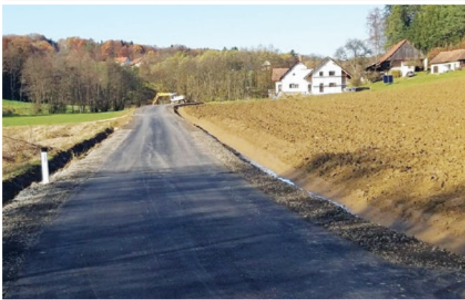
V Občini Benedikt so modernizirali cesto Drvanja-Bačkova-Froleh na ruralnem območju, saj si prizadevajo za enakomeren razvoj občine kot celote.