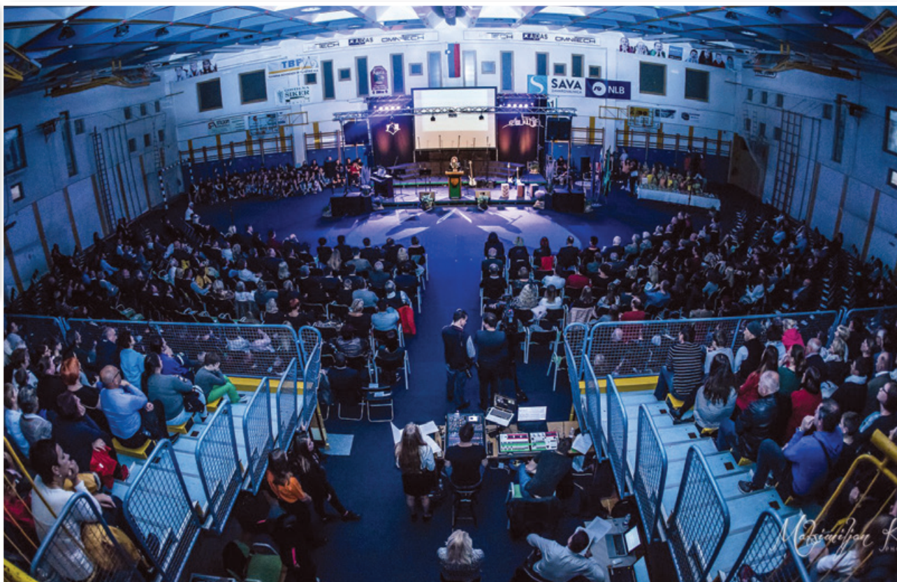
Osrednja proslava ob lenarškem trojnem prazniku ...