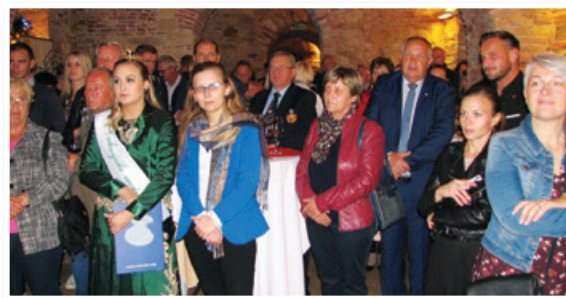
Samostanska klet v Sv. Trojici je bila polna, manjkale niso niti kronane glave.