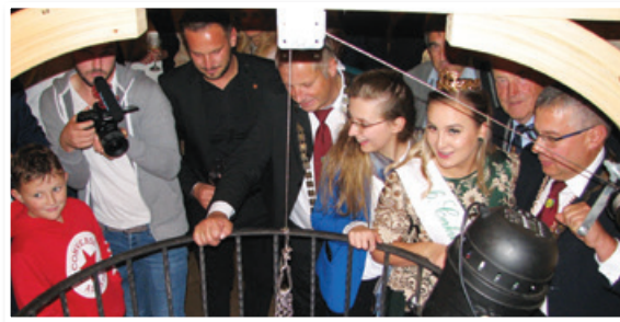
V pričakovanju lansko leto v vodnjak spuščene penine