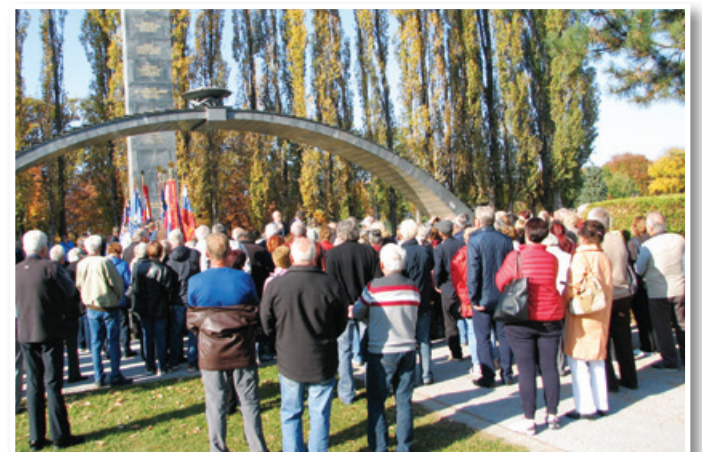
Spomenik je delo nekdanje Granitne industrije iz Oplotnice. Odkrit je bil 1. novembra 1961.

74 let po koncu najhujše morije v sodobni zgodovini Evrope si mnogi izmed nas le stežka predstavljamo, v kakšnih razmerah so v vojnih letih med 1941 in 1945 živeli naši ljudje. To