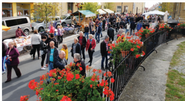
Praznik Sv. Lenarta ...