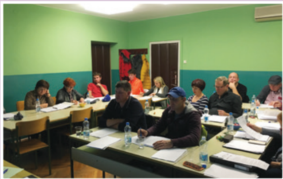
Zeleni biznis – Organizacijski vidik poslovanja

T: 02 720 78 88 ali 051 368 118, E: izobrazevalnicenter.slogor@gmail.com