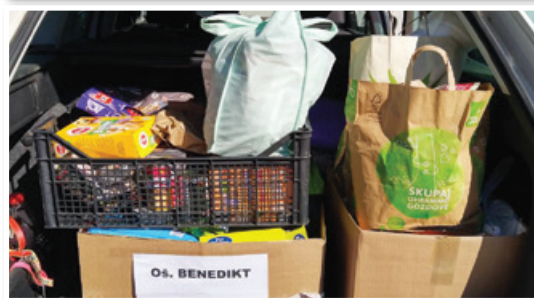
Na DZZ Maribor so bili še posebej zadovoljni z darili na OŠ Benedikt.

učencem in hvala staršem za odziv na zbiralno akcijo - hvala za vsako konzervico, vrečko, briket, igračko, koco posebej... Z nami je bila tudi naša s(m)ričica Mala, ki nam je popestrila dopoldne“, pravijo na DZZ Maribor.