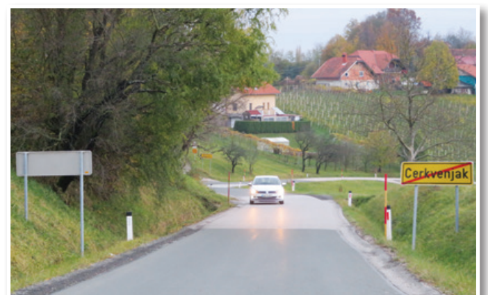
Občina namerava zgraditi tudi pločnik od Cerkevjaka do doline v Stanetincih, ki bo povečal varnost prometa na južni oziroma ptujski vpadnici v Cerkevjak, ki je čedalje bolj prometna.