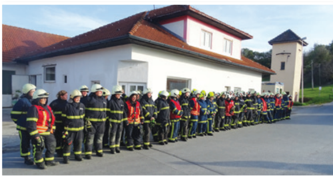
7. operativne vaje za članice GZ Lenart

Brez pretiravanja lahko trdimo, da so ženske pomemben del gasilstva. Delujejo v društvih, kjer opravljajo številne naloge: so podpora svojim operativnim članom (gasilstvo je v veliki meri družinska tradicija), so tajnice, blagajničarke, mladinske mentorice in v zadnjem času tudi enakovredne članice operativnih enot – kot fantje in može imajo potrebna specialna znanja. Letos so pripravile in uspešno izvedle že 7. operativno vajo za članice GZ Lenart. V njej se sodelovalo 57 gasilk; dobro delo v komisiji za članice je bilo nagrajeno s tem, da je bilo predsednici naše komisije zaupano vodenje regijske