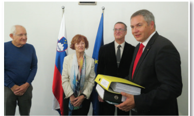
Petico za uskladitev pokojnin za 7,2 odstotka so predstavniki Sindikata upokojujencev Slovenije in Civilne iniciative za upokojujence gre predali predsedniku državnega zbora mag. Dejanu Židanu.