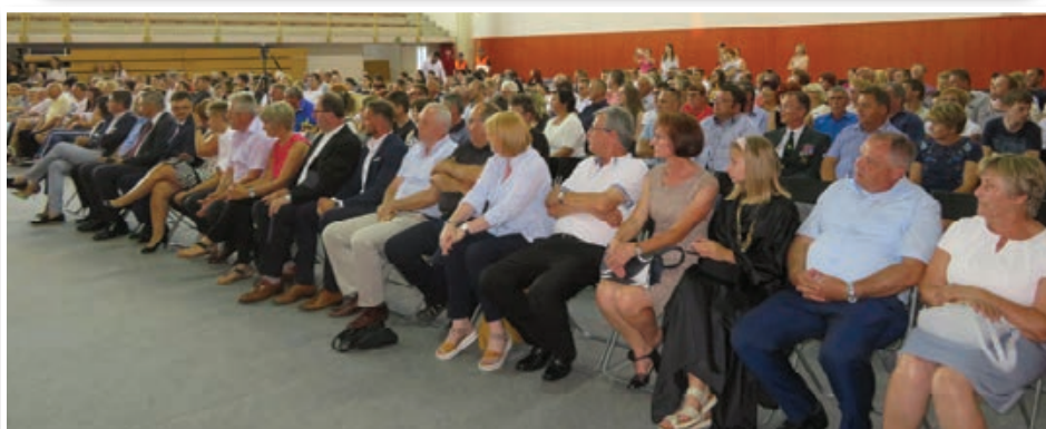
Benedikt praznuje 20. občinski praznik od 28. junija do 13. julija. Na osrednji proslavi je govoril predsednik DZ RS mag. Dejan Židan. Str. 3