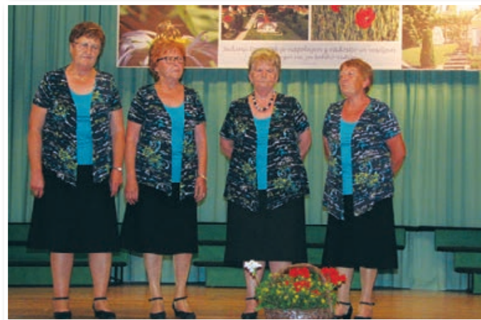
Ljudska pesem je doma tudi v Lenartu, kjer jo neguje skupina pevk pod okriljem DU Lenart.