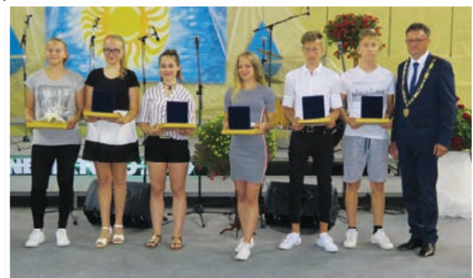
Najbolj uspešni učenci in učenke so prejeli »Županovo petico«.