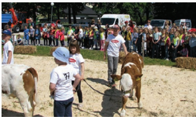
Maneža Liska z najmlajšimi rejci