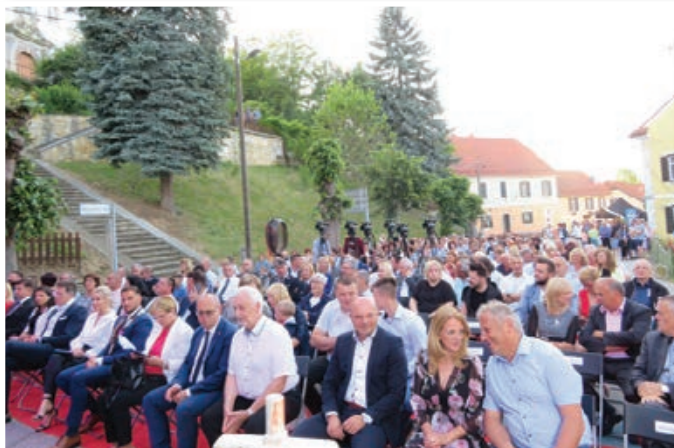
Otvoritvena slovesnost Trojicafesta je potekala v čudovitem ambientu na Trojiškem trgu v središču Svete Trojice, kar ji je dalo še poseben čar.