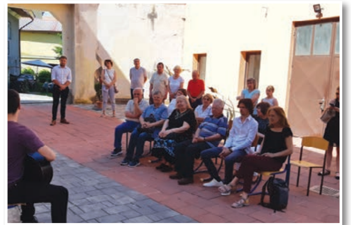
Dvorišče Galerije Dani je prijeten ambient za prireditve.