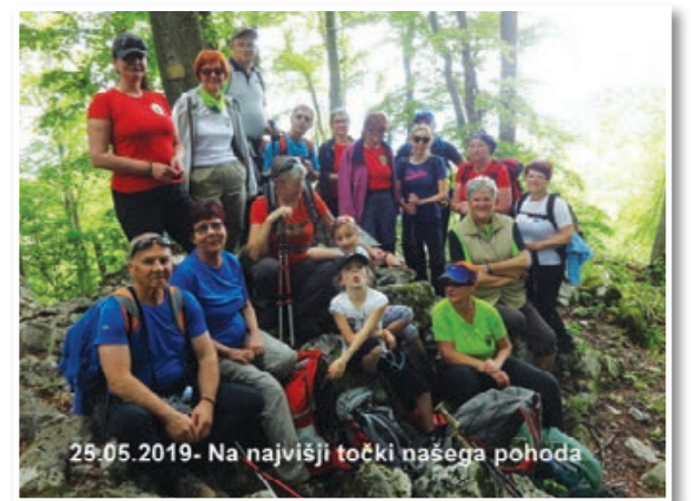
25.05.2019. Na najvišji točki našega pohoda

V vasi Grmače nad Moravčami smo izstopili, se pripravili za pohod in po dvajsetih minutah prispeli do Planinskega doma »Ušte-Žerenk«. Od tu je bil prekrasen razgled na moravško dolino, tja do Kamniških Alp. Tudi postrežba je bila prijazna in kvalitetna, kar manjka marsikateremu gostinskemu lokalu. Nadaljevali smo mimo »ranča« Osole, kjer so nas pozdravili konji ter različne pasme kozic. V nadaljevanju smo prešli na južno stran hribovja, kjer so se nam začeli odpirati pogledi na savsko dolino. Najlepši razgled se nam je ponudil nad kresniškim kamnomlomom, kjer lomijo kamen za proizvodno apna v vasi Kresnice na desnem bregu Save. Na samo vas in dolino reke Save, tja do Litije, se nam je odprl pogled z vzletišča za jadralna padala. Na najvišji točki pohoda, na 880 m