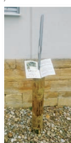
Točka Ana Lušin ob OŠ Benedikt