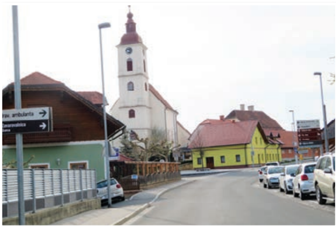
Turistična destinacija Sveta Ana, ki se od začetka poletja ponaša s certifikatom »Slovenia Green Destination Silver«, je ena najlepših turističnih destinacij v Osrednjih Slovenskih goricah in nasploh v severovzhodni Sloveniji.