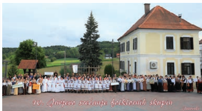
10. Jurjevo srečanje folklornih skupin

Miroslav Breznik