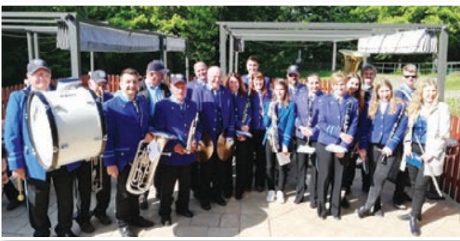
Pihalni orkester Apače

Praznični prvomajski dnevi so se v Varovanem domu Ščavnica v Občini Sveta Ana začeli z glasbo. Takoj po zajtrku jih je presenetil obisk Pihalnega orkestra Apače. S prvomajsko budnico so prebudili prav vsakega, stanovalke in stanovalce kot tudi zaposlene so navdušili z igranjem znanih melodij, ob katerih so tudi zaplesali in navdušeno ploskali. Praznični dan je minil ob številnih obiskih svojcev, ki so popestrili domsko dogajanje. Ker jim je bilo vreme naklonjeno, so ga izkoristili za peko pleskavic na žaru na terasi doma. Člani pihalnega orkestra so nam obljubili ponovno snidenje prihodnje leto in povedali, da jih po vaseh