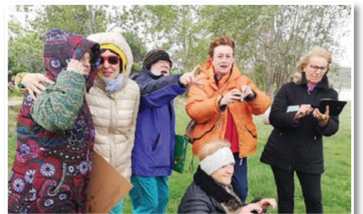
Na obali, pihala je burja ...