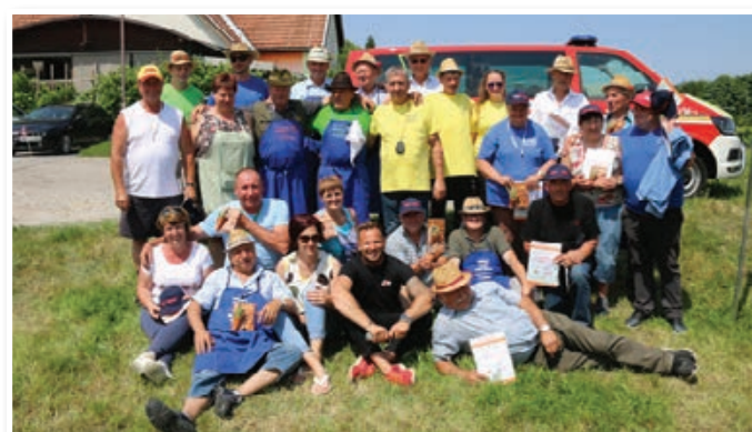
Tekmovalci z organizatorji, sodniki in županom