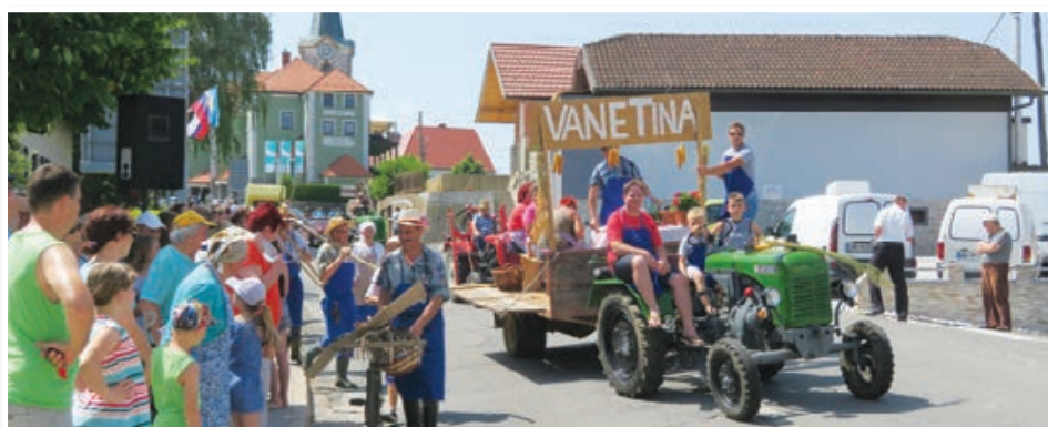
V Cerkvenjaku so občinski praznik praznovali od 31. maja do 1. julija. V ospredju je bila tudi tokrat tradicionalna povorka starih običajev. Str. 4