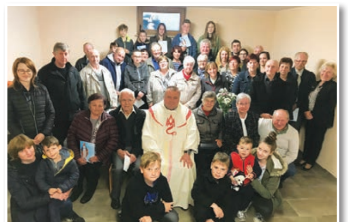
Utrine z zaključnega druženja na domačiji Vuzem