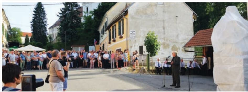
Prireditve ob trojiškem občinskem prazniku so se zile v Trojicafest od 7. do 16. junija, ena osrednih pa je bilo odkritje spomenika Ivanu Cankarju. Str. 8