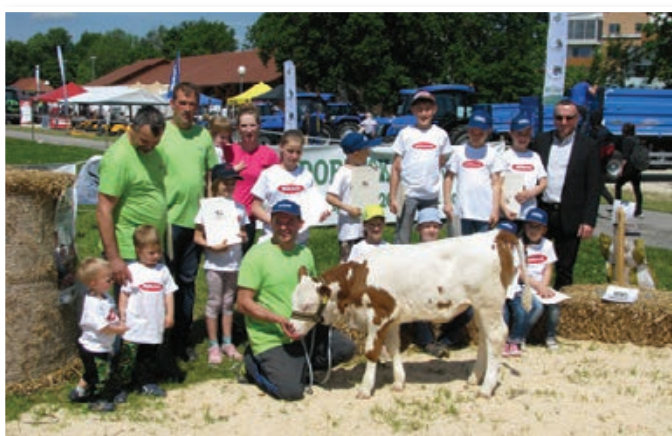
Udeleženci in organizatorji prireditve LISKA