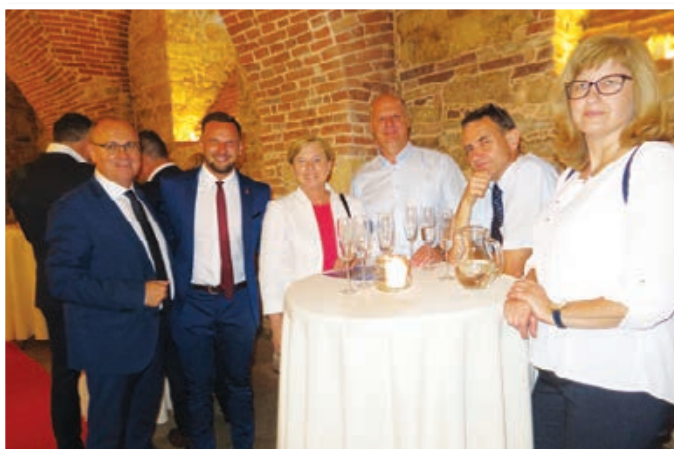
Otvoritve Trojicafesta so se udeležili številni ugledni gosti, ki so se pred otvoritvijo zbrali v samostanski kleti.