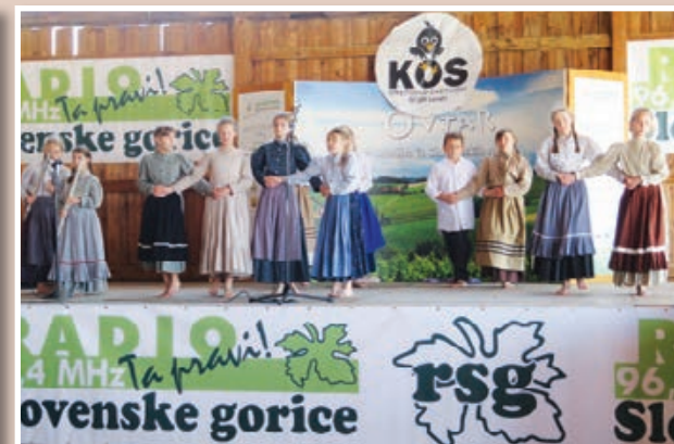
Na otvoritvi sejma so najmlajši izvedli prisrčen kulturni program.