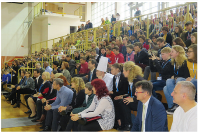
Na otvoritveni slovesnosti triletnega mednarodnega projekta HILS v Športni dvorani Benedikt so se zbrali mladi in njihovi profesorice in profesorji iz osmih evropskih držav.

V nadaljevanju so učenske in učenci Osnov-