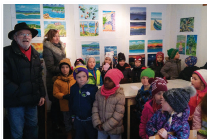
Obisk otrok iz Vrtca Lenart