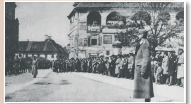
Maister pred postrojem slovenske vojske 15. 12. 1918