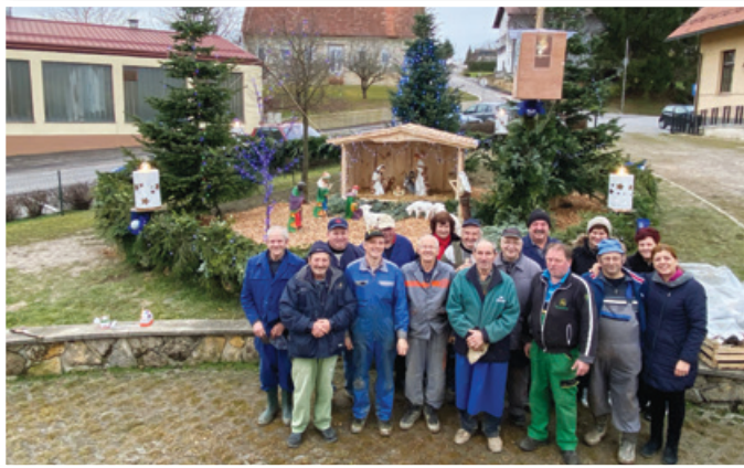
Ponosni člani društva Presmec