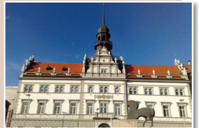
Narodni dom Maribor