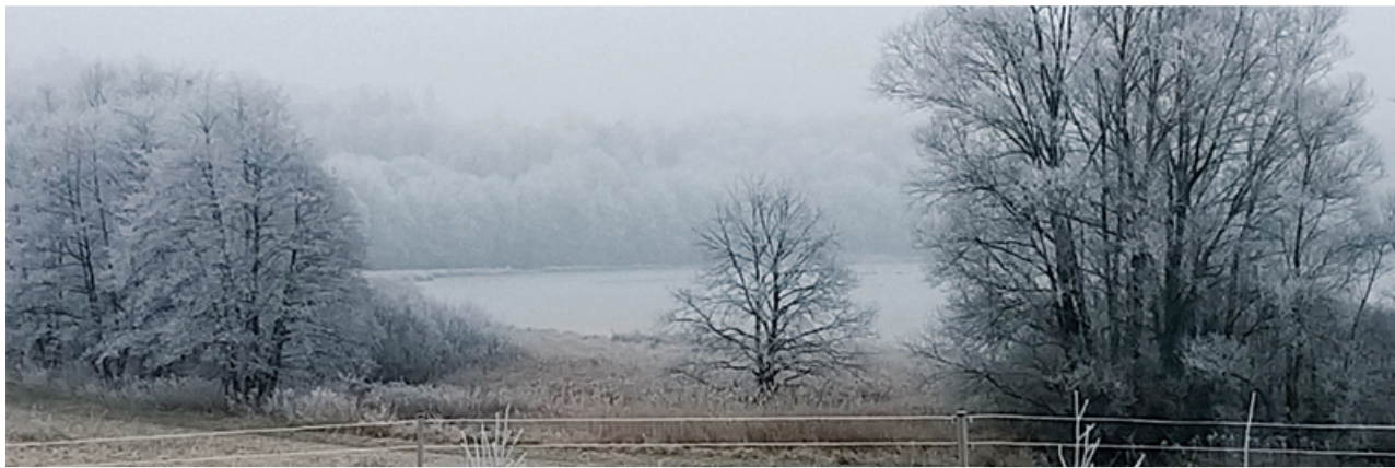
Komarnik, ena največjih lenarških naravnih danosti, v zadnjem tednu januarja s pridihom zime