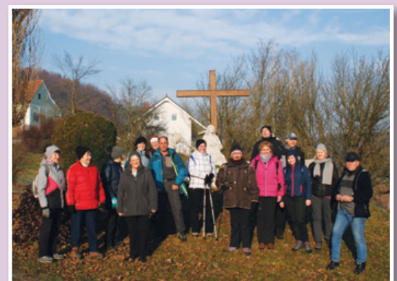
Študijski krožek Lahkih nog naokrog

Leto 2020 smo v Izobraževalnem centru pričeli aktivno. Veseli smo bili, da so se nam pri študijskem krožku Lahkih nog naokrog na s soncem obsijanem januarskem pohodu med drugim pridružili tudi udeleženci Varstveno delovnega centra Polž Maribor, enota Lenart, in strokovna sodelavka Centra za krepitev zdravja Lenart . Tudi na naslednjemu pohodu, v petek, 7. februarja 2020 , se veselimo čim večje udeležbe. Bodimo čim več na svežem zraku tudi v zimskim mesecih, saj s tem krepimo naš imunski sistem.