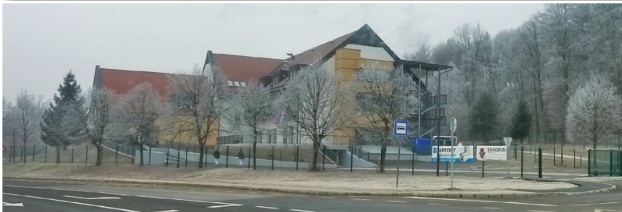
Nestrpno pričakovana preobrazba iz Hotela Črni les v novi dom starostnikov - Dom sv. Agate