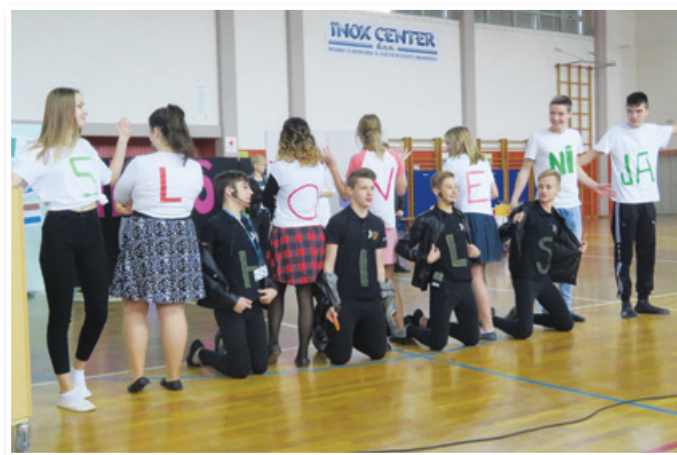
Učenke in učenci Osnovne šole Benedikt so pripravili zares domiselni in zanimiv kulturni program.