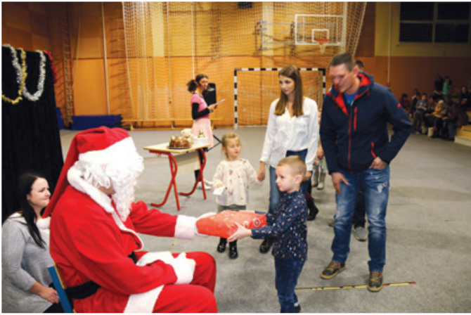
Božiček deli darila otrokom