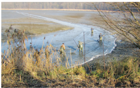
Ribiči odstranjujejo mulj iz jezera, da bodo ribe lahko plavale proti iztoku iz jezera v odlovno jamo (v kateri se zbirajo ribe, izven jezera), voda nato odteka v staro naravno strugo reke Pesnice. Lepo se vidi količina mulja v kotanji, ki ga je vedno več, posledica bo nastanek mokrišča, če se mulj ne bo odstranil.