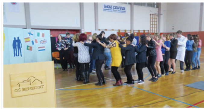
Učenke in učenci iz Finske so uspeli v svoj narodni ples pritegniti tudi mlade iz drugih držav.