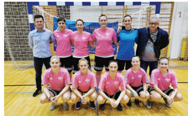
Dekleta Slovenskih goric 3. v Zagrebu