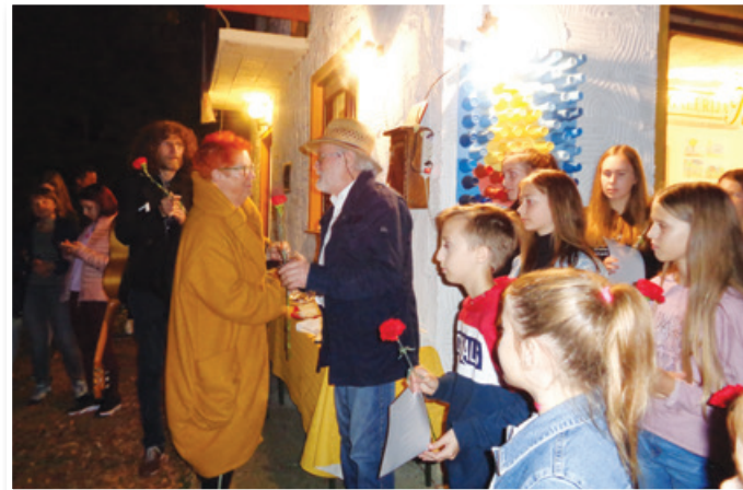
Ob razstavi v Galeriji Krajnc

je ustvarjalnost blizu vse življenje. Žal je odziv drugih šol v naši regiji slabši, čeprav so tovrstne razstave mladim blizu, lahko bi rekli – pisane na kožo.