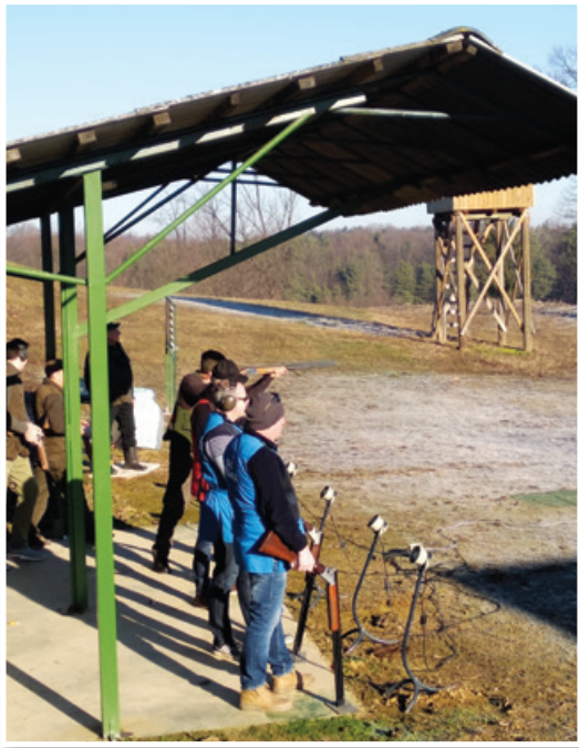
Mraz v Oseku ni motil strelcev.