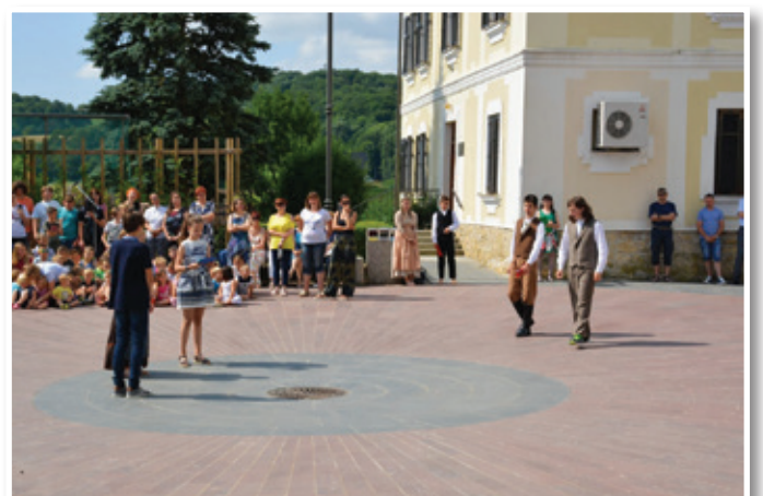
Oživitve trškega jedra z učenci OŠ J. Hudalesa Jurovski Dol