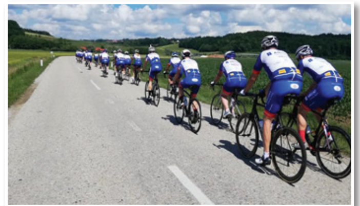
Kolesarjenje ob obletnici