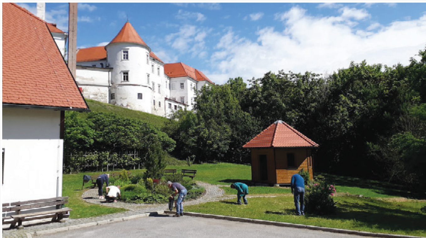
Epidemija covid-19 je premaknila življenje iz ustaljenih tirnic v neke nove, ki pa smo jih doumeli, sprejeli in zagotovili, da se je (uradno) končala in da smo spet postopno začeli živeti »po starem«. Vse nas je gnala želja po zdravju. Zdravju pa občutno pripomore tudi zdravo okolje. Čisto! Zanj so poskrbeli tudi v Zavodu Hrastovec.