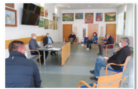
Nošenje mask v zaprtih prostorih je še vedno priporočljivo, saj z masko ne ščitimo sebe, temveč druge. Drugi pa z uporabo mask ščitijo nas.

1. junija je bil prvi dan po epidemiji. Tega dne je predsednik vlade Janez Janša nagovoril državljane in državljanke ter med drugim dejal, da je Slovenija med najuspešnejšimi državami na svetu v boju z epidemijo koronavirusa. Po njegovih besedah je Evropska komisija v svoji zadnji napovedi pri nas sprejete ukrepe ocenila zelo pozitivno. Po njihovi presoji ima