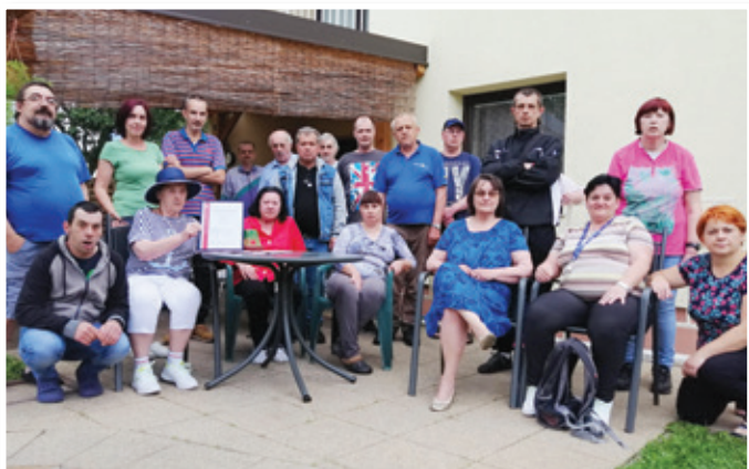
Stanovalci in zaposleni (na fotografiji DBE Maribor) so ponosni, da so pridobili certifikat E-Qalin.

v kateri je delovala predstavnica zakonitih zastopnikov stanovalcev in vodstvena skupina. V prav vseh skupinah so sodelovali tudi stanovalci. V presojanem obdobju so obravnavali 65 kazalnikov in 25 kriterijev. Zaključek presoje je bil, da zavod uresničuje svoje poslanstvo tako, da v ospredje postavlja stanovalca in izvajanje kvalitetnih storitev po meri stanovalca. Posebno skrb namenja individualnemu načrtovanju ter da stanovalce