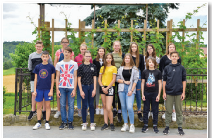
Učenci, ki so prejeli zlato priznanje