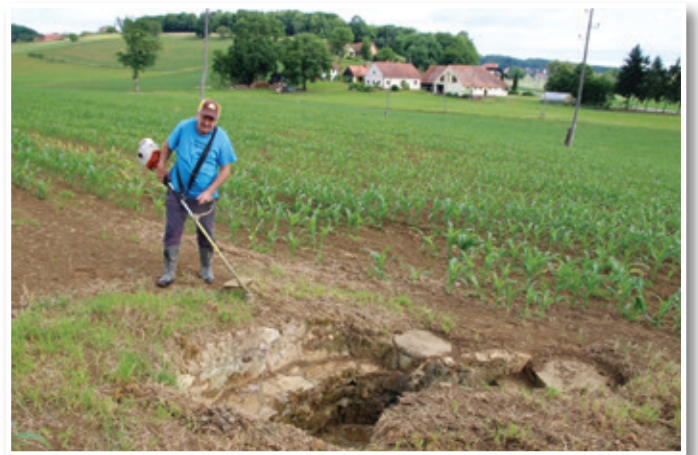
Pogled na Špinglerjevo slatino, ki se nahaja na Špindlerjevi njivi, s katere seže pogled na Špindlerjevo domačijo.

tonskih cevi, uredil pipo za natakanje slatine, obenem v zemljo položil 150 m cevi za odvod slatine, ki stalno priteka iz zemlje, do bliž-njega potoka. S tem smo izsušili del njive, ki sedaj, ko smo združili parcele, v enem kosu meri 6,5 ha. Ker po slatino nihče ne hodi več, pač do nje ni poti, kajti njiva je v celoti zasa-jena s koruzo. Vprašanje je tudi, če je slatina, ker je okoli nje njiva, ki je gnojena z umetni-mi gnojili, izvaja pa se tudi škropljenje proti plevelu, užitna. Meni je bil glavni namen, da se slatina ohrani za zanamce.«