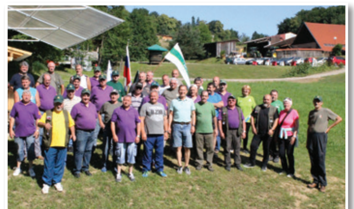
Vedro razpoloženi pred začetkom tekmovanja

bombo in se pomerili v streljanju z zračno puško. Najbolj zagreti pa so v bližnjem rib-