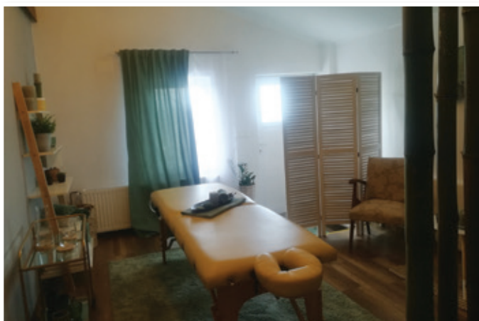
Notranjost masažnega salona