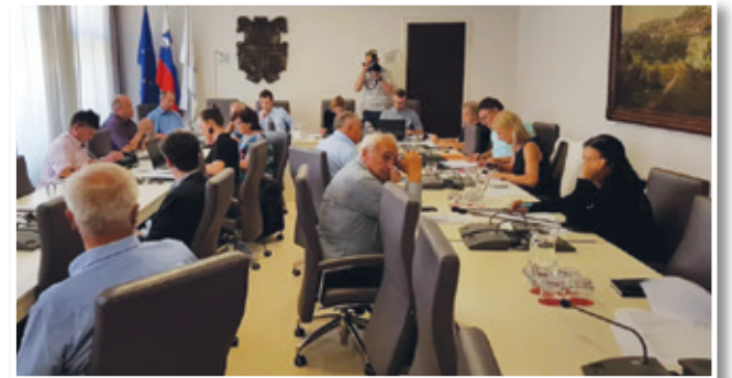
Izredna seja Kolegija županov spodnjega Podravja 23. 6. 2020: vendarle skupaj v razpis za izdelavo projektne dokumentacije za obnovo vodovoda, a le za skupne vode.

Ker se projekt za nujno obnovo vodovodnega sistema v Spodnjem Podravju, s katerim se namerava 19 občin iz Spodnjega Podravja in Slovenskih goric potegovati za evropska sredstva, že skoraj leto in pol ni premaknil z mrtve točke, so se občine Sveti Andraž, Sveta Trojica, Cerkevjak, Desternik in Trnovska vas na začetku junija odločile projekt pospešiti z odstopom od skupne priprave projektne dokumentacije ter najavo, da bodo s ciljem pospešitve obnove same poskrbele za pripravo projektne dokumentacije za svoj del vodovodnega sistema. S svojo namero je pet občin uspelo. Njihova poteza je namreč spodbudila vse občine iz Spodnjega