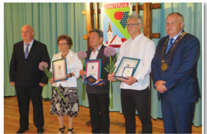
Namesto osrednje proslave ob 22. občinskem prazniku so letos v Občini Cerkevjak pripravili razširjeno slovesno sejo občinskega sveta, na kateri so podelili priznanja in nagrade najbolj zaslužnim in uspešnim.

Po razširjeni seji občinskega sveta je bila v cerkvi sv. Antona slovesna maša ob občinskem prazniku. Po njej so pripravili priložnostno druženje ob stojnicah na trgu pred občino, kjer je za praznično vzdušje poskrbel pihani orkester MOL iz Lenarta.