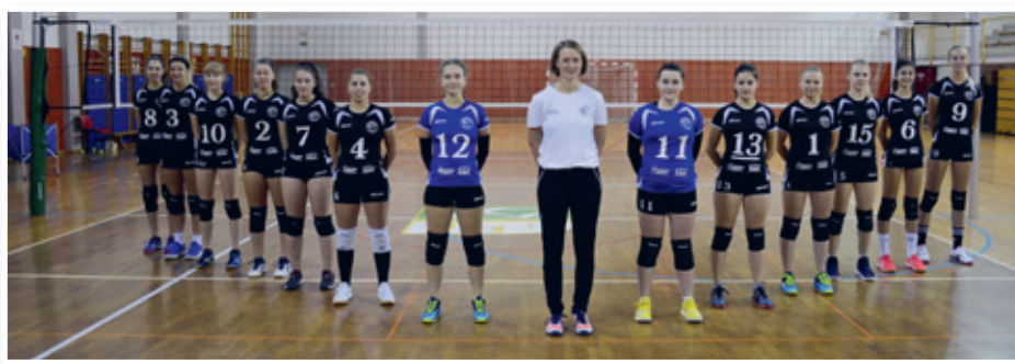
Članska ekipa OK Benedikt

V prvem delu smo odigrale nekaj izjemno dobrih tekem. Do konca koledarskega leta smo tako dosegle 5 zmag in 6 porazov. Kar 4 tekme (dve zmagi in dva poraza) smo odigrale 5 nizov, kar pomeni, da ob zmagi nismo prejele vseh treh točk, pa vendar smo tudi ob porazu dobile eno točko. V novem koledarskem letu in v drugem delu sezone smo si želele še več. Pridno smo trenirale, se maksimalno borile tudi na treningih, kar se je izjemno obrestovalo. Prve 3 tekme smo nastopile suvereno in premagale nasprotnice. Med njimi so bile tudi tedaj prvovrščene punce iz Murske Sobotne. Zadnja tekma, ki smo jo odigrale 7. marca, je bila proti ekipi iz Mislinje. Punce so na domačem terenu odigrale dobro tekmo in si priborile zmago.