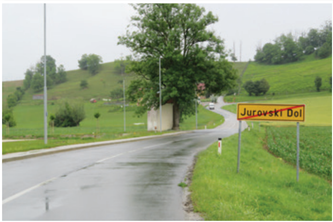
Asfaltirane kolesarske poti, ki bodo speljane ob regionalni cesti in bodo široke 2,6 metra, bodo lahko v nadaljevanju s pridom uporabljali tudi pešci, invalidi, matere z otroki in drugi, ki danes na cestah brez pločnikov niso najbolj varni.

ki bo dolga 4,5 kilometra. Tudi trasa 14 bo v naravi kolesarska steza od Jurovskega Dola preko Voska do Pesnice v dolžini 11,1 kilometer. Skupno bodo tako na območju Občine Sveti Jurij v Slovenskih goricah zgradili okoli 6 kilometrov asfaltiranih kolesarskih stez, širokih 2,6 metra. Te kolesarske steze bodo celo malce širše od marsikatere lokalne ceste, ki so jo zgradili v preteklosti.