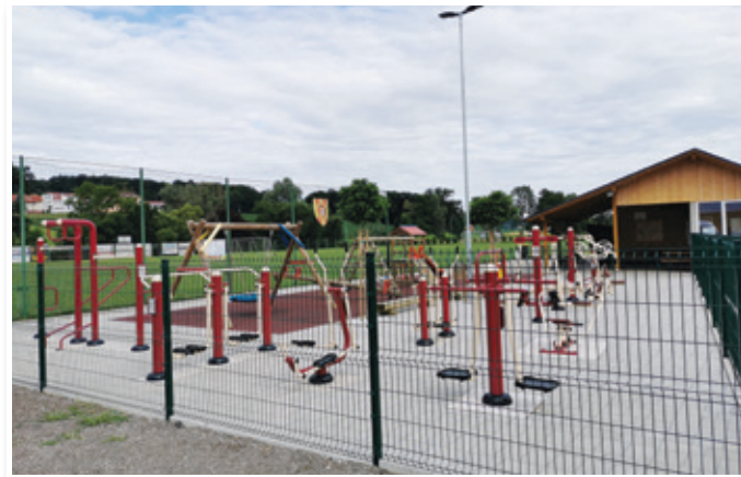
Z 28. majem 2020 je jurovska občina sprostila ukrepe ob omejitvi uporabe športnih površin na območju občine. Uporabnike otroških igral in fitnesa na prostem prosijo, naj upoštevajo priporočila NIJZ.

Sprejet je bil tudi sklep o spremembah in dopolnitvah Sklepa o določitvi ekonomske cene vrtca v občini, ki po novem določa, da morajo starši, ki so prvič vpisali otroka v vrtec za naslednje šolsko leto, ob podpisu pogodbe poravnati akontacijo v višini 50 €. Na osnovi prejetega plačila in podpisane pogodbe bo otroku zagotovljeno mesto v vrtcu. Akontacijo bo vrtec poračunal po prvem mesecu obiskovanja programa. V kolikor starši ne pripeljejo otroka v vrtec na dan, ki je določen