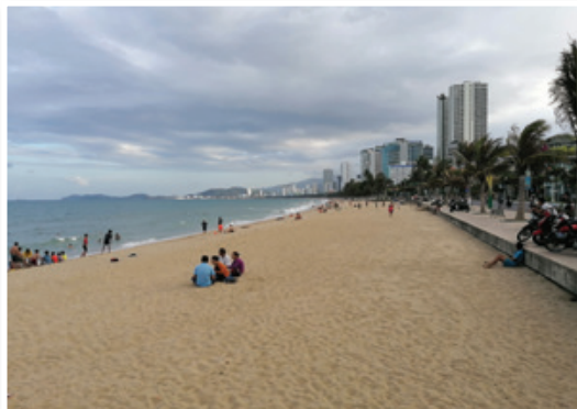
Plaža v Nha Trangu.jpg

Vietnam najbolj poznamo kot poligon za merjenje vojaške moči iz časov hladne vojne, danes pa je znan kot destinacija z značilnimi riževimi polji in kot prestolnica morske hrane. No, kuhajo zares odlično, ampak nama z Jernejem pa je bila Malezijska kuhinja vseeno malo bolj okusna. Ja, ko se že en čas klatiš naokrog, si lahko že prisvojiš malo pravice, da podajaš komentarje tudi o hrani.