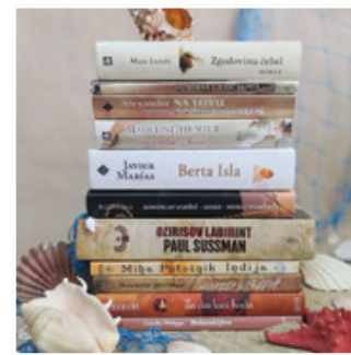
Poletno branje