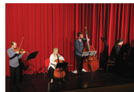
Mozart za dušo, Komorni ansambel hiše kulture Celje