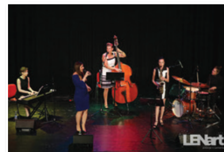
Jazz Ladies