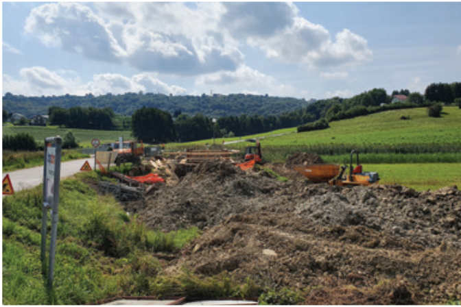
Gradnja čistilne naprave v Voličini

Dolgoročno izredno pomembna investicija je gradnja čistilne naprave za naselje Voličina. Obstoječa čistilna naprava je bila zgrajena leta 2002 v velikosti 1000 populacijskih enot. Zaradi dotrajanosti naprave in preobremenjenosti odpadnih voda naprava ni bila več zmožna čistiti odpadne komunalne vode v skladu z zahtevanimi standardi. Gradnja nove naprave kapacitete 1300 populacijskih enot bo dolgoročno rešila čiščenje odpadnih vod za naselje Voličina.