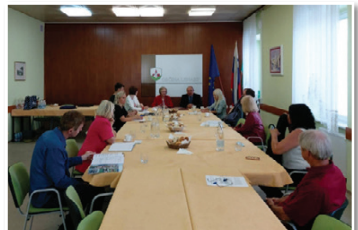
V petek, 19. junija 2020, je v sejni sobi Občine Lenart potekal podpis dogovora o vključitvi Občine Lenart v izvajanje projekta za pridobitev listine Zveze delovnih invalidov Slovenije z nazivom »Občina po meri invalidov« 2020.