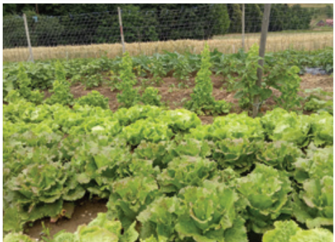
V ospredju solata sorte Canasta, primerna za setev skozi vso rastno dobo

Letošnje poletje nam je dalo obilje padavin, zalivanje skoraj ni bilo potrebno. Poznamo vrtnine, ki jim je tovrstno vreme več kot ugaljalo – kapusnice (zjelje, brokoli, brstični ohrovt, cvetača, itd.), pastinak, rdeča pesa, krompir, tudi plodovke potrebujejo veliko vode za svojo rast. Vendar pa se tokrat na račun obilice dežja soočamo s presežki vlage v zraku, ki na zelenjavi pušča posledice – razvijajo se bolezni (krompirjeva plesen na paradižniku, ožig na fižolu, gnitje gomoljev krompirja), večji je pojav uši in polžev. Pri pridelkih je večji delež pojava gnitja plodov (krompir, čebula, česen...). Še vedno pa se je treba na bolezni in škodljivce odzvati z naravi in nam prijaznimi pripravki.