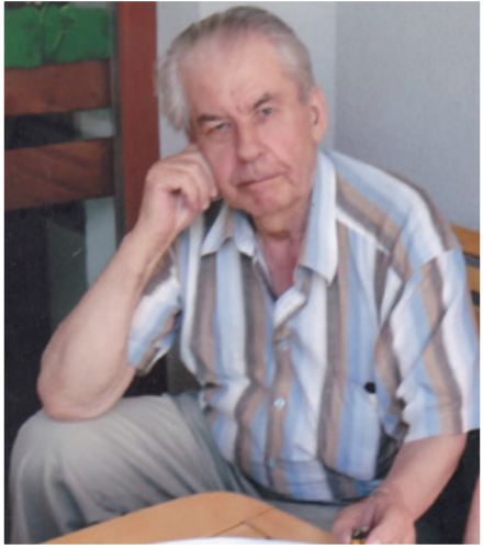
Tone v značilni drži

Z mešanimi občutki, čeprav še vedno prevladujejo pozitivne izkušnje. Kljub petinosemdeset letom se večinoma še vedno dobro počutim, tudi zaradi zdravja, ki mi dobro služi. V Domu v Beltincih, kjer živim pet let, me motijo nedosledno usklajevanje dela, nezainteresiranost za nove zamisli pri stanovalcih in večini zaposlenih in neustrezen način sedanjega vodenja doma.