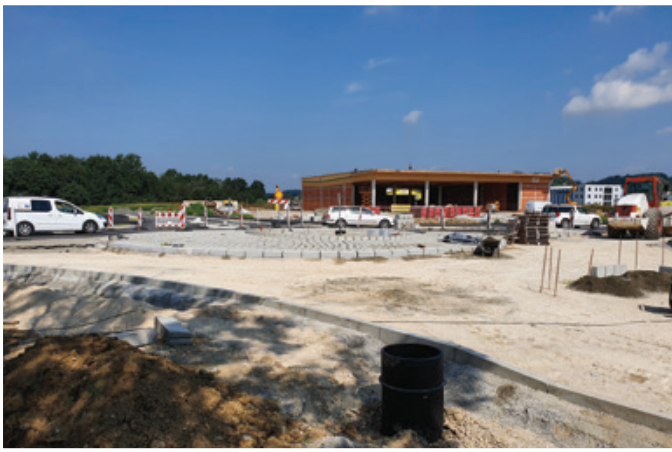
Gradnja krožnega križišča v Lenartu pri trgovini Spar