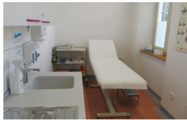
V Občini Sveta Trojica imajo od 8. junija naprej ponovno zdravstveno ambulanto, sedaj pa si prizadevajo, da bi dobili še lekarno.

Kazalniki kažejo, da prebivalci Občine Sveta Trojica za svoje zdravje ne skrbijo nič manj od povprečja v Sloveniji. Telesni fitnes otrok je blizu slovenskemu povprečju. Stopnja bolnišničnih obravnav zaradi nesreč v transportnih nezgodah je krepko pod republiškim povprečjem. Delež prometnih nezgod z alkoholiziranimi povzročitelji pa je blizu republiškemu povprečju.