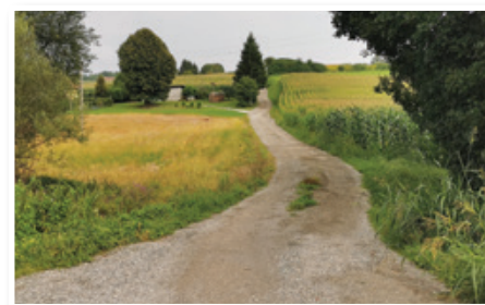
4. faza rekonstrukcije občinskih cest se bo pričela z rekonstrukcijo cestnega odseka v Zg. Partinju.