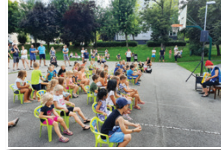
Kako je kameleon Ludvik našel svojo barvo