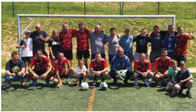
Prvaki veteranske lige KMN Mizarstvo Širovnik