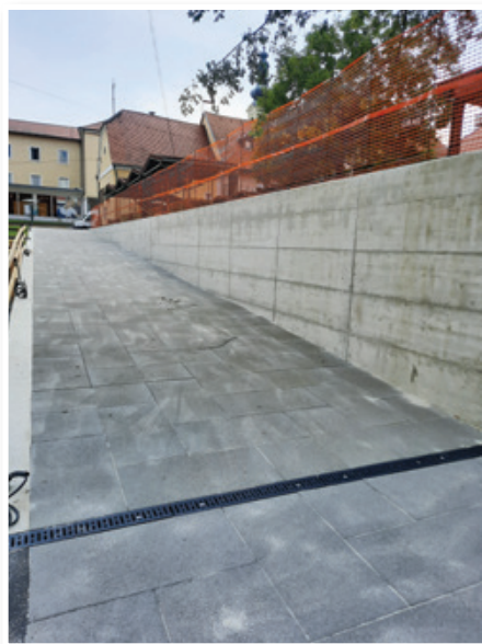
Ureditev klančine pri tržnici v Lenartu

Direkcija za infrastrukturo RS je investitor gradnje krožnega križišča pri trgovini Spar na regionalni cesti Lenart-Gornja Radgona. Poleg krožišča bo zgrajen tudi uvoz v Novo poslovno industrijsko cono. Vrednost del znaša okoli 250.000 EUR.