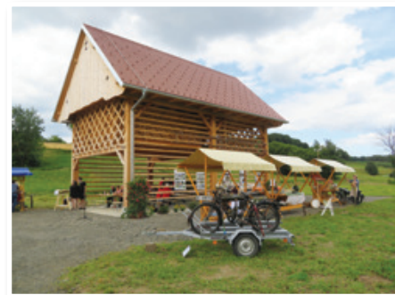
Pod kozolcem v Andrencih so v okviru projekta »Ovtar pod kozolcem« pripravili drugi dogodek »Gremo na podeželje«.