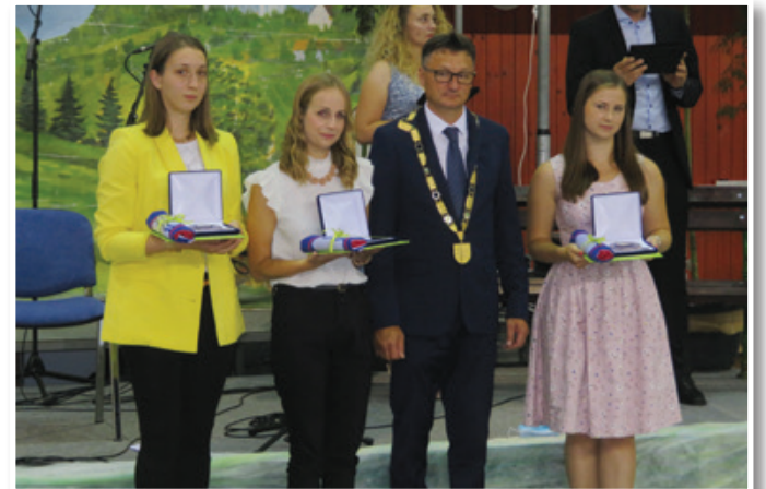
Na proslavi so podelili županova priznanja najboljšim športnicam in športnikom, učencem in učencem, dijakinjam in dijakom ter študentkam in študentom oziroma diplomantkam in diplomantom.