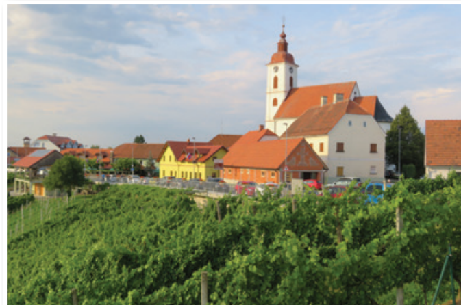
Občina Sveta Ana, ki že ima certifikat »Slovenia Green Destination Silver«, je dobila še certifikat »Brez plastike«, ki dokazuje, da si občina prizadeva za varovanje naravnega okolja, ki je v Sveti Ani zares čudovito, kar dokazuje tudi naša fotografija.

Občina Sveta Ana je čez poletje objavila tudi javni razpis za zbiranje ponudb za oddajo tržnih stanovanj v najem z možnostjo odkupa. Skladno s pogoji razpisa občina z izbranimi ponudniki sklene pogodbo o oddaji stanovanja za določen čas treh let. Najmanj po dveh letih lahko najemnik stanovanje skupaj s parkirnim mestom od občine odkupi. Vrednost stanovanja pred tem oceni sodno zapriseženi cenilec, najemniku pa občina v vrednost kupnine šteje višino plačane varščine ob najemu stanovanja in že plačane najemnine za stanovanje. Preostanek kupnine pa mora najemnik oziroma kupec plačati v