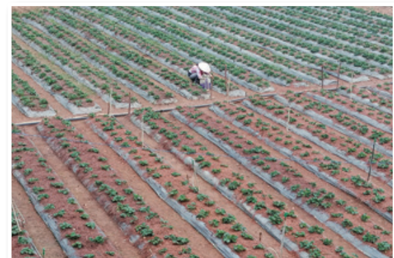
Med jagodami primanjkuje delovne sile, verjetno so vsi v rižu.