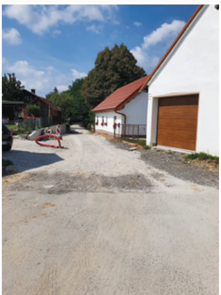
Obnova ceste v Zavrhu

Občina Lenart se je odločila, da glavne sestavne dele čistilne naprave povsem zamenja z novimi in z novo tehnologijo. Zvišanje kapacitet naprave je potrebno tudi zaradi predvidene povečane pozidave in predvsem zaradi pralniških vod Zavoda Hrastovec. Tehnološka rešitev temelji na odstranitvi obstoječega sistema biološke obdelave in izgradnji nove čistilne naprave s pritrjeno biomaso po sistemu MBBR. Prednost tega sodobnega sistema je zlasti povečanje učinka čiščenja odpadnih vod, enostavnost in cenejša upravljanje čistilne naprave. Na podlagi izvedbe