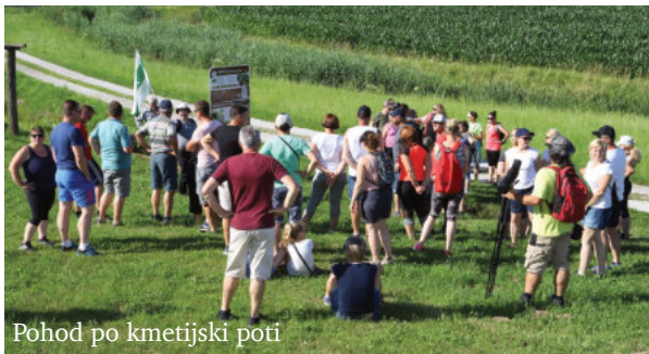
Pohod po kmetijski poti