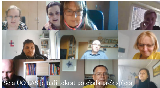
Seja UO LAS je tudi tokrat potekala prek spleta

Kot smo že poročali, je LAS Ovtar Slovenskih goric konec leta 2020 s strani Ministrstva za gospodarski razvoj in tehnologijo (MGRT) prejela dodatnih 265.954,66 EUR, ki jih bo skupaj z ostalimi razpoložljivimi sredstvi razpisala v letu 2021. Sredstva so namenjena za sofinanciranje operacij v letih 2022 in 2023. Predpogoj za objavo novega javnega poziva za črpanje sredstev iz Evropskega sklada za regionalni razvoj (ESRR) je tudi potrjena četrta sprememba Strategije lokalnega razvoja LAS Ovtar Slovenskih goric (SLR), v kateri se mora v finančni okvir predhodno vključiti dodeljena dodatna sredstva sklada ESRR v programskem