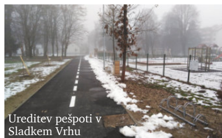
Ureditev pešpoti v Sladkem Vrhu