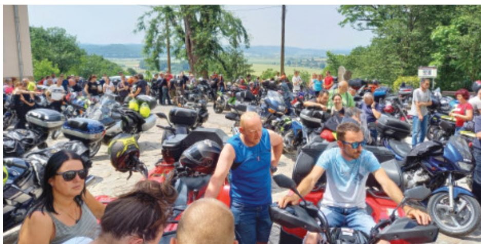
Na blagoslovu motorjev več kot 100 motoristov