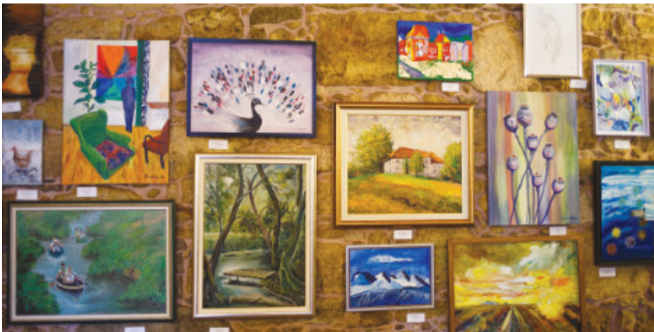
JSKD, odprtje regijske likovne razstave Ponovno Prosto 2020