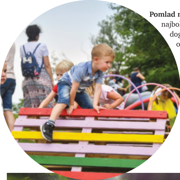
Pomlad na jasi, najboljša dogajanja za otroke, Turistično društvo