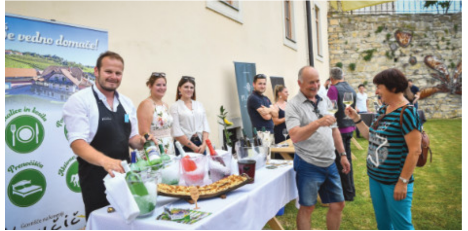
Kibflajšfest in Vinska galerija