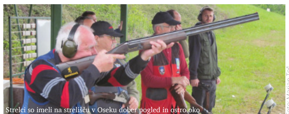
Strelci so imeli na strelišču v Oseku dober pogled in ostro oko