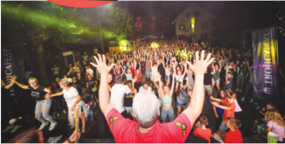
Kingstoni so bili pika na i drugega dne festivalskega dogajanja