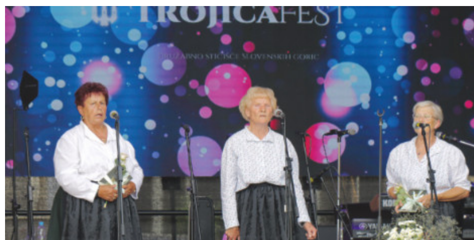
30 let pevk ljudskih pesmi Sveta Trojica, TD