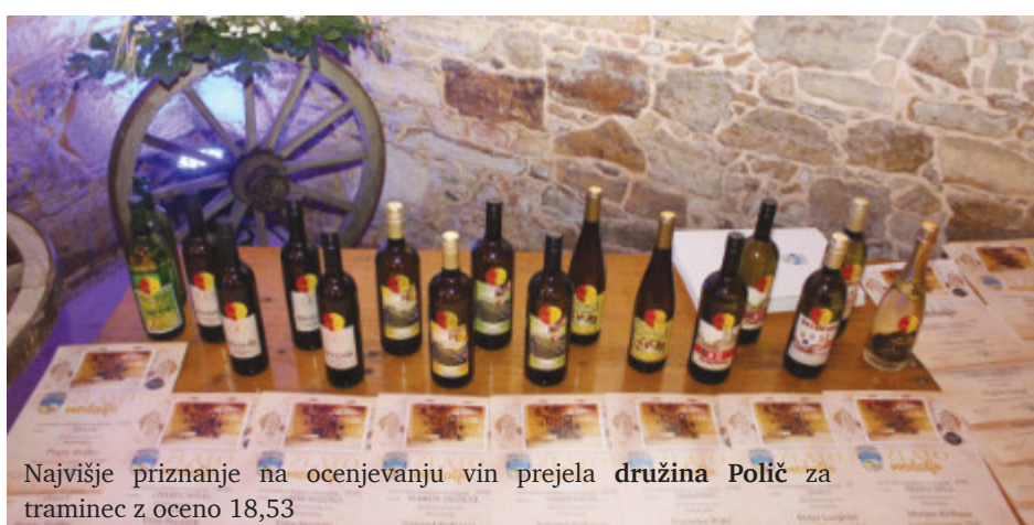
Najvišje priznanje na ocenjevanju vin prejela družina Polič za traminca z oceno 18,53