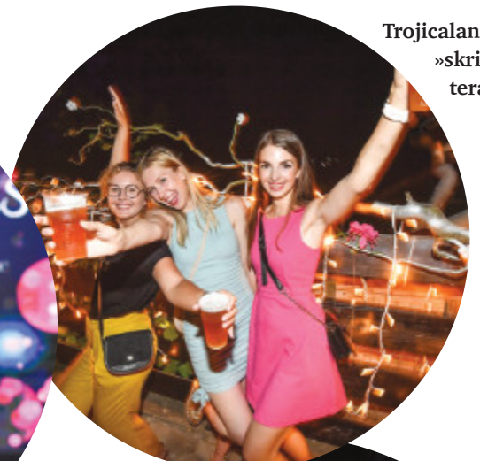
Trojicaland – »skrita« terasa