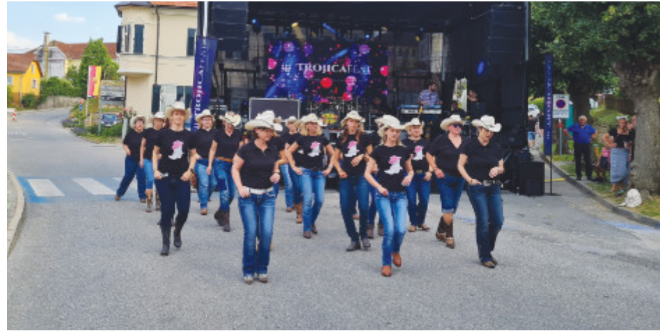
Pravi ulični show – plesala se je salsa, dogajanje so popestrile plesalke skupine Countryline dance