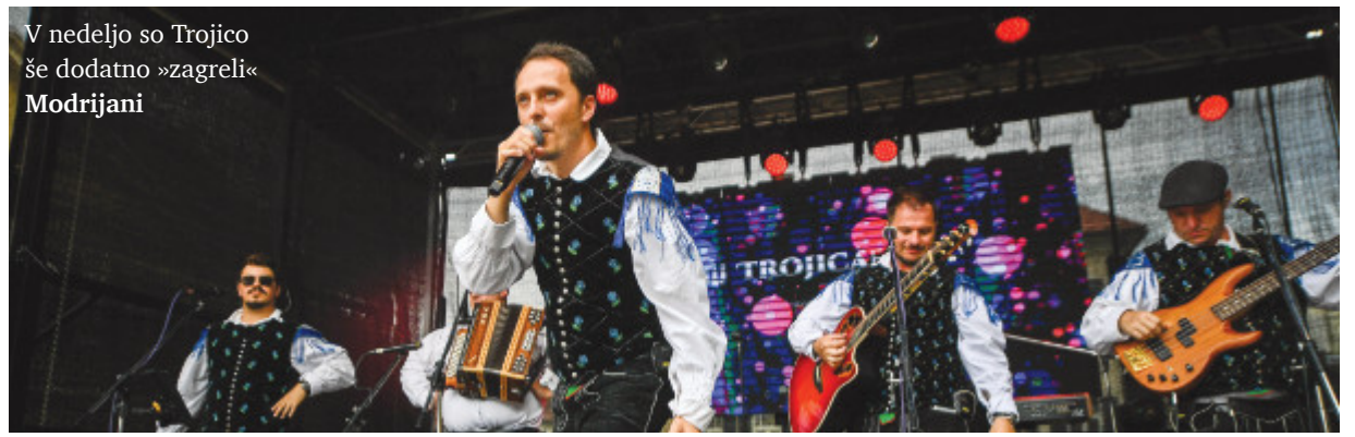
V nedeljo so Trojico še dodatno »zagreli« Modrijani