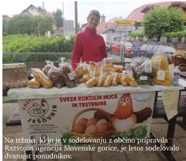
Na tržnici, ki jo je v sodelovanju z občino pripravila Razvojna agencija Slovenske gorice, je letos sodelovalo dvanajst ponudnikov.