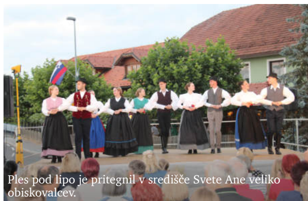
Ples pod lipo je pritegnil v središče Svete Ane veliko obiskovalcev.