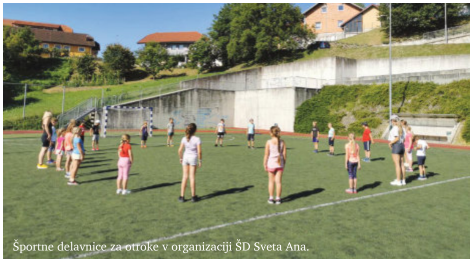
Športne delavnice za otroke v organizaciji ŠD Sveta Ana.