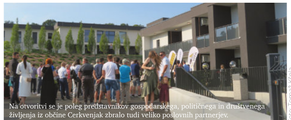
Na otvoritvi se je poleg predstavnikov gospodarskega, političnega in društvenega življenja iz občine Cerkevjak zbralo tudi veliko poslovnih partnerjev.