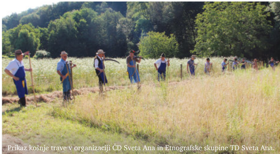
Prikaz košnje trave v organizaciji ČD Sveta Ana in Etnografske skupine TD Sveta Ana.