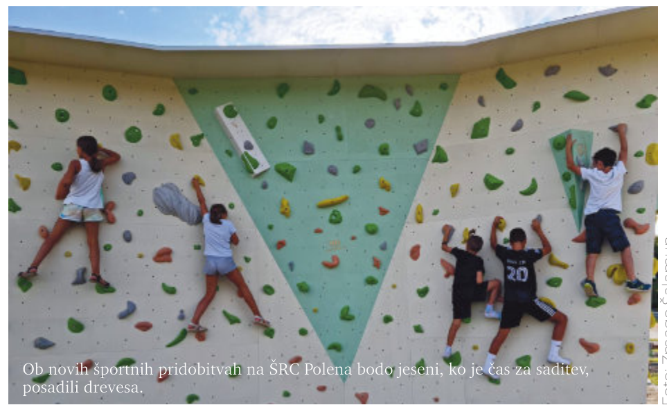
Ob novih športnih pridobitvah na ŠRC Polena bodo jeseni, ko je čas za saditev, posadili drevesa.