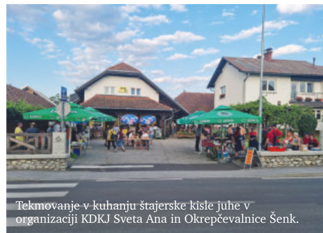
Tekmovanje v kuhanju štajerske kisle juhe v organizaciji KDKJ Sveta Ana in Okrepčevalnice Šenk.