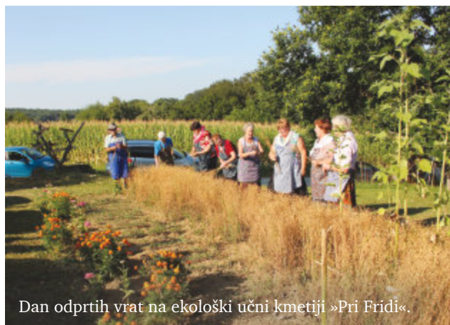
Dan odprtih vrat na ekološki učni kmetiji »Pri Fridi«.