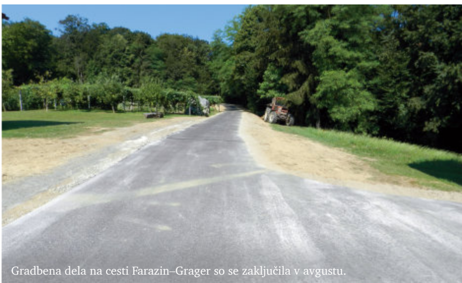
Gradbena dela na cesti Farazin–Grager so se zaključila v avgustu.

Cestni odsek Farazin–Grager v dolžini dobrih 530 metrov, na katerem so bila dela zaključena v začetku meseca avgusta, je uredilo podjetje Pomgrad, d.d. iz Murske Sobotice. Vrednost investicije je bila nekaj manj kot 60 tisoč evrov z DDV.