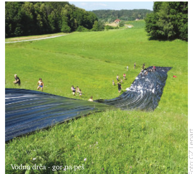
Vodna drča - gor pa peš

Ko bomo naslednje leto pripravljali 11. tabor gasilske mladine GZ Lenart, najbrž tudi ne bo potrebne posebne reklame in bo tabor polno zaseden z mladimi gasilci iz naših krajev. In spet bomo združili moči in za tri dni postali mladi in igrivi. Vas mika? Dobrodošli!