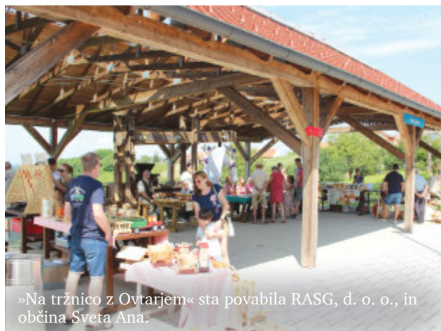
»Na tržnico z Ovtarjem« sta povabila RASG, d. o. o., in občina Sveta Ana.