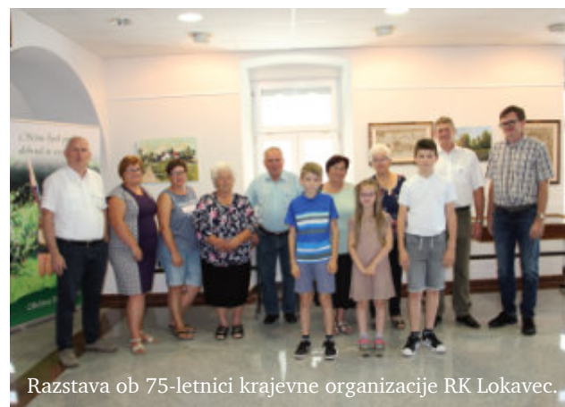
Razstava ob 75-letnici krajevne organizacije RK Lokavec.