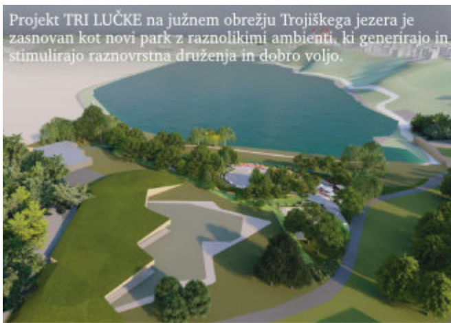
Projekt TRI LUČKE na južnem obrežju Trojiškega jezera je zasnovan kot novi park z raznolikimi ambientmi, ki generirajo in stimulirajo raznovrstna druženja in dobro voljo.

V sredo, 17. avgusta, je bila pripravljena javna obravnava dopoljenega osnutka Ureditvenega načrta za jezero v Sveti Trojici z upoštevanimi smernicami vseh pristojnih nosilcev urejanja prostora. Splošna javnost se povabilu na javno obravnavo, žal, ni odzvala, ima pa možnost v času javne razgrnitve do konca avgusta 2022 podati pisne pripombe in predloge k razgrnjenemu gradivu (podrobnosti na spletni