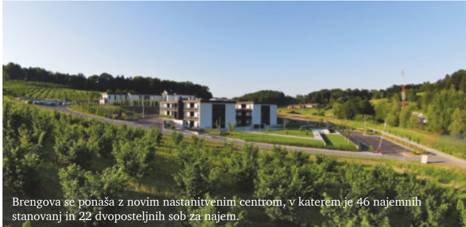
Brengova se ponaša z novim nastanitvenim centrom, v katerem je 46 najemnih stanovanj in 22 dvoposteljnih sob za najem.

kompleksa najemnih stanovanj, ki jih nameravata oddajati na trgu za začasno bivanje. »Vsi objekti bodo primarno namenjeni začasni namestitvi, hkrati pa se bomo sproti prilagajali razmeram in potrebam na trgu. Želim si, da bi bila ta