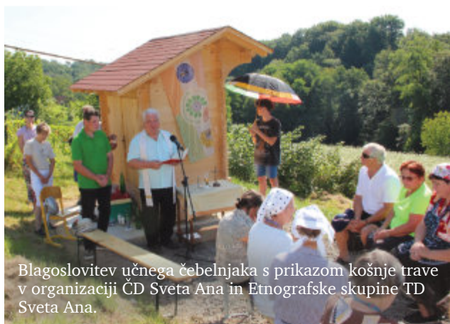
Blagoslovitev učnega čebelnjaka s prikazom košnje trave v organizaciji ČD Sveta Ana in Etnografske skupine TD Sveta Ana.