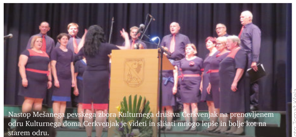
Nastop Mešanega pevskega zbora Kulturnega društva Cerkevjak na prenovljenem odru Kulturnega doma Cerkevjak je videti in slišati mnogo lepše in bolje kot na starem odru.

Vrednost celotnega projekta je znašala nekaj več kot 32 tisoč evrov, Evropski sklad za regionalni razvoj pa je za njegovo izvedbo prispeval blizu 14.500 evrov.