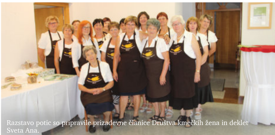
Razstavo potic so pripravile prizadevne članice Društva kmečkih žena in deklet Sveta Ana.