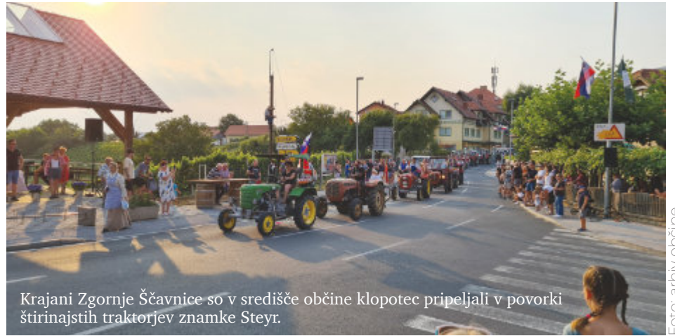
Krajanji Zgornje Ščavnice so v središče občine klopotec pripeljali v povorki štirinajstih traktorjev znamke Steyr.

Ko je klopotec stal in ponosno »zapel«, pa se je začel družabni del prireditve s pogostitvijo. Za izvrstno jedajo in pijačo so poskrbeli članice Društva deklet in žena Sveta Ana in člani Društva vinogradnikov Sveta Ana, obiskovalci pa so se ob živi glasbi zavrteli na križišču pred občinsko zgradbo, saj so bile vse ceste skozi središče Svete Ane v času osrednje prireditve ob občinskem prazniku zaprte.