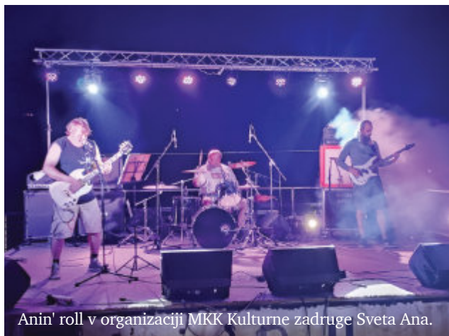
Anin' roll v organizaciji MKK Kulturne zadruge Sveta Ana.