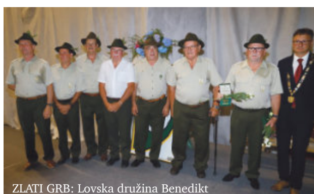
ZLATI GRB: Lovska družina Benedikt