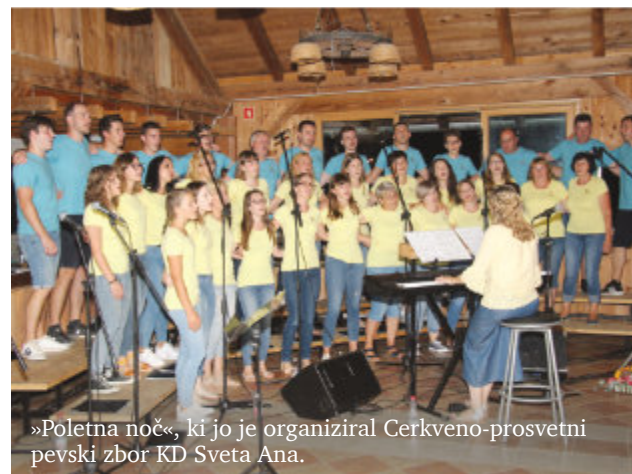
»Poletna noč«, ki jo je organiziral Cerkevno-prosvetni pevski zbor KD Sveta Ana.