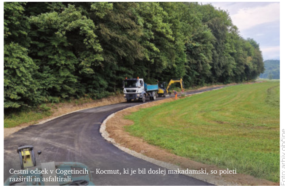
Cestni odsek v Cogetincih – Kocmut, ki je bil doslej makadamski, so poleti razširili in asfaltirali.

Sicer pa Občina Cerkvenjak nameni za ceste velik del svojega proračuna. Tako bo letos za modernizacijo cestnih odsekov, vzdrževanje občinskih cest in poti ter zimsko službo skupaj namenila blizu pol milijona evrov. Pri modernizaciji cest Občina Cerkvenjak uspešno sodeluje s Telekomom, ki ob njih polaga kanalizacijo za optiko, tako da mu ob polaganju optičnega kabla zemlje ni treba ponovno prekopavati.