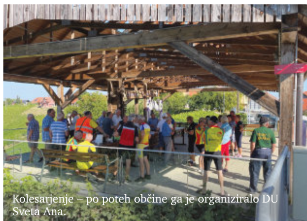
Kolesarjenje – po poteh občine ga je organiziralo DU Sveta Ana.