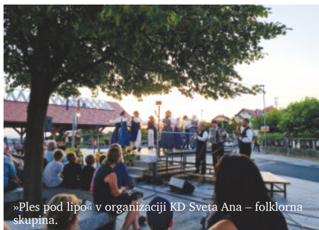
»Ples pod lipo« v organizaciji KD Sveta Ana – folklorna skupina.