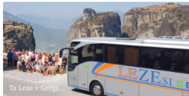
Ta Leze v Grčiji.