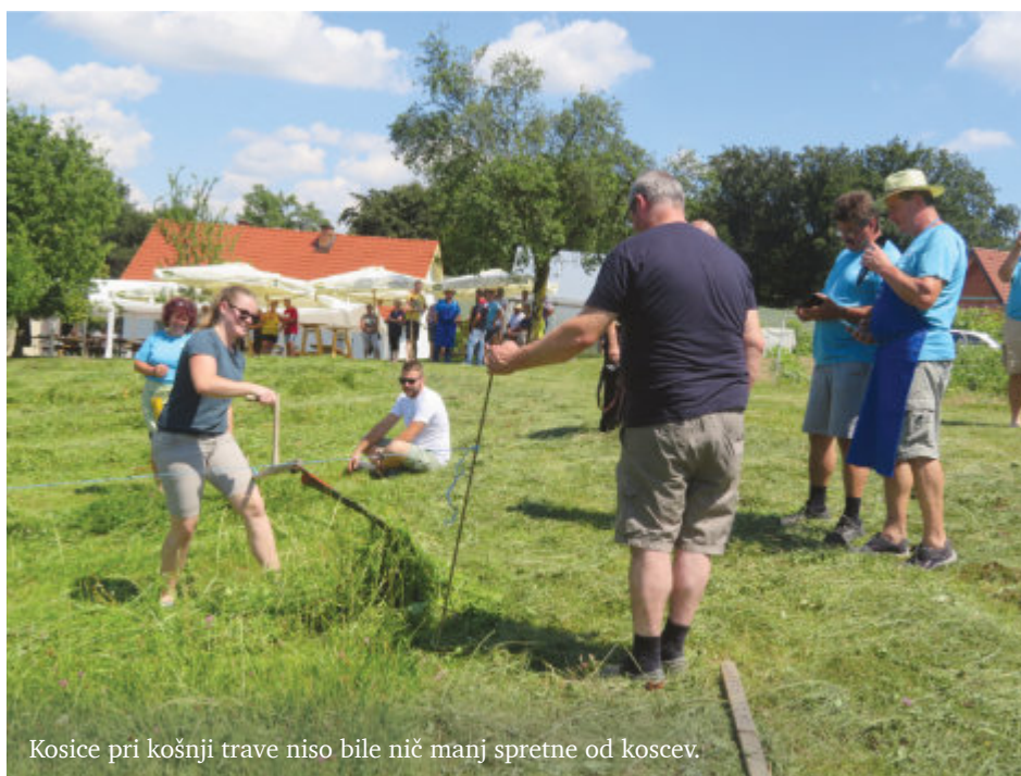
Kosice pri košnji trave niso bile nič manj spretno od koscev.