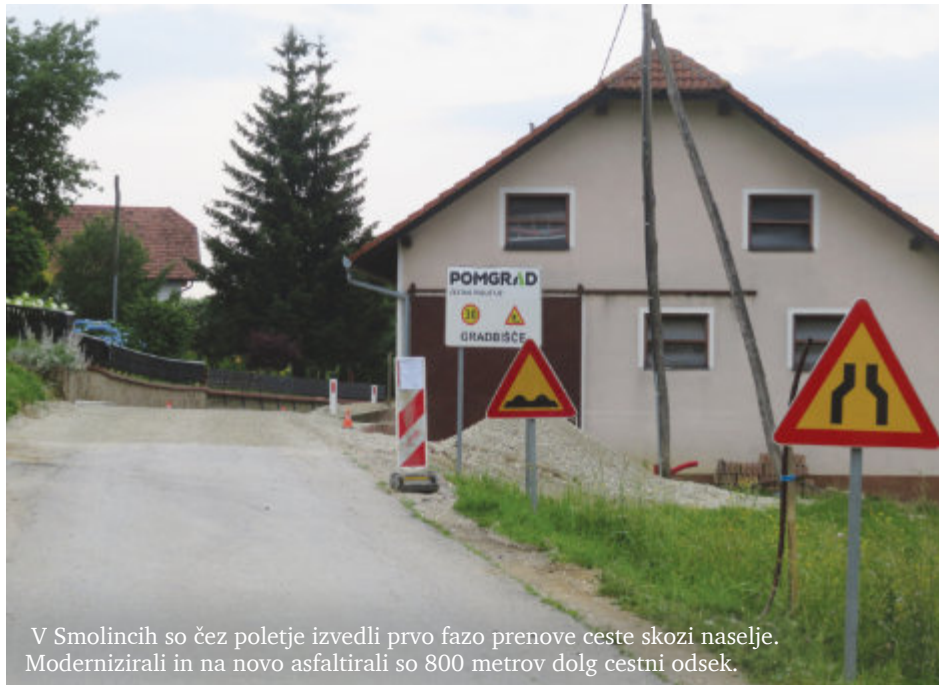
V Smolincih so čez poletje izvedli prvo fazo prenove ceste skozi naselje. Modernizirali in na novo asfaltirali so 800 metrov dolg cestni odsek.