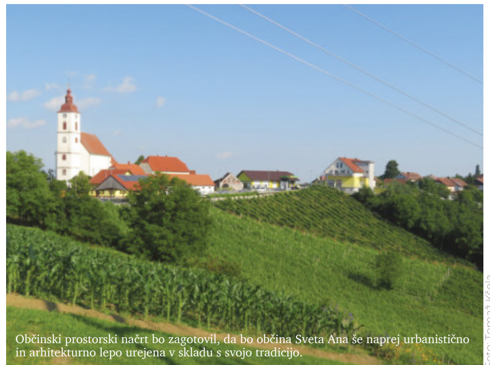
Občinski prostorski načrt bo zagotovil, da bo občina Sveta Ana še naprej urbanistično in arhitekturno lepo urejena v skladu s svojo tradicijo.

Občinski prostorski načrt je na kratko nemogoče predstaviti, saj obsega 92 na drobno tipkanih strani in številne priloge. Poleg splošnih ciljev prostorskega razvoja dokument ureja tudi podrobnosti, ki jih morajo upoštevati vsi. Za primer si denimo oglejmo, kaj piše o fasadah hiš: te morajo biti v pastelnih in svetlih barvah ter ne v kričevih. Strešne kritine morajo biti opečne, črne, sive ali druge temne barve. Minimalni naklon streh, če niso ravne, mora biti 30 stopinj. Dokument natančno opredeljuje tudi, kje in za kakšne potrebe je mogoče graditi pomožne objekte, ter celo to, kako visoke in kakšne so lahko ograje med sosedi. Vse je natanko določeno, tako da bo razvoj Svete Ane, ki je že danes lepo urejena, še naprej skladen in usklajen s potrebami in interesi vseh.