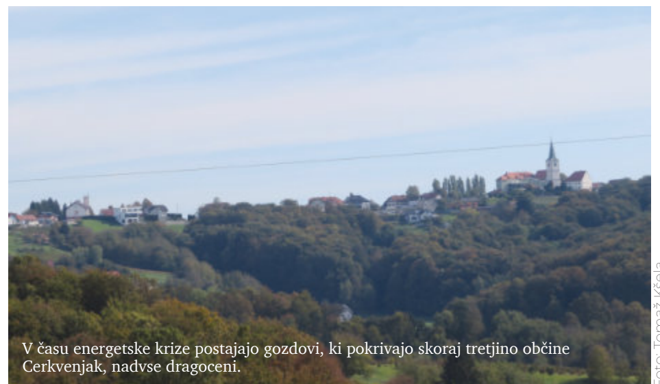
V času energetske krize postajajo gozdovi, ki pokrivajo skoraj tretjino občine Cerkevjak, nadvse dragoceni.

Po oceni strokovnjakov vsi uporabniki na območju občine Cerkevjak porabijo 11.758 MWh energije, od tega 7835 MWh iz biomase (66,6 odstotka), 1930 MWh iz ekstra lahkega kurilnega olja (16,4 odstotka), 899 MWh iz utekočinjenega