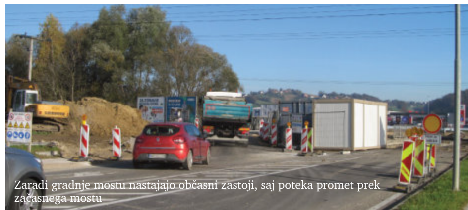
Zaradi gradnje mostu nastajajo občasni zastoji, saj poteka promet prek začasnega mostu

Novi most bo sodobno grajen in bo ustrezal vsem zdajšnjim standardom in normativom, zlasti glede njegove nosilnosti, kar ni nepomembno, saj so obremenitve na tej regionalni cesti vse večje. V okviru izgradnje bodo uredili primerne površine tudi za pešce in kolesarje. To je pomembno zaradi navezanosti na kolesarsko pot iz Lenarta proti Sveti Trojici in Benediktu. Naj ob tem zapišemo, da tudi sicer na veliko urejajo kolesarske povezave na celotnem območju osrednjih Slovenskih goric. Dela so v polnem teku, še zlasti v občinah Sveta Trojica, Lenart in Sveti Jurij v Slovenskih goricah. Vrednost gradbenih del novega mostu čez reko Velko znaša skoraj 1,5 milijona evrov, gradbena dela pa izvaja podjetje MARKOMARK NIVAL, d. o. o.