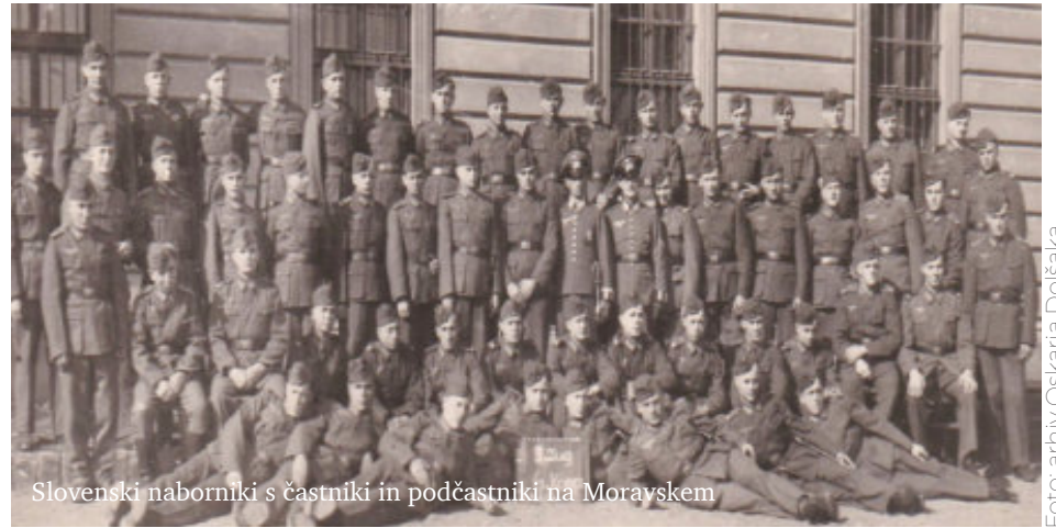
Slovenski naborniki s častniki in podčastniki na Moravskem