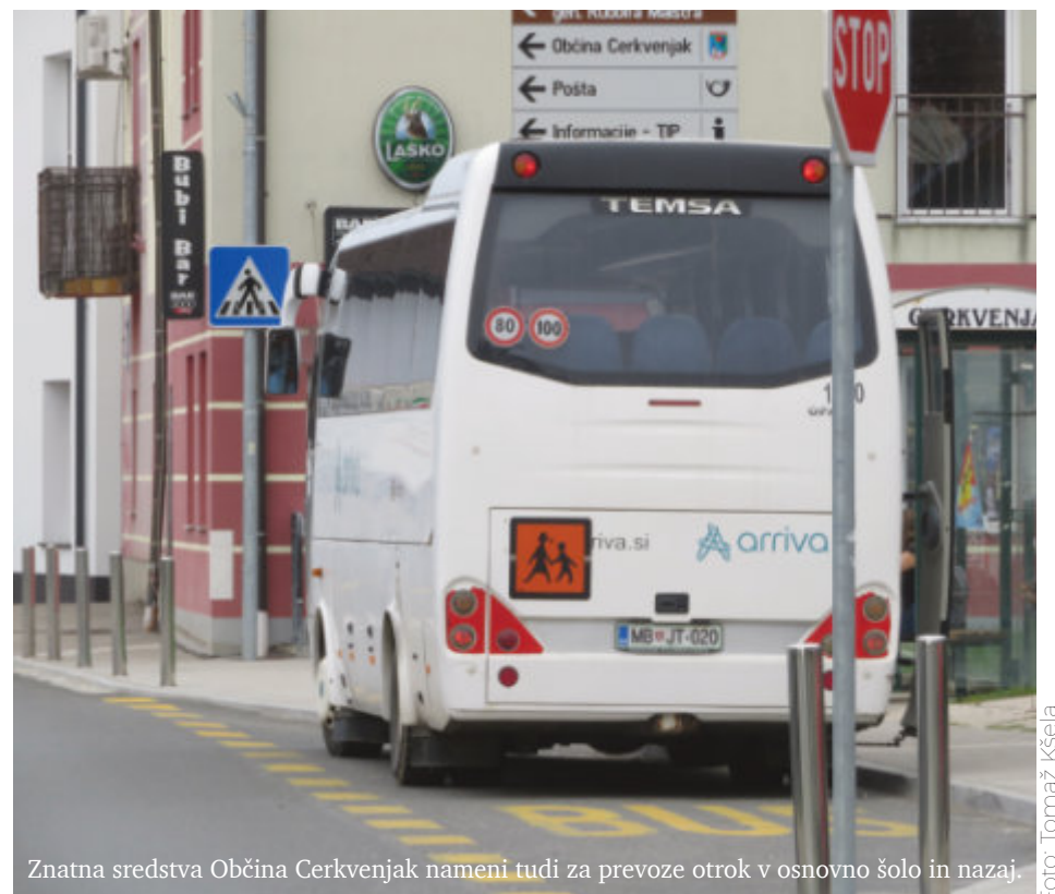
Znatna sredstva Občina Cerkvenjak namenijo tudi za prevoze otrok v osnovno šolo in nazaj.

Za socialno varstvo, zlasti mladih družin, starejših, socialno šibkih, telesno in duševno prizadetih, zasvojenih in drugih