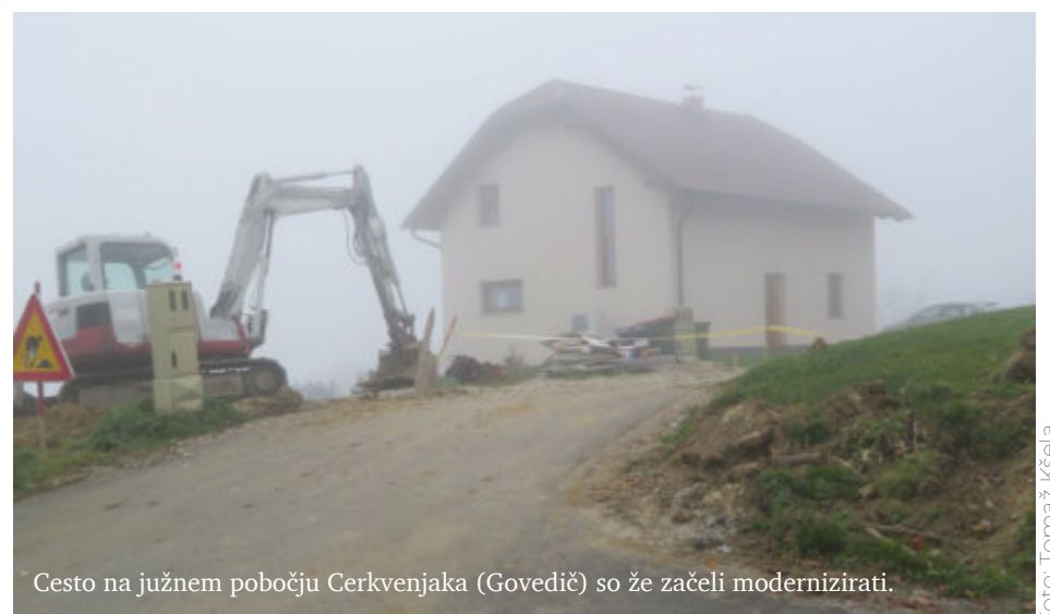
Cesto na južnem pobočju Cerkevjaka (Govedič) so že začeli modernizirati.

tej lokaciji, kos zemljišča pa je odkupilo tudi gradbeno podjetje, ki bo na njem zgradilo dva stanovanjska bloka s po 12 stanovanji. Skupaj jih bodo torej zgradili 24. Za to, da bodo lahko začeli graditi novo stanovanjsko naselje, mora občina najprej zgraditi dovozno cesto do omenjenega zemljišča. Izgradnja se je že začela, kar dokazuje tudi naša fotografija.