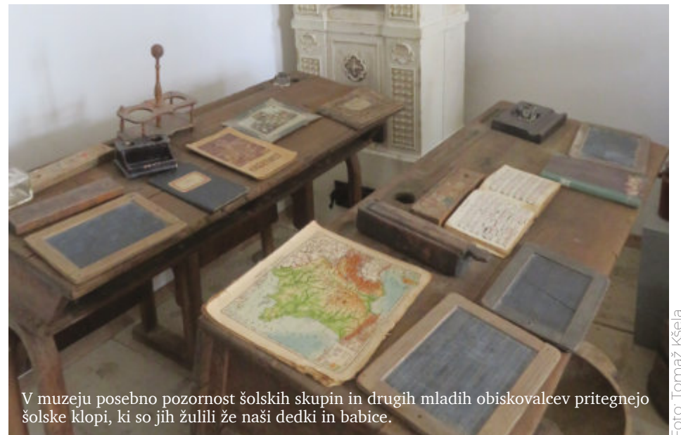
V muzeju posebno pozornost šolskih skupin in drugih mladih obiskovalcev pritegnejo šolske klopi, ki so jih žulili že naši dedki in babice.