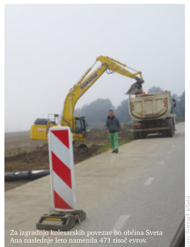
Za izgradnjo kolesarskih povezav bo občina Sveta Ana naslednje leto namenila 471 tisoč evrov.

Iz načrta razvojnih programov je razvidno, da bo Občina Sveta Ana naslednje leto veliko investirala v izgradnjo prometne infrastrukture in komunikacij. Za izgradnjo kolesarskih povezav bo namenila 471 tisoč evrov, za modernizacijo ceste Žice–Sveta Ana 100 tisoč evrov, za modernizacijo ceste JP 70+231 okoli 345 tisoč evrov, za JP 704–342 (Ledinek–Markuš) 35 tisoč evrov in za ureditev ulice v stanovanjskem naselju na Krivem Vrhu 12,5 tisoč evrov.