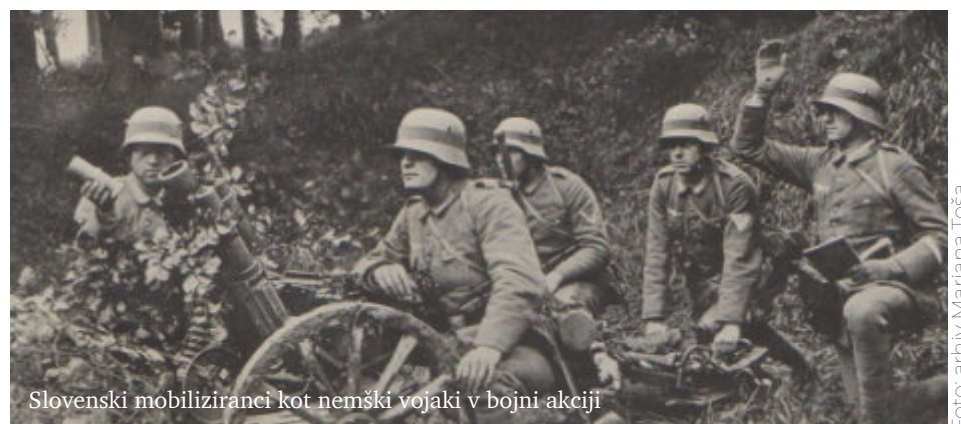
Slovenski mobiliziranci kot nemški vojaki v bojni akciji