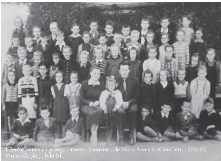
Učenke in učenci prvega razreda Osnovne šole Sveta Ana v šolskem letu 1952/53. V razredu jih je bilo 51.