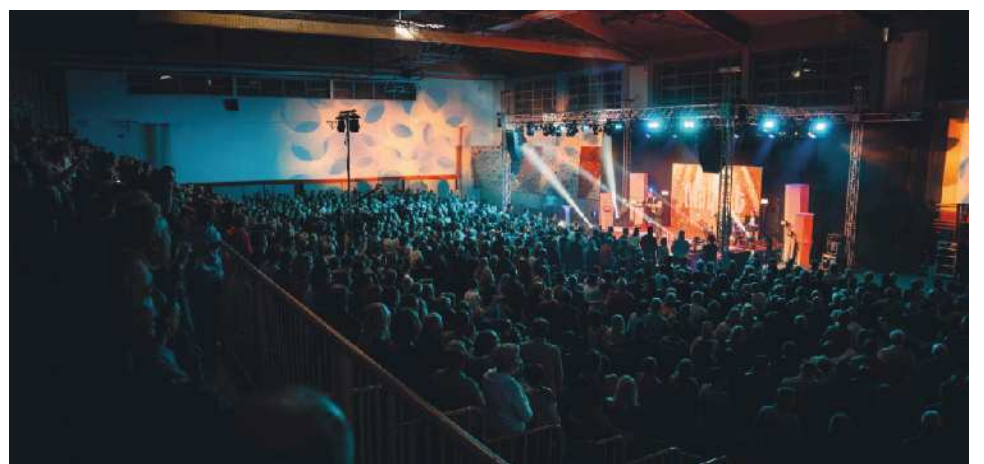
Prireditev Moč glasbe nas združuje si je ogledalo okoli 1500 obiskovalcev.