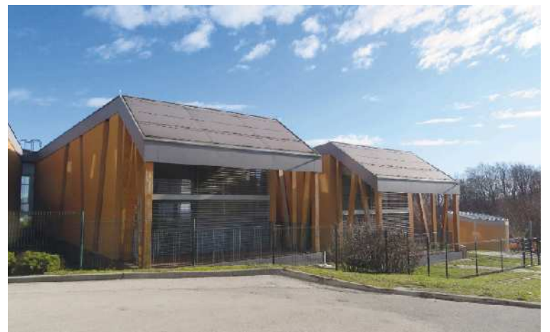
Zaradi vse večjega števila otrok bodo morali v Cerkvenjaku dograditi vrtec.

zadnjih letih. Po podatkih Statističnega urada RS ima letos Cerkvenjak 2.216 prebivalcev. Pomembno je, da ni naraslo samo število prebivalcev v starostni skupini 65+, temveč tudi v starostnih skupinah do 14 let in od 15 do 64 let. Kontingent delovno aktivnega prebivalstva v Cerkvenjaku se torej povečuje, kar sicer ne nujno, pa vendarle prispeva k večjemu blagostanju. Spodbudno je tudi, da se je v strukturi prebivalstva krepko povečalo število dojenčkov, starih do enega leta. Teh je bilo leta 2008 13, zadnja leta pa jih je od 21 do 27. Prebivalstvo pa se ne povečuje samo na račun porasta rodnosti, temveč tudi