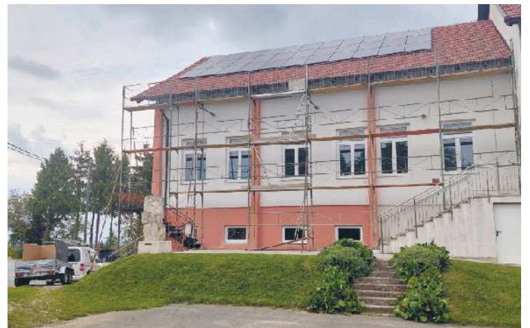
Sredstva za to, da imamo danes lastno sončno elektrarno na strehi gasilskega doma, smo s prodajo starega železa, koledarjev, prostovoljnim delom in donacijami zbirali več let.