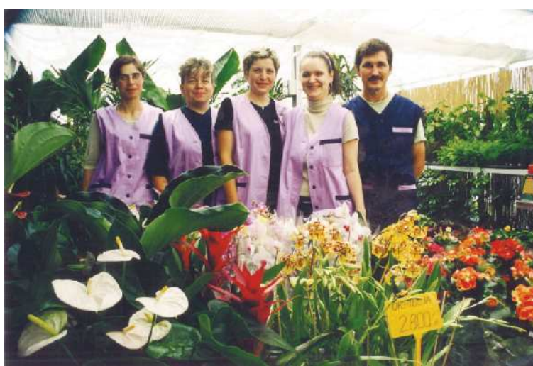
Otvoritev vrtnega centra na Mariborski cesti v Lenartu.

Trideset let je le začetek in CER - CVET z navdušenjem zre v prihodnost, polno novih izzivov in rasti.