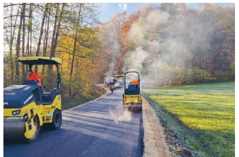
Modernizacija in razširitev ceste v Osojnici sta Občino Cerkvenjak stali blizu 150 tisoč evrov.

Zato je Občina Cerkvenjak cesto ob modernizaciji razširila iz 4,5 metra na 5 metrov, ob cestišču pa je uredila bankine in mulde. Dela je izvedlo podjetje GMW, d. o. o., iz Radencev, celoten projekt pa je Občino Cerkvenjak stal blizu 150.000 evrov.