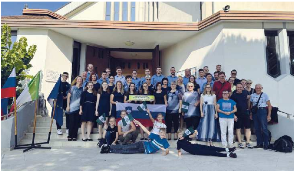
Fotografija pred cerkvijo, v kateri je prepeval zbor iz Svete Ane

Nekateri kulturniki so s seboj popeljali tudi partnerje in družine, kar je bilo pevcem v veliko veselje, saj so se jim na tak način zahvalili za podporo in pomoč, ki jo izkazujejo članom zbora, ko ti hodijo na vaje in sodelujejo na raznih prireditvah. Hkrati si pevci želijo, da so otrokom, ki so bili zraven, prikazali prijetno druženje in v njih vzbudili željo po nadaljevanju tradicije petja pri Sveti Ani. Kljub pestremu kulturnemu dogajanju pa so kulturniki našli prosti čas, ki so ga preživeli na plaži v sproščeni vzdušju ob kopanju, igranju odbojke in petju na pomolu. Med potjo domov so se ustavili v Koprju, kjer v tamkajšnji stolnici domujejo po piščalih največje orgle v Sloveniji, ob spremljavi katerih so zapeli in se kasneje po zadnjem pogledu na morje srečno vrnili domov.