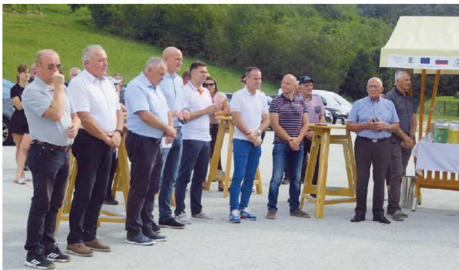
Na otvoritvi novega športnega objekta so poleg mladine, občanov in predstavnikov Občine Cerkvenjak sodelovali tudi športni delavci iz občine, regije in države.

Občina je igrišče na mivki zgradila na željo mladih. Župan je izrazil upanje, da jih bo to odtegnilo od računalnikov in mobilnih telefonov, s katerimi sedaj preživijo preveč časa.