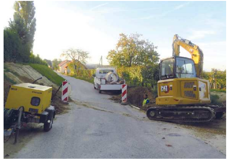
Ob gradnji optičnega omrežja in pri polaganju električnih kablov pod zemljo morajo večkrat cesto »prebiti« pod asfaltom s tako imenovanimi »raketami«.