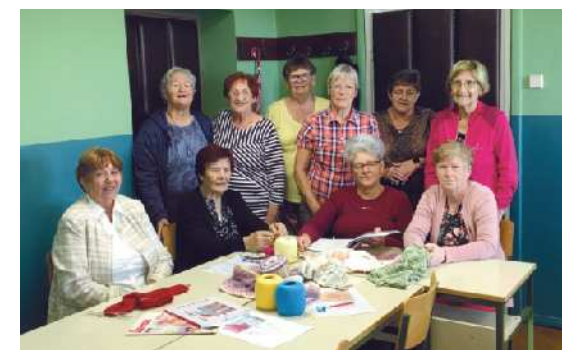
Skupina ročnih del