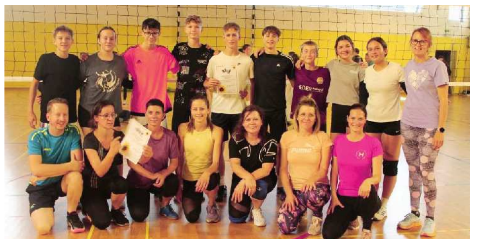
Učenci so na odbojgarski tekmi premagali učitelje

V sklopu tedna otroka je potekalo še precej drugih aktivnosti, prav vse pa so, verjamemo, otrokom dale veljavo, občutek pripadnosti, lepe spomine in spodbujale radovednost. Zakaj? Zato!