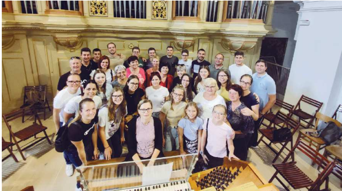
Anovški pevci ob po piščalih največjih orglah v Sloveniji – v Koprju

Mojca Simonič, besedilo Simon Fridl, fotografiji