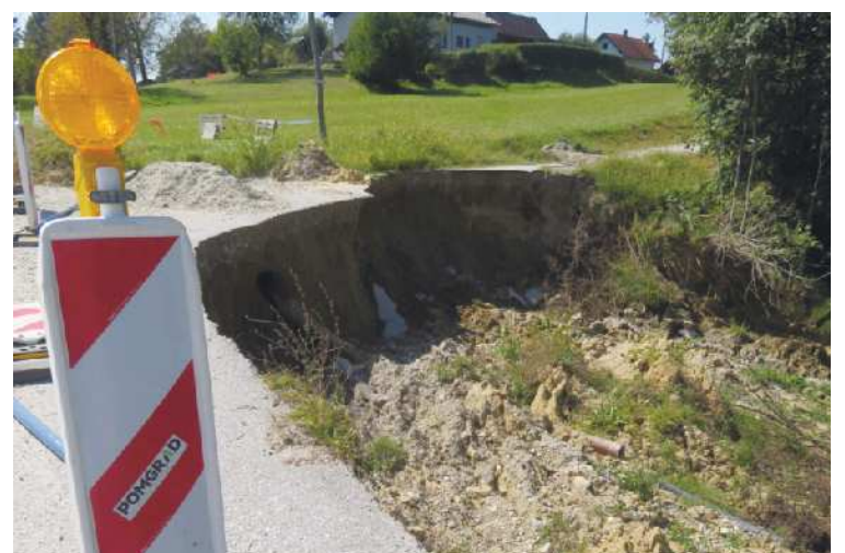
Plaz, ki se je po obilnem deževju sprožil na meji med občino Cerkvjenjak in Sveto Trojico, resno ovira promet in ogroža prometno varnost.