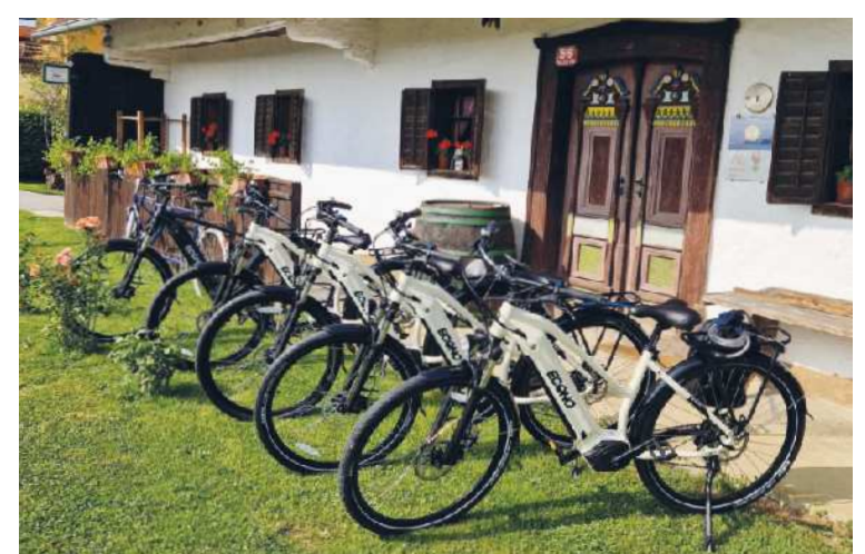
Kolesa pred Domačijo Kapl

Nakup e-koles sovпада z izgradnjo mreže kolesarskih poti po Slovenskih goricah. Ko bo kolesarska cestna mreža zaključena, se bo s kolesi možno popeljati v vse centre slovenskogoriških občin in čez mejo v sosednjo Avstrijo.