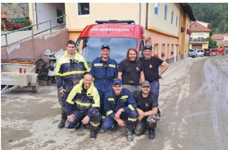
Ekipa cerkvjenjaških gasilcev v Črni na Koroškem

Tomaz Kšela, besedilo