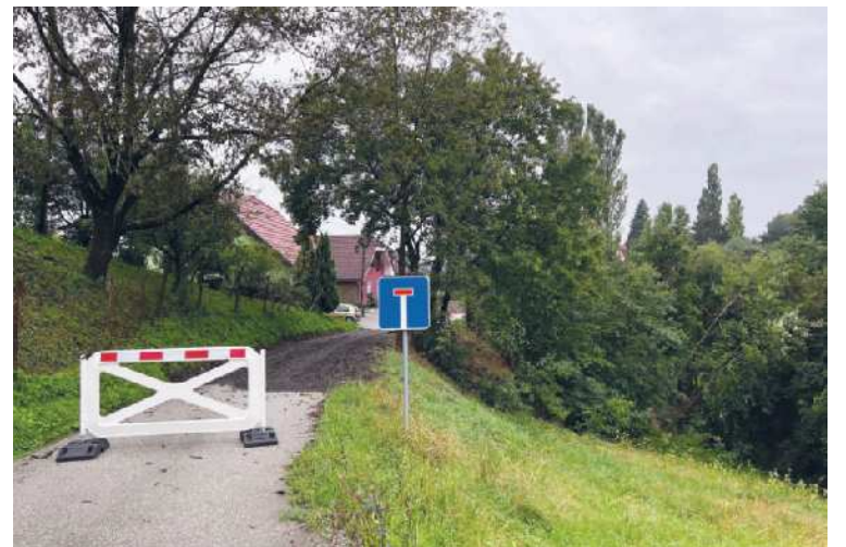
Popolna zapora ceste na Kremberku v občini Sveta Ana avgusta letos.