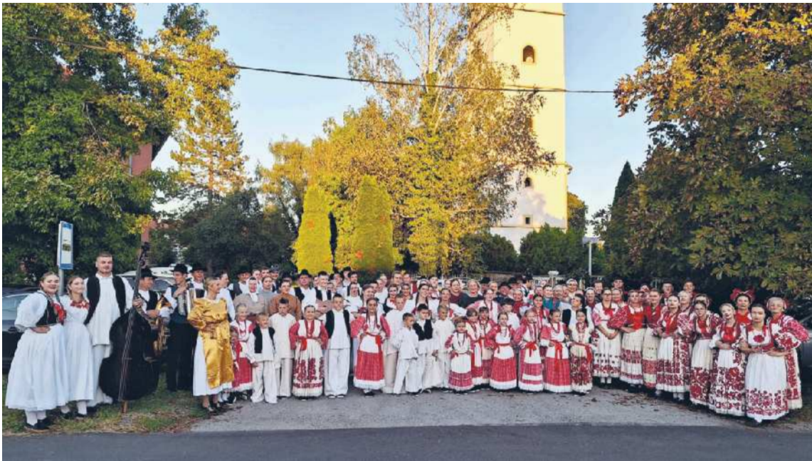
Jurovski folklorniki zablesteli na Hrvaškem: Praznovanje 30-letnice občine Rugvica skozi pesem, ples in prijateljstvo.

Barbara Ribič, besedilo