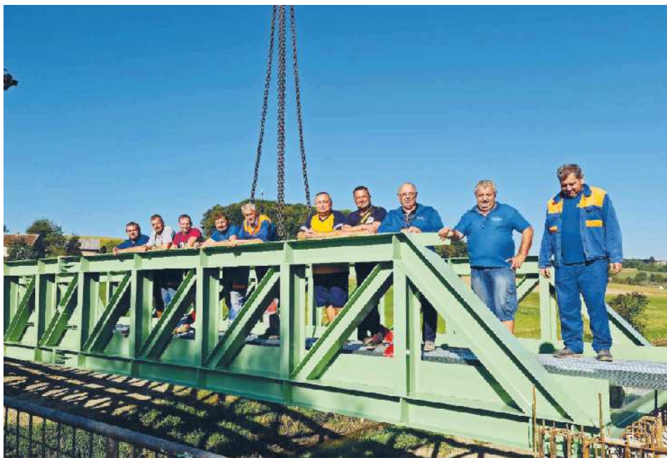
Deset mojstrov je v pičlih štirih urah postavilo 24 tonski jekleni most.

Nina Zorman, besedilo